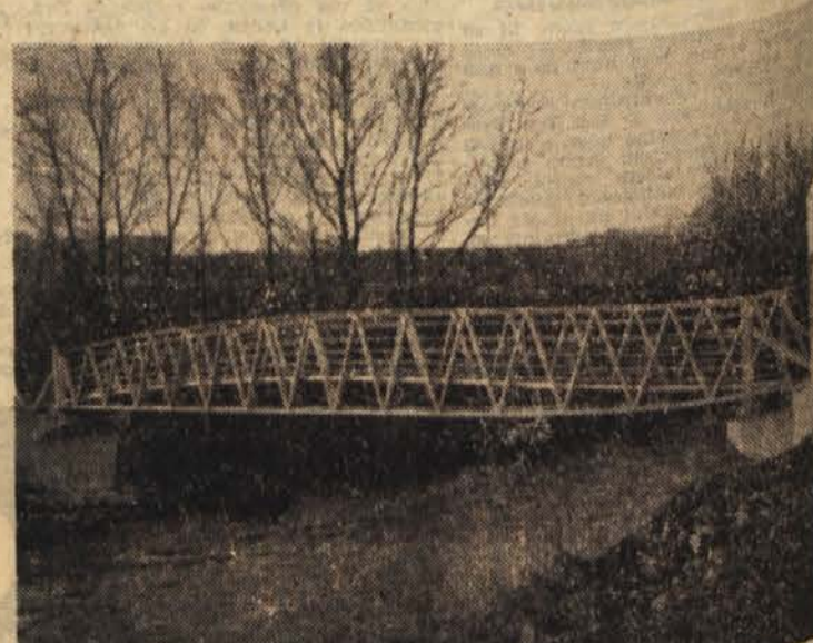
V sodobni tehniški dejavnosti se čedalje bolj uveljavlja aluminij. ki so ga že pred desetletji označili za kovino bodočnosti. Zdaj ga uporabljajo že v številnih industrijskih panogah, gornji posnetek pa kaže most čez angleško reko Ebbw v južnem Walesu; pri gradnji so uporabili izključno aluminijasto konstrukcijo.