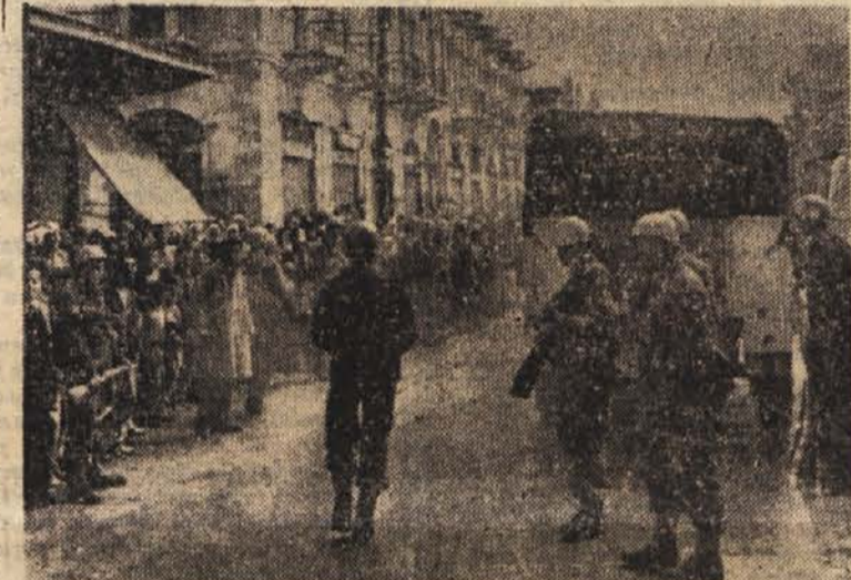
Varnostne sile OZN patrolirajo na glavni ulici Gaze za časa demonstracij prebivalstva

Londonski politični krogi pričakujejo, da bo dal minister za kolonije Lennox-Boyd v Spodnji zbornici novo izjavo o položaju, ki je nastal v zvezi s tem odgovorom izgnanega Makariosa.