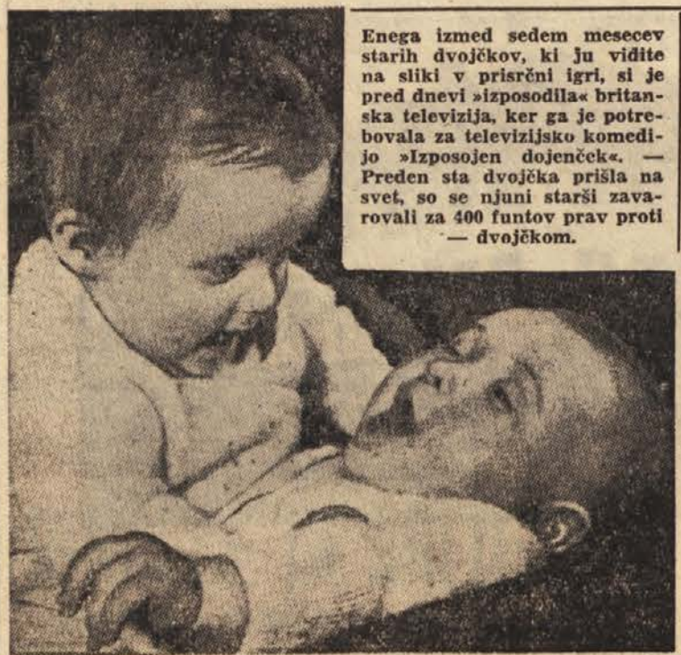
Enega izmed sedem mesecev starih dvojčkov, ki ju vidite na sliki v pristrni igri, si je pred dnevi »izposodila« britanska televizija, ker ga je potrebovala za televizijsko komedijo »Izposojen dojenček«. — Preden sta dvojčka prišla na svet, so se njuni starši zavarovali za 400 funtov prav proti dvojčkom.