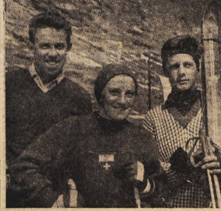
Kljub odsotnosti najboljših - še naprej zmage

Na šolah bodo obstajale tudi šolske telesnovzgojne organizacije, ki bodo skrbele v izvenšolskem času za telesno vzgojo mladine. Načrt prihodnjega dela telesne vzgoje na šolah pomeni pravi preobrat v primeru z dosedanjim. Kako pa bomo ta odlično sestavljeni načrt uresničili, je stvar novega študija, predvsem pa hitrega posega v dveh najbolj kritičnih točkah: strokovnem kadru in gmotnih pogojih.