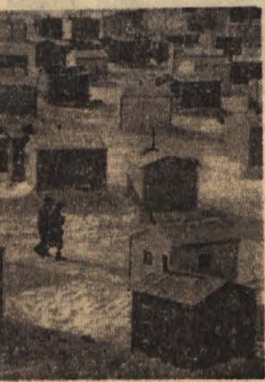
Kaže, da je zima mimo, torej bodo morali tudi kanadski ribiči kmalu podreti barake, ki so si jih v sezoni postavili na zamrznjeni reki St. Anna nad luknjami v ledu, da so skozije lovili ribe. Pri takih odprtinah je lov po navadi zelo obilen, ker ribe ob njih hlatajo za zrakom, pri tem pa postanejo mnoge izmed njih lahek ribiški plen.