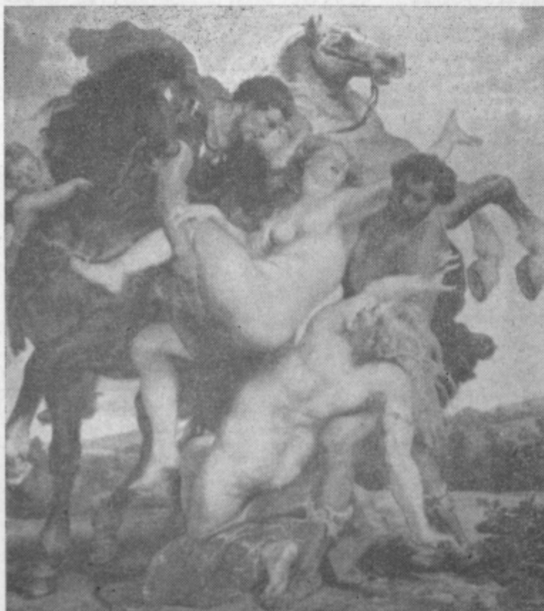
Peter Pavel Rubens: Rop Sabink (olje)

Kaj je boljšega za spektakl? Ženske v rokah surovih vojščakov, ženske na pol ljubeznive, na pol divje za hrbi junakov na iskrih konjih. Boj ni mirno doma-