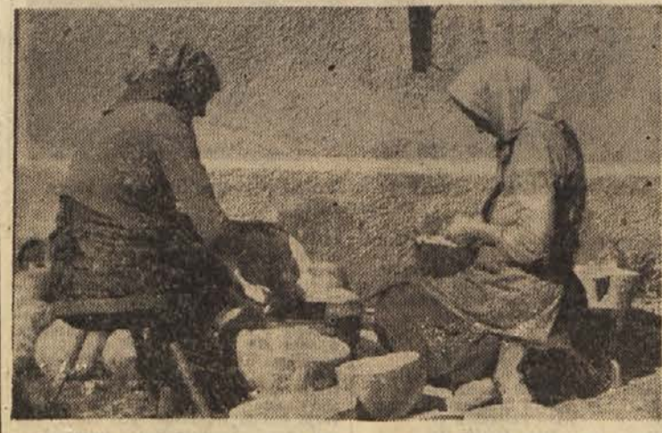
Buče so dobra krma za živino. Bučno seme pa daje okusno jedilno olje

davanji, razgovori in branjem pa so mladi zadružniki pomagali tudi sebi, razširjajoč tako svoje strokovno kmetijsko znanje. Med zasavskimi naprednimi živinorejci je precejšnje zanimanje za višinsko pašo mlade živine. Vsi sodijo, da so preureditvena in očiščevalna dela na Górah zdaj lepo zastavljena ter jih bodo podprli, da bi tako čimprej do kraja uredili ta višinski pašnik. (Z)