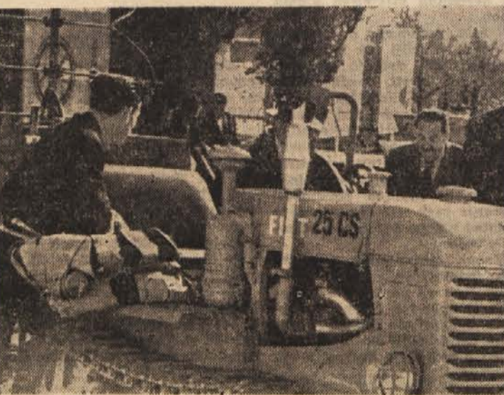
Obiskovalci so se najraje ustavljali na tistem delu razstave, kjer so bili kmetijski stroji

Doslej je mlekarina že nekaj mesecev poizkusno obratovala in dosegla kar lepe uspehe. Dnevno lahko pastirizirajo ali predelajo v mlečne izdelke okoli 10.000 l mleka. Kako se odvijajo delo v takšni mlekarini, so si lahko obiskovalci ogledali to pot kar na mestu. Spremljali so pot mleka od takrat, ko ga pripeljejo in vlijejo v veliko kad, pa vse do te-