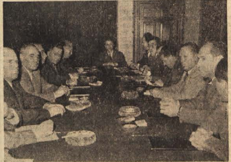
V Belem dvoru v Beogradu so se v torek začeli med vladnimi in partijskimi delegacijama Romunije in naše dežele razgovori pod vodstvom Gheorghia Deja in Stoice Chiva ter predsednika Tita

Kar se tiče Jugoslavije, se bo tudi v prihodnje zavzemala za krepitev ugleda in vloge te svetovne organizacije, ker so cilji in načela ustanovne listine OZN prav tako tudi cilji in načela jugoslovanske politike.