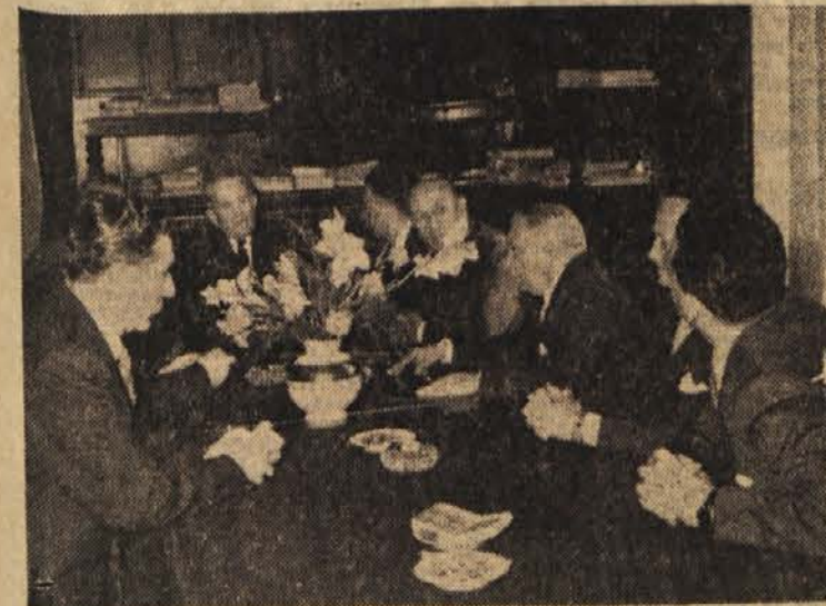
Predsednik Zvezne ljudske skupščine Moša Pijade je imel v ponedeljek dopoldne razgovor z izraelsko parlamentarno delegacijo, ki je pod vodstvom ministra za delo Mordehaja Namirja te dni na obisku v naši deželi