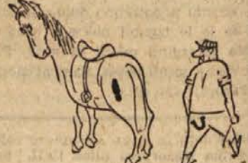
Zob za zob!