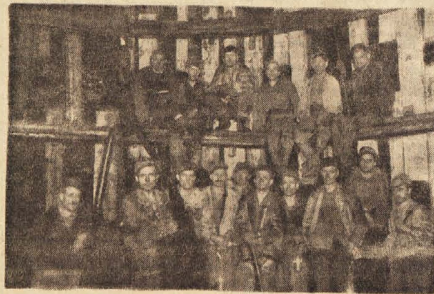
Brigada, ki pogloblja novi jašek pri rudniku lignita Velenje

doknadil zamujeno, je delovni kolektiv začel sprejemati osebne in skupinske obveznosti. Samo osebne obveznosti, sprejete na enem sestanku, so znašale 2200 ton. Pri izvrševanju obveznosti je dosegla najboljšo uspehe industrijska šola, ki jih je izpolnila 153 odstotno, slede ji