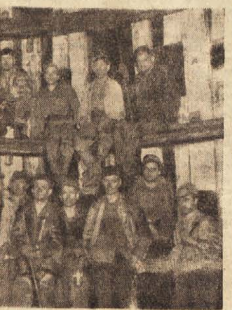
ki delajo tu, so udarniki. Med skupino, ki pogloblja novi jašek, in brigado, ki odpira vpadnik iz stare jame proti novemu jašku, je stalno tekmovanje. Obe brigadi dosejata pomembne uspehe.

plan presežen. Novi jašek je poglobljen že za 350 metrov. Rudarji so v odgovor informbirojevskim saboterjem povečali storitev in presejali norme do 29%. Naši rudarji poglobijo jašek za 28 do 50 metrov mesečno, kar je pomemben uspeh pri gradnjah novih jaškov. Vsi rudarji,