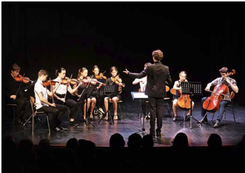
Medvoški godalni orkester med svojim prvim nastopom

Orkester ima trenutno 15 članov, ki vadijo enkrat tedensko. V svoje vrste še vedno vabijo nove mlade, ki bi se radi preizkusili v igranju v večji zasedbi. Številnost daje orkestru stabilnost in prilagodljivost v primeru, da se kdo nastopa ne more udeležiti, omogoča pa tudi izvedbo zahtevnejšega programa. »Odpri smo za vse in vsi so dobrodošli. Veliko nam pomeni, da se ljudje pokažejo. Ko vemo, da nekdo igra, se lahko pogovorimo o tem, kaj komu leži. Ko dobimo veliko glasbenikov, lahko mi izbiramo, pa tudi glasbeniki se lahko odločijo in izberejo nas. Zdi se mi, da se velikokrat bojijo, da za kaj takega niso dovolj dobri ali da so člani orkestra že družba, ki novega člana ne bo sprejela. Lahko pridejo na eno ali dve vaji in se potem odločijo. Pomembno je, da pridejo in dobijo izkušnjo, nato pa se bomo že pogovarjali naprej,« dodaja Babšek in obljublja, da repertoar