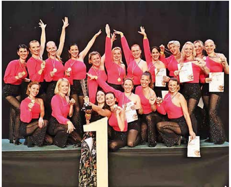
Poplačan trud plesalk iz Plesnega kluba Bit

Upravičeno so lahko ponosni na velik napredek in trud svojih plesalk, plesalcev in trenerskega sektorja. Z marljivim in vestnim treniranjem, ki ga je dandanes težko usklajevati s šolskimi obveznostmi, so mladi dokazali, da zmorejo. Skozi vse leto so se plesalci borili za uvrstitve na pokalnih turnirjih, obiskali tudi mnogo plesnih festivalov doma in v tujini, kjer so se izpopolnjevali in krepili svoje plesne tekmovalne točke. Sledi enomesečni zaslužen dopust, avgusta pa ponovno začnejo pridno trenirati, saj jih v začetku septembra že čaka evropsko prvenstvo v show danceu na Poljskem.