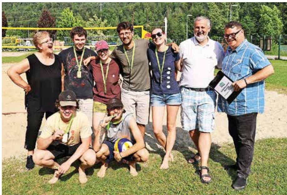
Dobro razpoloženi udeleženci srečanja, obujenega ob tridesetletnici občine