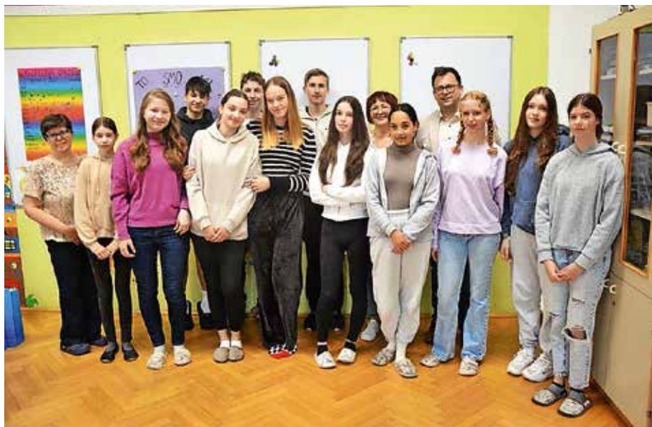
Vseh devet let odlični na Osnovni šoli Simona Jenka Smlednik