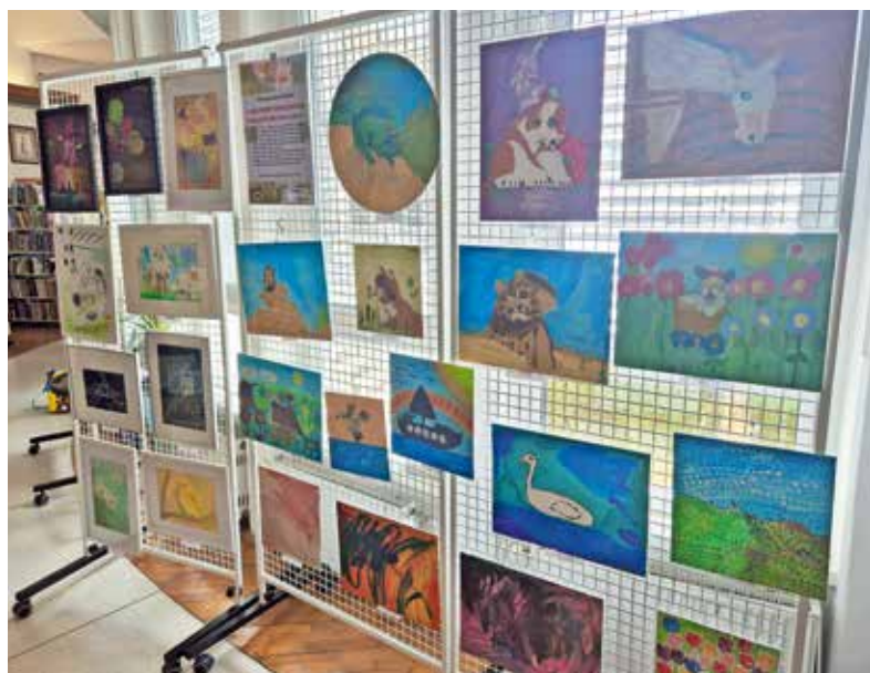
Razstava likovnih del, ki so nastala na umetniških delavnicah, se bo v knjižnici zaključila 19. julija.

V predverju knjižnice je predstavljen del ustvarjanja v sklopu projekta. Razstavo so namreč pripravili tudi v DEOS centru starejših Medvode.