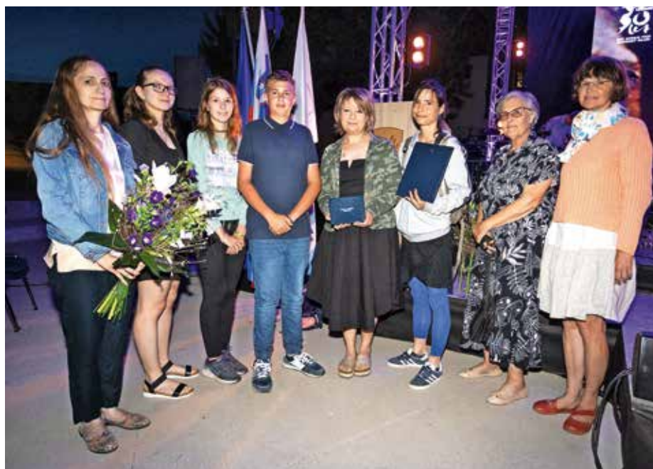
Člani Društva za varovanje okolja in pomoč živalim v stiski Reks in Mila

Člani društva že skoraj deset let z neizmerno požrtvovalnostjo, vztrajnostjo, pogumom in kljub premnogim preprekam ostajajo glas živali ter varuhi naravnega okolja in ohranjanja biotopov. Kljub majhnemu številu prostovoljcev in veliko stroškom vztrajajo, ne odnehajo. S trdim delom si ob redni službi vsak dan ob večerih po več ur na terenu prizadevajo v povezovanju in sodelovanju z različnimi vladnimi in