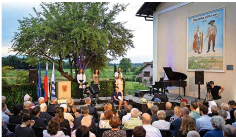
V kulturnem programu so imeli glavno besedo mladi.