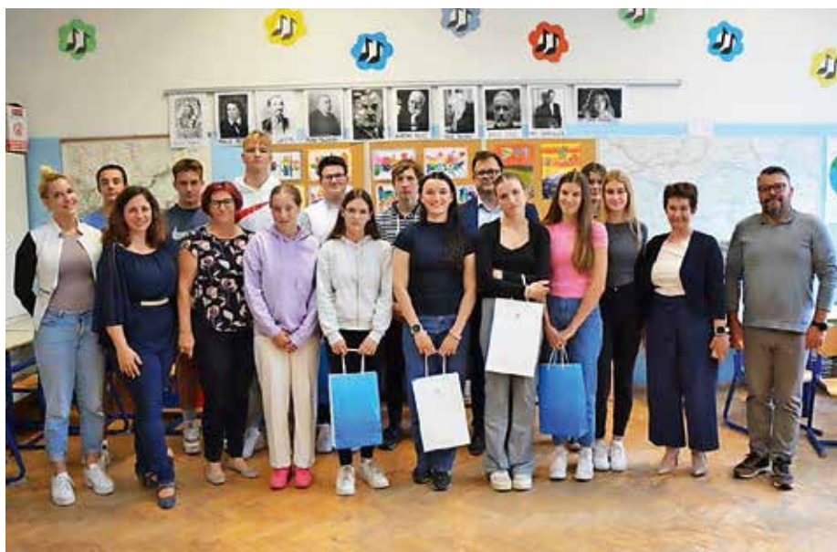
Najuspešnejši na Osnovni šoli Preska in podružnici Topol