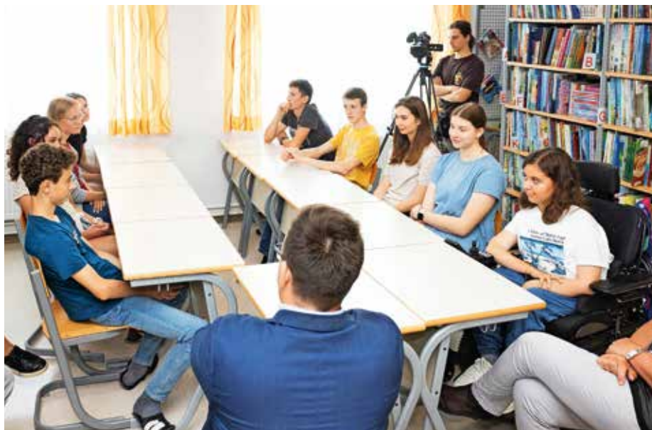
Pogovor z devetošolci na Osnovni šoli Medvode. Skupinsko fotografijo smo objavili v junijskem Sotočju.

Ob priznanjih za izjemne dosežke v času šolanja je sogovornikom izročil tudi igro spomin #medvodami, izdano ob 30-letnici občine, in brezplačne vstopnice za nekatere dogodke Poletja med vodami.