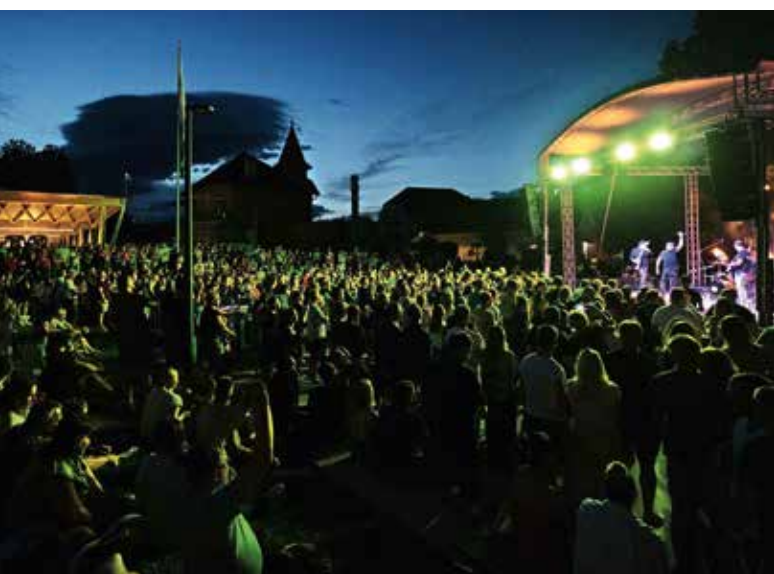
Obiskovalci koncerta glasbene skupine Miz, ki je zaokrožila praznični dan, so napolnili prireditveni prostor ob medvoški tržnici.