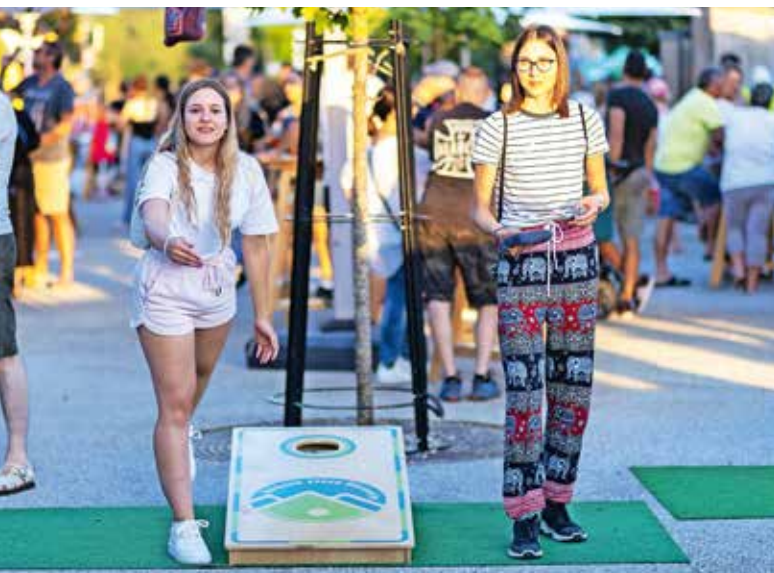
V zabavnem sobotnem popoldnevu je veliko pozornosti pritegnila igra štrbunk.