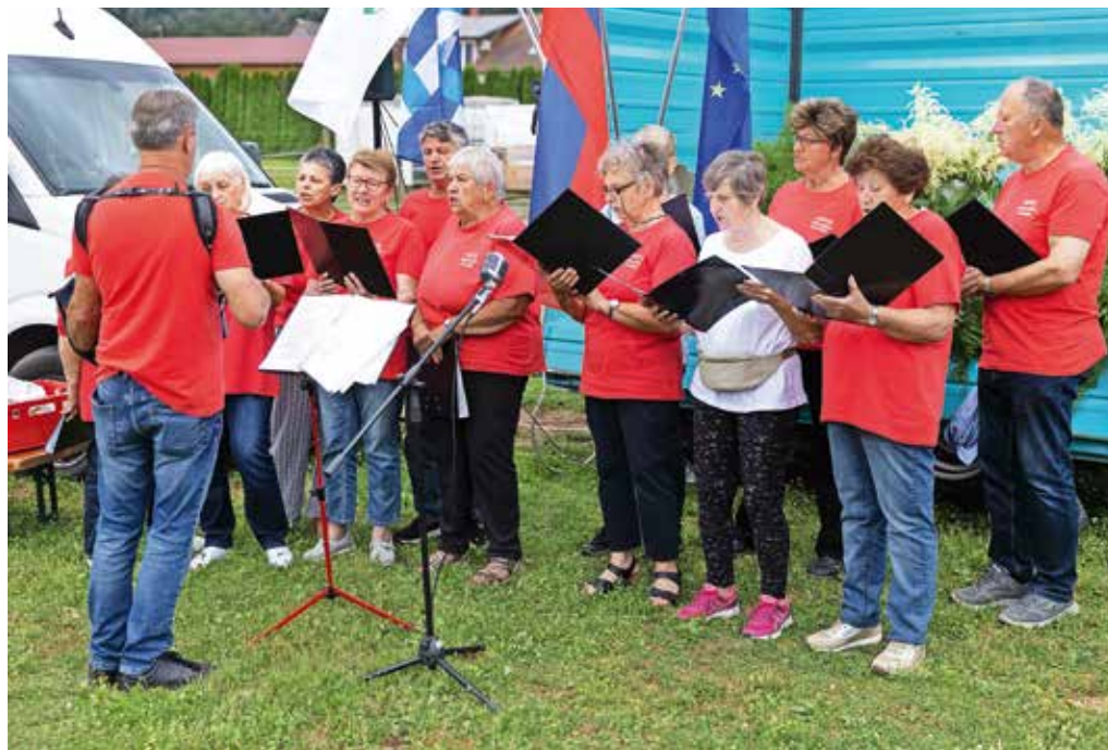
Mešani pevski zbor Smleški žarek vsako leto prepeva na kresovanju.

kolesi, ki so ju obiskovalci odpeljali proti kresu. Organizatorji Turističnega društva Hraše so ob dvajsetem kresovanju obiskovalcem pripravili pester program. Zapeli so jim pevci mešanega zbora Smleški žarek, otroci so se lahko udele-