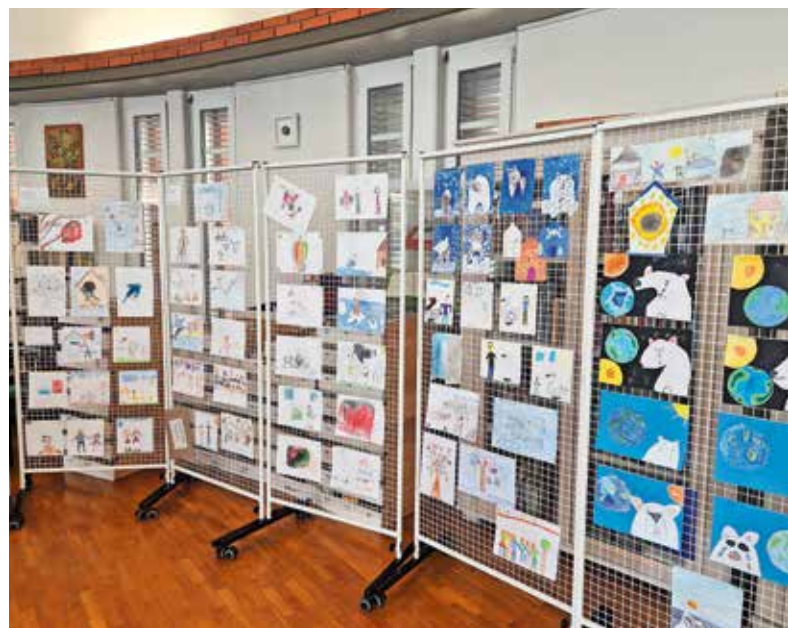
Razstava projekta Leo, leo

Svojo ustvarjalnost predstavljajo tudi uporabniki Društva Barka, stanovalci DEOS Centra starejših Medvode, učenci