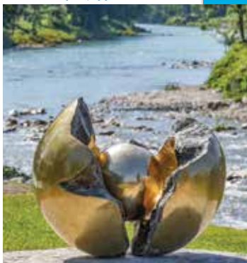
Krogla z jedrom