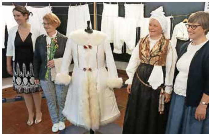
Krepitev prepoznavnosti naše oblačilne dediščine – razstava v Kranju je na ogled do 18. avgusta.