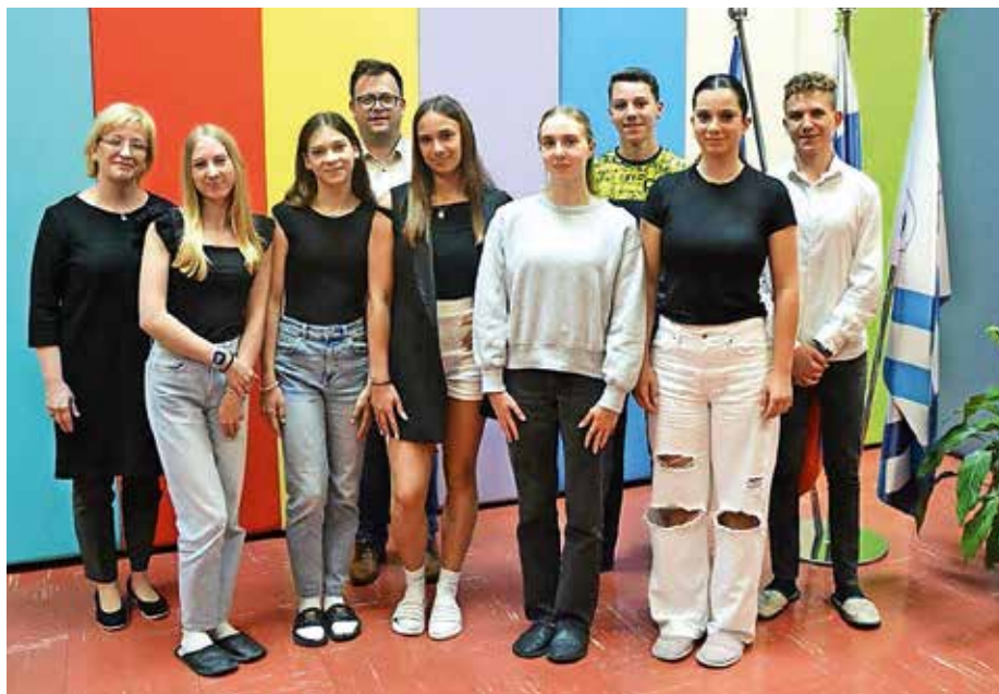
Odličnjaki na Osnovni šoli Pirniče

Poleg petic imajo najuspešnejši v svojih zbirkah tudi različna priznanja, med njimi zlata iz znanja geografije, francoščine, logike, zlato Cankarjevo priznanje, priznanje diamantni kenguru, ki ga prejmejo tisti osnovnošolci v zaključnem razredu, ki so bili vedno uspešni na tekmovanju Mednarodni matematični Kenguru.