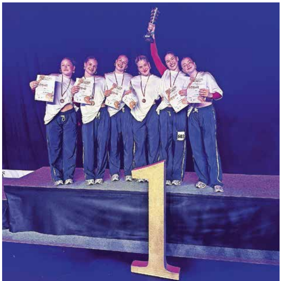
Veselje članic Plesnega kluba Impulz