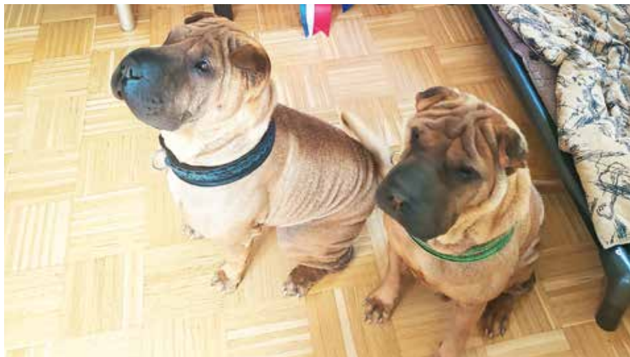
Poppy in Paya Papaya sta družinska člana Koširjevih.

Paya Papaya ima zelo nežen karakter, zato ima ves čas na voljo svoje »zavetje«, svoj boks, kjer se kadarkoli lahko »skrije«, kadar želi mir. Poppy pa se zna samozavestno in pogumno postaviti, sledi vsem navodilom, tudi na odrih za ocenjevanje, kjer mora v nekaj minutah pokazati vso svojo pasjo lepoto. Oba sta izjemno prijazna, družabna, igriva, radovedno spremljata dogajanje naokoli, izvemo. Ves dan sta izpuščena, imata dostop v hišo ali na prostorno dvorišče, seveda ograjeno z ograjo. Rada ležita ob vrtni mizi, vsak na svoji dvignjeni »postelji«. Lastnikoma sledita več ali manj ves čas, zadržujeta se z njima v notranjosti hiše ali pa zunaj. Spita v dnevni sobi. Tudi na krajših izletih ali letovanjih skrbnika poskrbita, da je kužkoma udobno. Izbirajo kraje, kjer je psom prijazno okolje. V Italiji na primer psi skupaj z lastniki obiskujejo trgovine, bistroje in so povsod dobrodošli; povsod so pripravljene posodice z vodo, sta pojasnila. Poppy je do zdaj dvakrat postal očka. Nje-