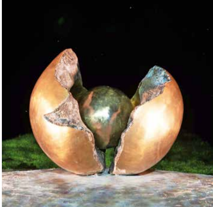
Krogla z jedrom v večernem soju luči