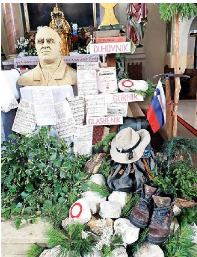
Osnutek kipa Jakoba Aljaža, ki ga naslednje leto nameravajo postaviti pred župnišče v Smledniku