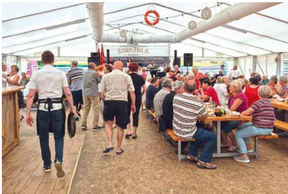
Glasba je vabila na plesišče.