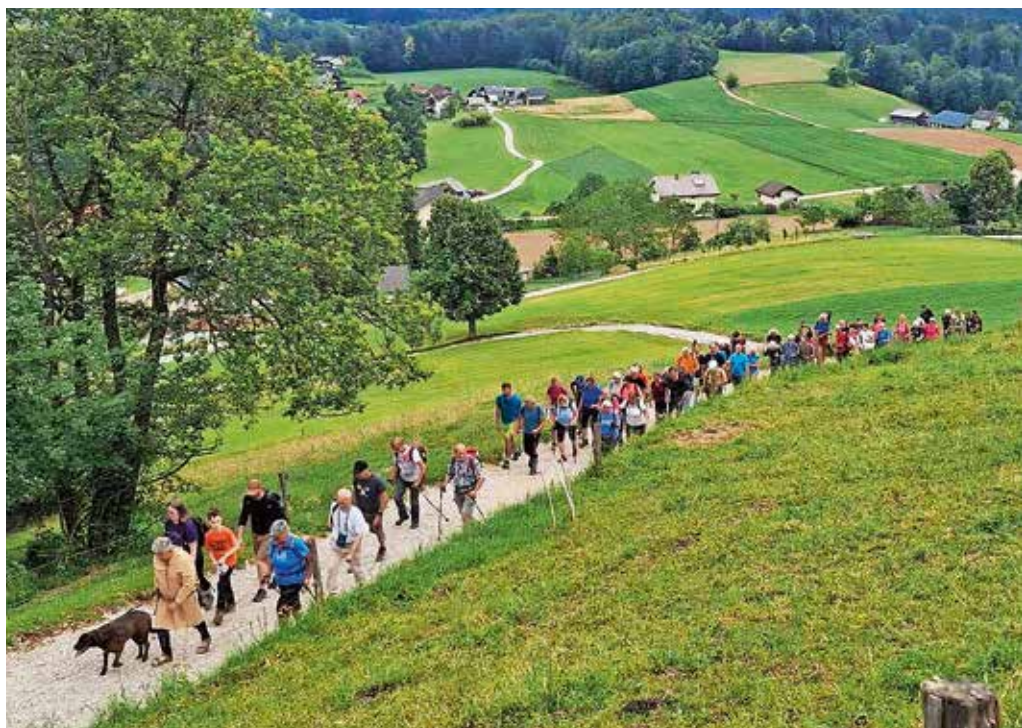
Pohod po poteh roparskih vitezov / Foto: Turistično društvo Žlebe - Marjeta

Pot je primerna za vse starostne skupine; če jo boste začeli pri šoli, boste prehodili 11 kilometrov, od Galerije pod kozolcem pa je dolga pet kilometrov, še pojasni predsednica društva. »Podroben opis bo morda komu, ki ga zanima pot, koristil ali ga spodbudil k temu, da jo obiše,« doda. Skupinski pohod je kljub sivim oblakom in dežnim kapljam opravilo več kot 120 pohodnikov, ki so jih tudi tokrat na cilju pričakale obložene mize. »Pohod po poteh roparskih vitezov je športna, kulturno-zgodovinska in turistična prireditev. Pohodnikom se ob koncu prileže kranjska klobasa s krompirjevo solato, pijačo in domačimi sladicami, za kar vedno poskrbi Turistično društvo Žlebe - Marjeta. Še po-