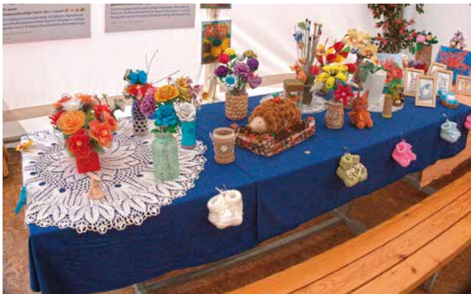
Del razstave ročnih del