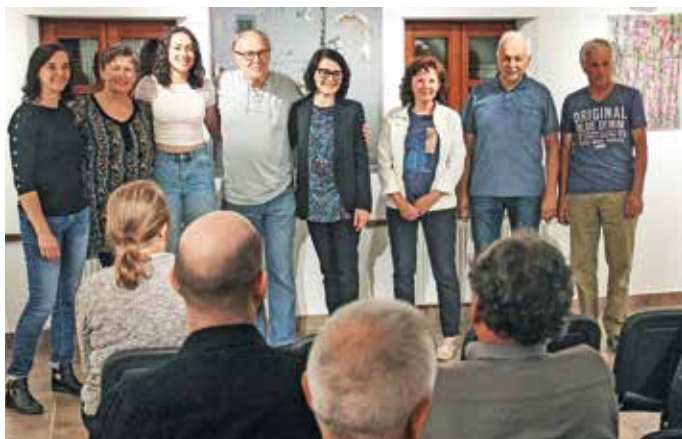
Ekstempore na Aljaževino vedno privabi likovne ustvarjalce vseh generacij.