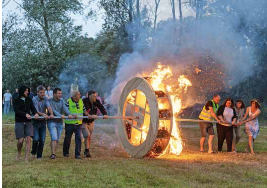
Na kresovanju v Hrašah so letos prvič prižgali tudi Krésnikovo kolo.

ki predstavlja žensko energijo, ogenj pa predstavlja moško. Ko moški in ženska hodita ob kolesu, se med njima porajajo različna čustva, ki jih ogenj požge in tako pomaga, da se med seboj uglasita,« pravi Prosen. V Hrašah so prižgali dve