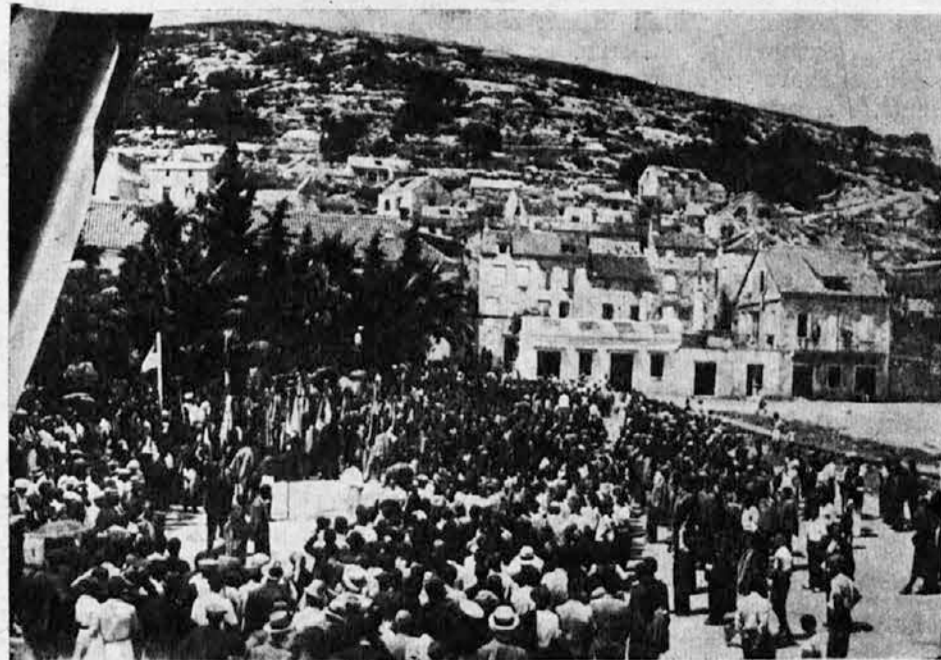
4.000 ljudi prisustvovalo je razvijanju nove zastave Sokolskog društva Vis