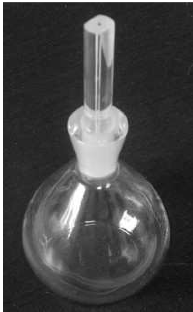
SLIKA 2. Piknometar

voda se v obliki »prstov« spušča navzdol skozi mrzlo sladko vodo. Da je slana voda gostejša od sladke vode, pri tem pojavu prevlada nad razlikami zaradi temperature. S tem pa nenavadnosti še ni konec. Ker je izguba toplote z difuzijo hitrejša od difuzije soli v okolico, se slana voda hitro hladi, postaja vse gostejša in se še naprej spušča. Sladka voda, ki je bila v začetku hladna, pa dobiva toploto od slane, zato se greje in temperaturno razteza – pri tem pa dobiva le malo soli (kar bi ji povečevalo gostoto) in