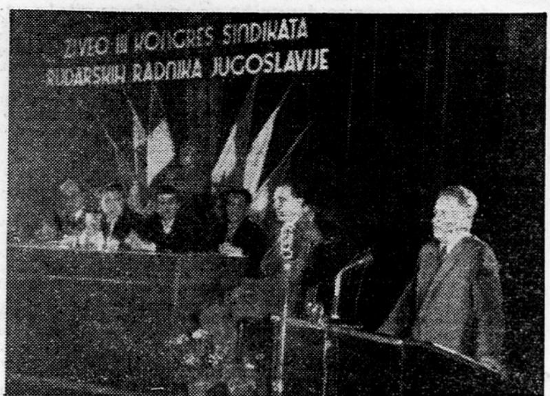
Tov. Miha Marinko govori delegatom na III. kongresu rudarjev Jugoslavije

»PRISLUHnite NASI BESEDI« v Domu sindikatov, Miklošičeva cesta št. 22, na Delavskem odru 30. aprila ob 16. uri. Vstop prost.