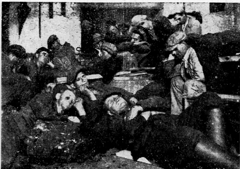
Meseca junija 1934 je Trboveljska premogokopna družba napovedala znižanje rudarskih mezd na 6%, ukinitev deputatnega premoga in nove redukcije delavcev v vseh obratih. Ker vsa posredovanja in protesti niso pomagali, so se konec meseca v Trboveljah in Hrastniku začele gladovalne stavke rudarjev v rovin in rudni separacijah. Kjer je kdo delal, tam je ostal brez hrane, in vozilke, s katerimi so jim družine pošiljale nekaj hrane, so rudarji iz jam pošiljali nazaj s sporilom, da bodo vztrajali, dokler družba ne preklicuje svoje napovedi. Šele po 4 dneh se je to zgodilo. (Na sliki stavekajoči v obratu Dobrni.)

ali močnik ter koruzni kruh. Dvakrat na dan skozi vso zimo in še nekaj mesecev potem, ko odrasli že niso več prejemali hrane v brezposelnih kuhinjah, pa so bile tudi vse trboveljske ulice in ceste polne vresčevih otrok, od katerih vsak je nosil s seboj — žlico. Spmalad prihaja v deželo. Vse naokrog brsti novo življenje, ki bi se ga človek radoval, če bi bilo kaj — jesti. Pred občino je zopet vse črno ljudi in vršič, da gre skozi usesa. To pot demonstrirajo ženske. Več kot dva tisoč jih je. »Zahtevamo dela za naše moške!« odmeva od sosednih hribov. »Lastniki rudnikov naj znižajo svoje profite, pa bo za vse dovolj kruha!« Dol s kapitalistile!