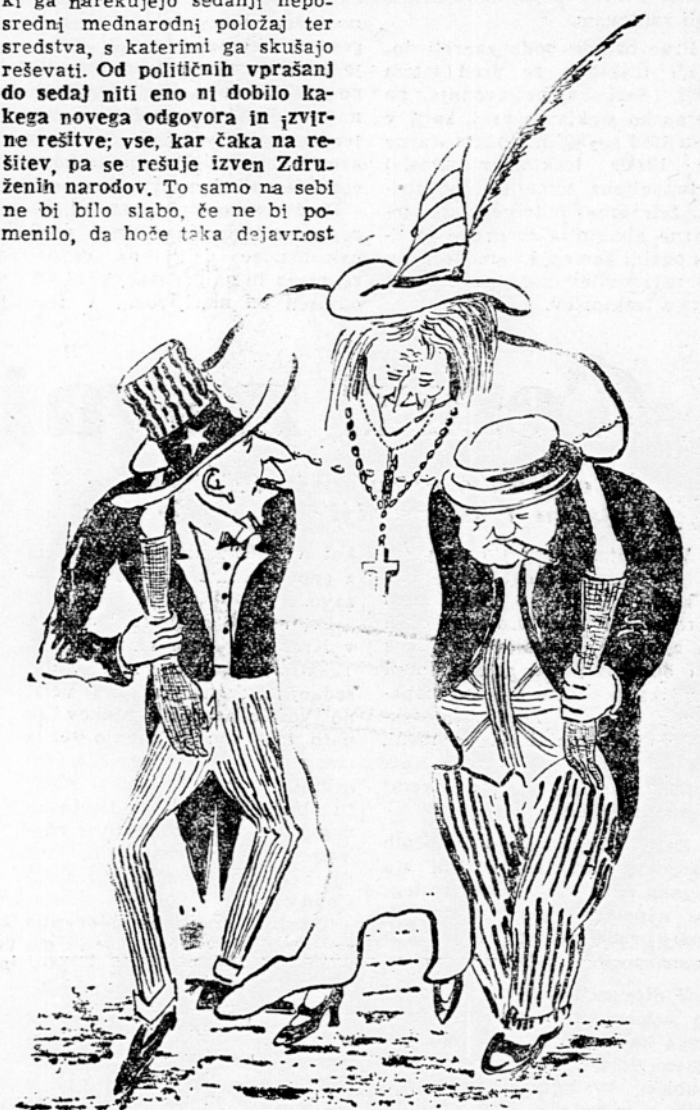
Stara dama in njuna kavalirja

šeno, da se je izraelska vlada že večkrat pritoževala zaradi izredov ob meji in kršitev premirja ter zahtevala jamstva, da se kršitev premirja ne bi več ponavljala. V poročilu je navedeno, da je bilo letni 60, letos pa 40 izraelskih smrtnih žrtev pri obmejnih izredih. Povzročila je bila tudi velika gmotna škoda. Izraelsko poročilo ne zanika, da so v nekaterih primerih tudi izraelski prebivalci kršili premirje, a to se je največkrat zgodilo v samoohrambi in pa zato, ker so bili izzvani. Komisija za nadzorovanje premirja je sama dovolila, da je bilo obmejnemu prebivalstvu Jordanije in Izraela dodeljena nekaj orožja. Od junija 1952 je komisija za premirje v 25 primerih obmejnih izredov ugotovila krivdo Izraela, v 134 primerih pa krivdo in odgovornost Jordanije.