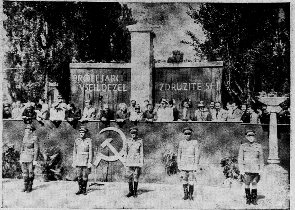
Tribuna na Prešernovi cesti s člani vlade LRS in gosti ob vojaški paradi v Ljubljani

Ali je vse to naša oprema? so spraševali navdušeni ljudje na pločnikih.