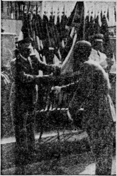
Maršal Tito izročila nove polkovne in brigadne zastave