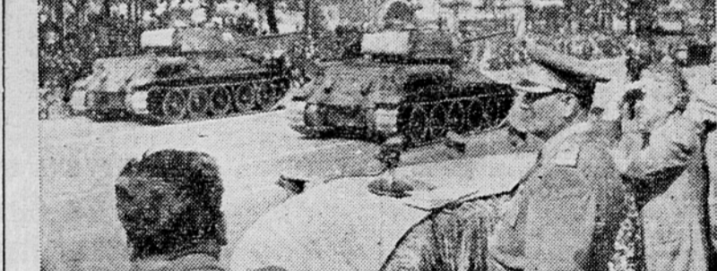
Maršal Tito na vojaški paradi 1. maja v Beogradu

učinek modernih vojnih sredstev zdaj tako strasen, da bi lahko svet uničila. Mislim, da lahko samo bedaki v tem trenutku sanjarijo o novih vojnih in novih osvabljenjih. Mi pa moramo vzlic temu biti budni, zmeraj pripravljani. Čim močnejši bomo, čim bolj