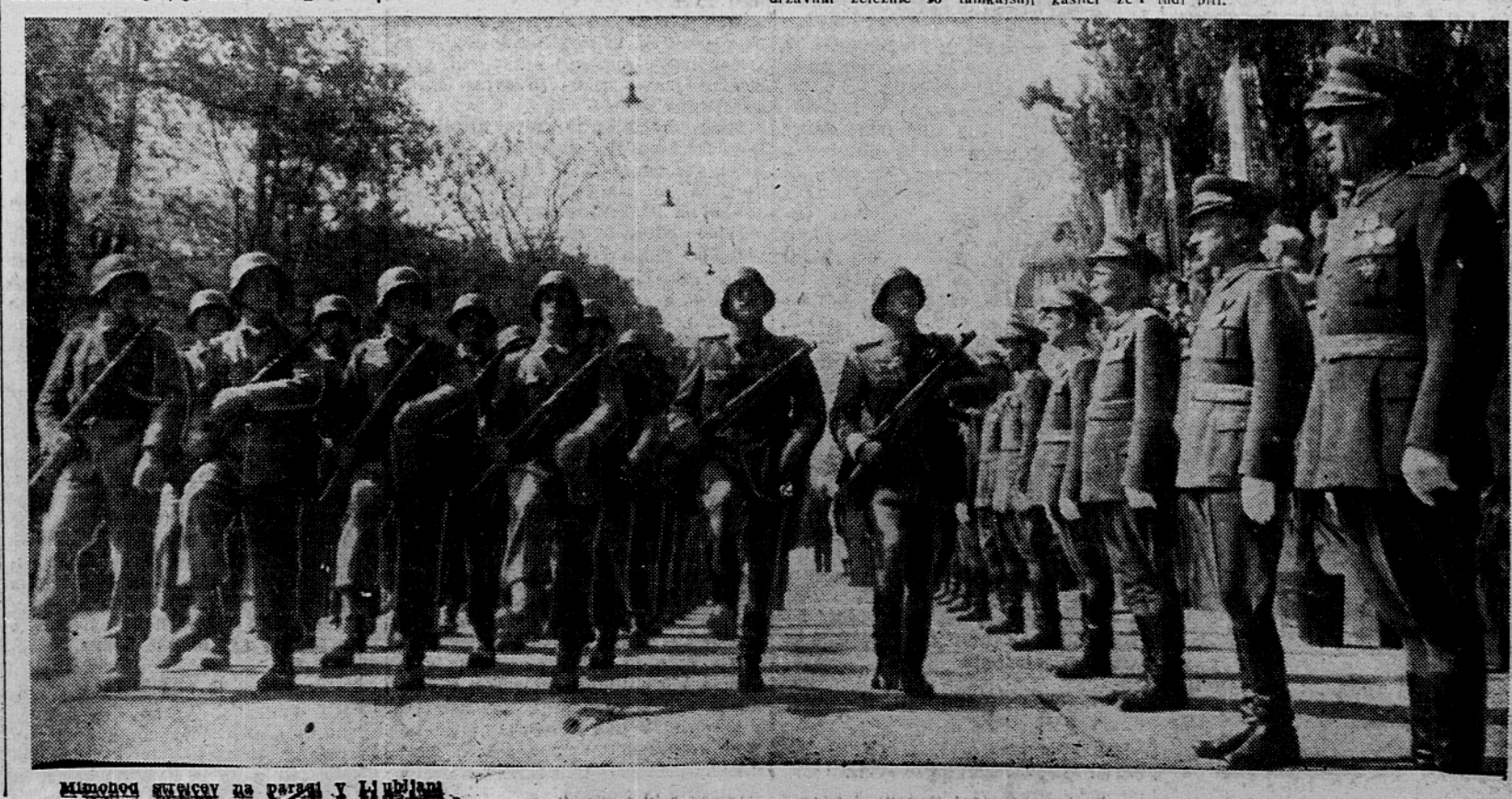
Mimovodni korakovi na paradi v Ljubljani

oborožen in čim sposobnejši, čim bolj bo naša vojska sposobna in tehnično oborožena, vse naše ljudstvo pa pripravljeno braniti svojo neodvisnost, tem manjša bo za nas nevarnost. Prav ta enotnost, ki smo jo skovali v veliki osvobodilni vojni, je bila eden glavnih