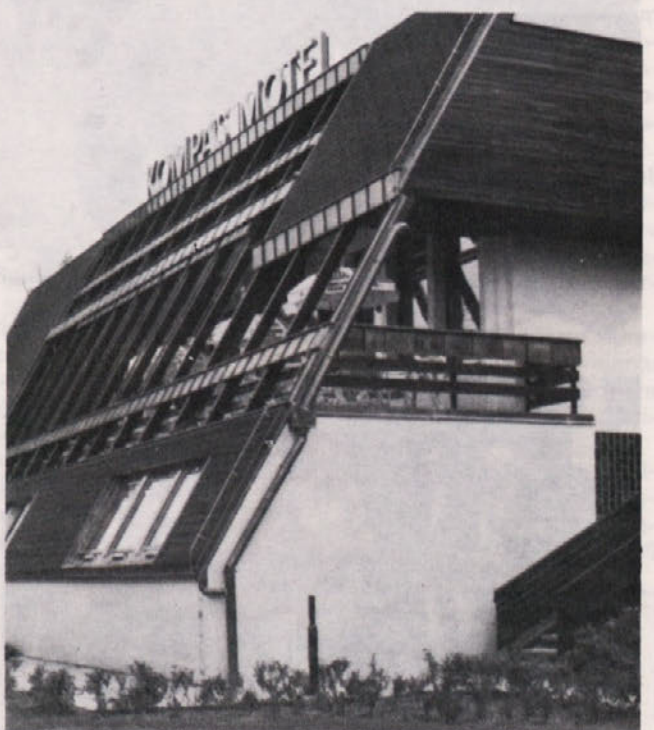
Prenovljen in dograjen hotel Kompas v Mednem. Gradil TOZD GO Ljubljana.