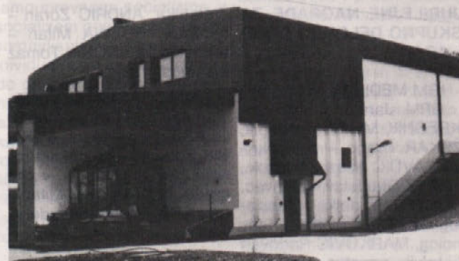
Dokončana predelovalnica grozdja Imeno. Objekt je gradila TOZD GO Rog. Slatina.