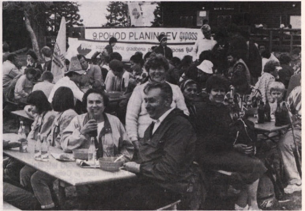
Po naporni hoji se je okrepčilo kar prileglo.