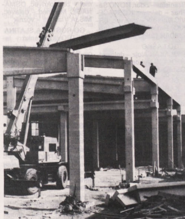
Objekt v sklopu Cinkarne – gradi TOZD GO Celje.