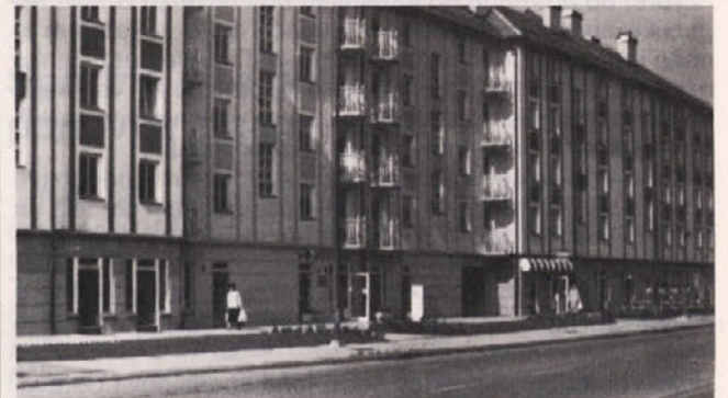
Poslovno stanovanjski blok, Levstikova ulica - Celje. Objekt je gradil TOZD GO Celje.