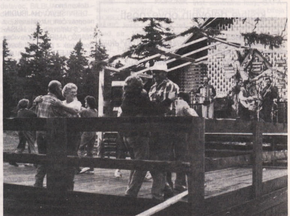
Zabavali smo se tudi ob plesu.