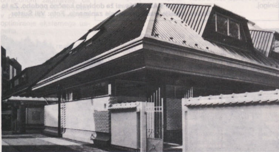
Trgovsko poslovni center Mercator v Ljubljani