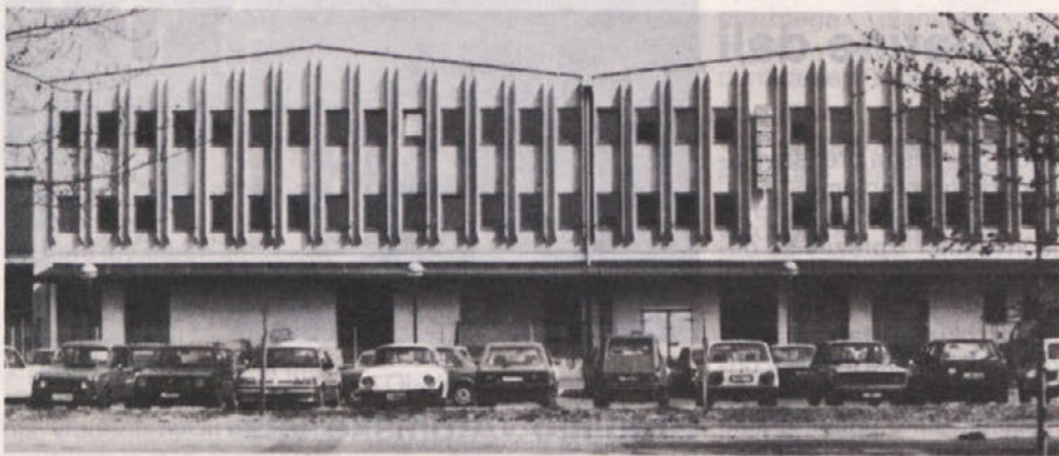
Štirietažni objekt v montažnem sistemu Ingrad za Salus v Ljubljani

Iz TOZD Gradbena operativa Ljubljana vam predstavljamo naslednje objekte: