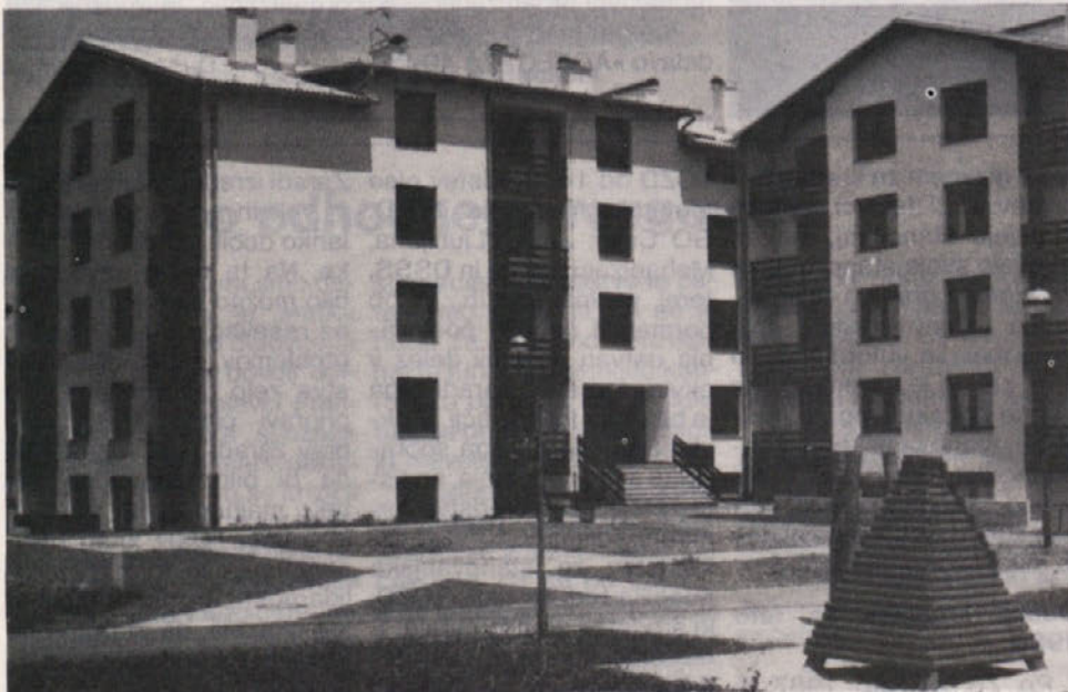
Stanovanjski bloki na Igu pri Ljubljani. Objekt TOZD GO Ljubljana.

Ob tej priliki obveščamo člane kolektiva, da imajo možnost izposojanja knjig v strokovni knjižnici vsak delovni dan, od 7.-9. ure pri tov. Makarič Stanki. Za morebitna naročila strokovne literature se je potrebno predhodno posvetovati in dobiti pismeno potrditev direktorja TOZD oz. sektorja v DSSS, nato pa naročila sprejme oddelek za izobraževanje.