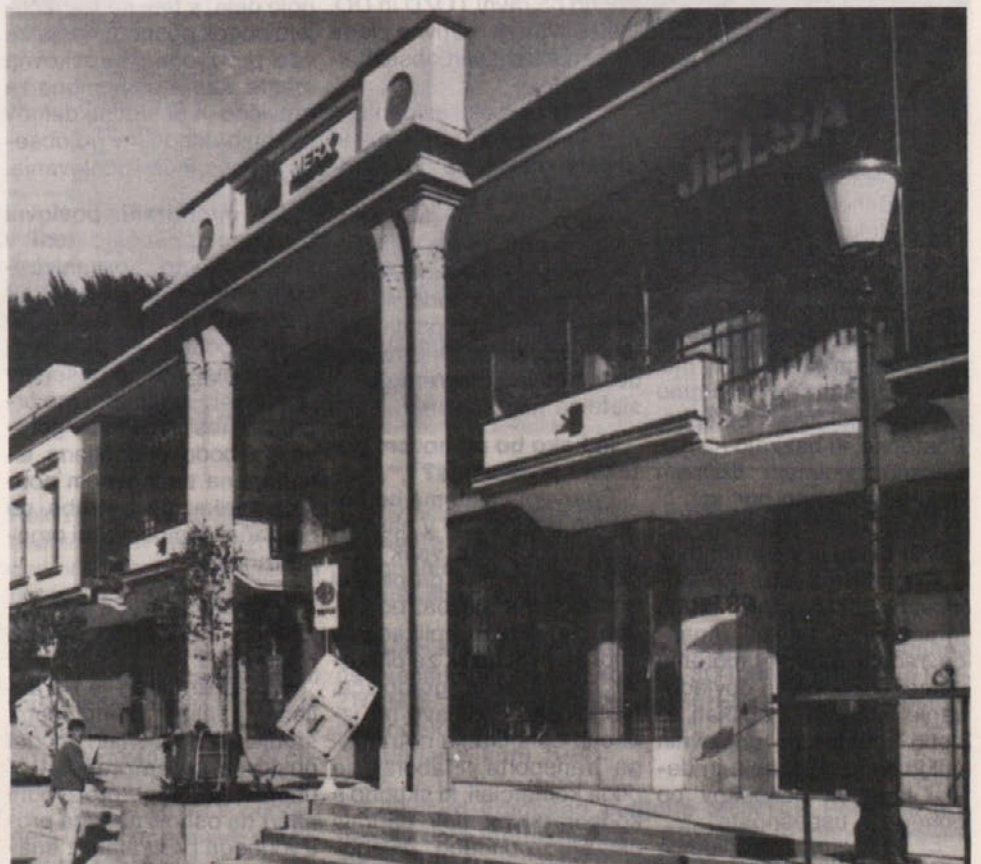
Dokončan poslovno trgovski center v Rogoški Slatini.

Vsem bralcem našega Glasila čestitamo za 29. november! Uredništvo