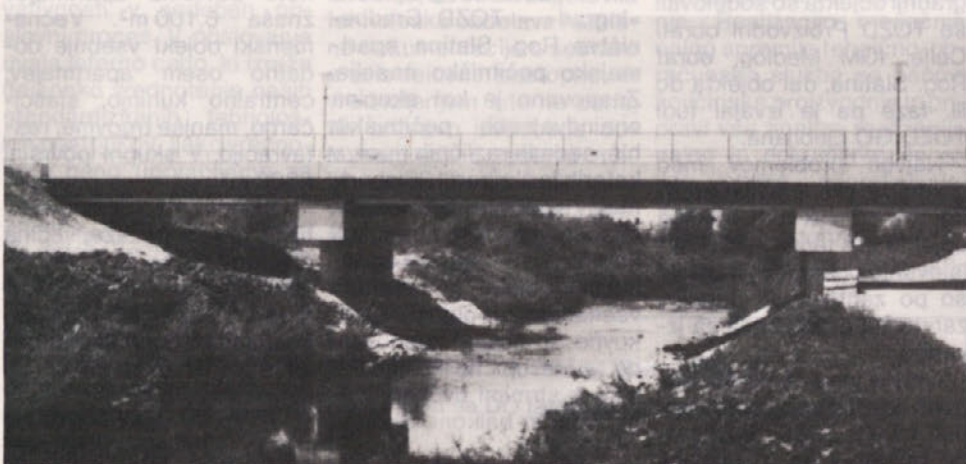
Montažni most čez Mali greben v Ljubljani