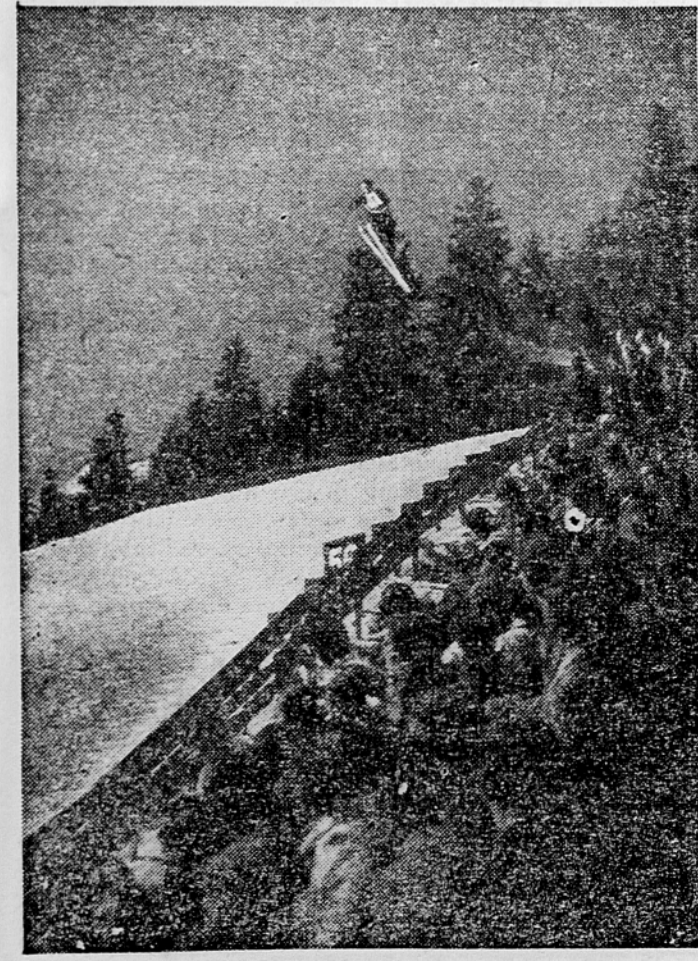
Na 80 metriški skakalnici v Planici so bile večeraj zaključene letošnje skakalne tekme (Glej poročilo na 4. strani)

St. Moritz, 8. marca. Malokdo je pričakoval, da bo na mednarodnem študentskem prvenstvu v smučanju zasedel pr-