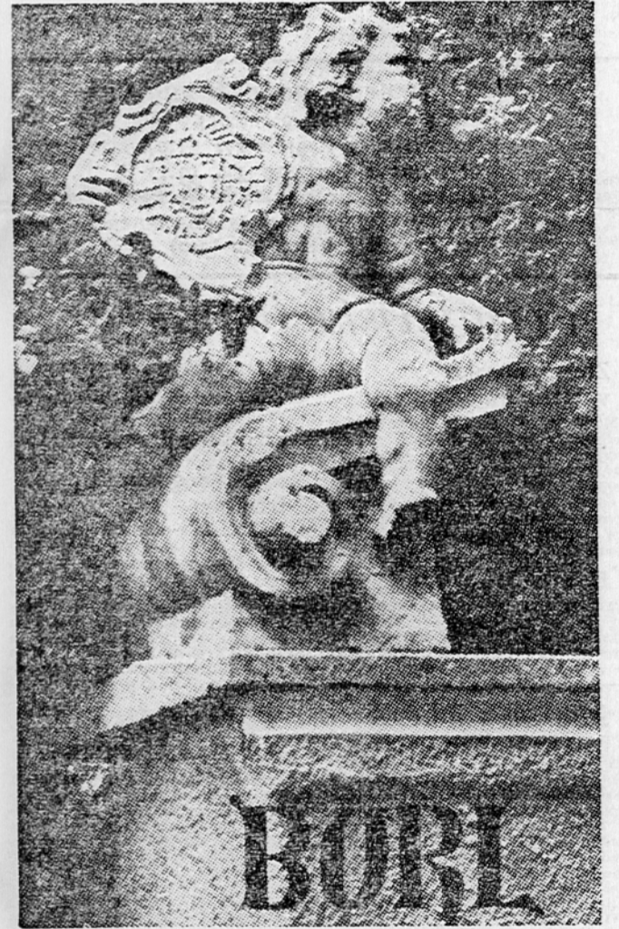
Naslovnica stran propagandne brosure za letovišče Borl nad Dravo (ob cesti Ptui-Zavrč): amorček — detajl z borlskega gradu

do, plenijo češnje ali pobirajo komaj posejano seme. Toda to je malenkost v primeri z njihovo koristnostjo. Toda čeprav uničuje žuželke dobro petino vsega poljskega pridelka, ne smemo pozabiti, da je pridelek močno odvisen prav od sodelovanja žuželk. Brez tega sodelovanja ne bi bilo bombaža, naše najvažnejše tekstilne surovine ne bi bilo naravne svile brez svileprejke. Ko so v Nov. Zelandiji začeli rediti ovce in so za njihovo krmo posejali rdečo deteljo, se je ta zaplodila šele, ko so iz Evrope prenesli čmrlje. Samica molja zneslo povprečno 100 jajčec in pri štirih rodovih znaša v enem letu potomstvo ene samice fantastično število 470.000 moljev. 470.000 moljevih ličink požre 46,5 kg volne. Točko volne, iz katere so volna in dlaka sestavljeni. Bilo je treba torej najti način, da napravijo to roževino neuzitno. Po dolgoletnih poskusih in najožjem sodelovanju med zoologi in kemiki, tekstilniki in barvarskimi strokovnjaki je to tudi uspelo. Leta 1928 so volno pripravili z »Eulanom«. Dve leti pozneje so to sredstvo izpopolnili tako, da so tkanino že v tovarni imulzirali proti moljem. Zdej je tako obdelana volnena tkanina varna pred molji. Boj proti škodljivim žuželkam se nadaljuje. Uspeh v tem boju so vidni, vendar bo treba še mnogo truda do popolne zmage nad njimi, če je to sploh možno.