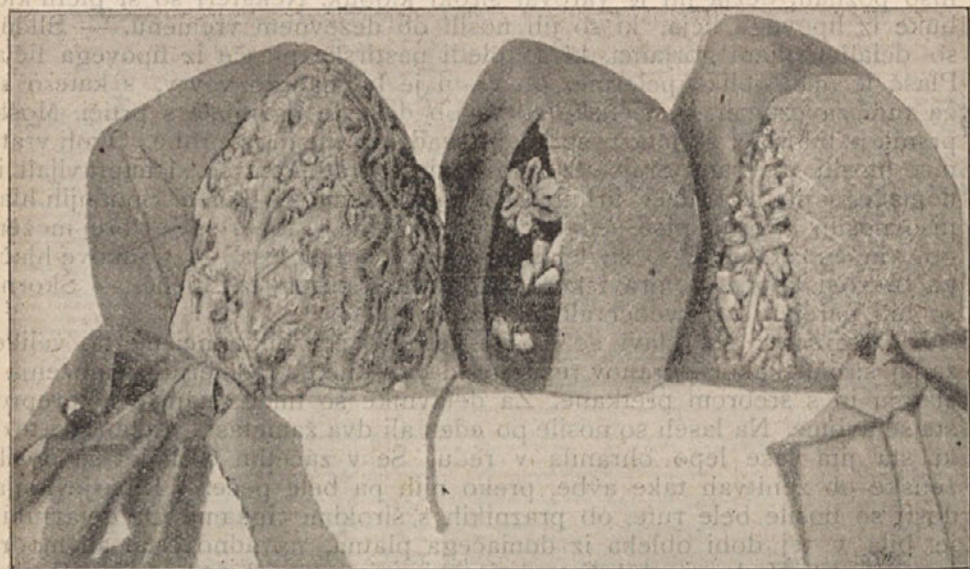
Koroške avbe. Srednja in desna s četveročrtnim »zadnjekom«.

Prsnik je bil pozimi žametast, navadno zelo pisan ali pa črn. Ubožnejši so nosili manchester (mašester). Pozimi so nosili možje kožuhe. Poleti pa so imeli bele prsnike iz piquéta (pikeja). Na obeh straneh so bile luknjice za gumbе, prav gosto druga pri drugi. Gumbi pa so bili našiti na močni vrvici, navadno so bili iz pakfonga, včasih srebrni, pa tudi svinčasti ter so jih lahko devali na druge prsnike. Na koncu tiste vrvice pa je bil prišit škrlatast trak, precej širok, kakor volovski jezik, ves raz-