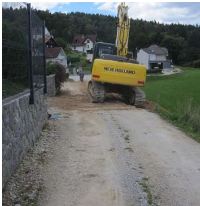
V kraju Vrhpolje je rekonstruirano 100 m ceste, ki bo dobila tudi asfaltno prevleko.