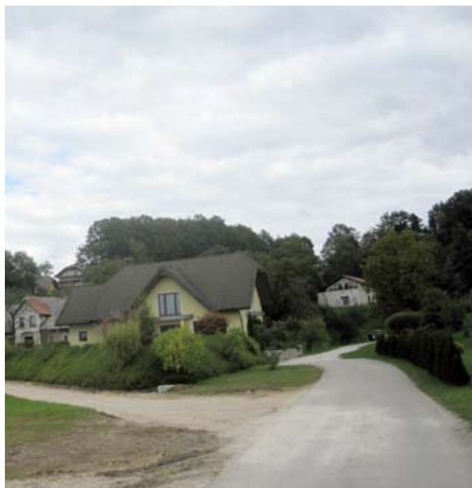
V Drtiji se je že utrjeno cestišče nivojsko prilagodilo, sledi asfaltna prevleka.