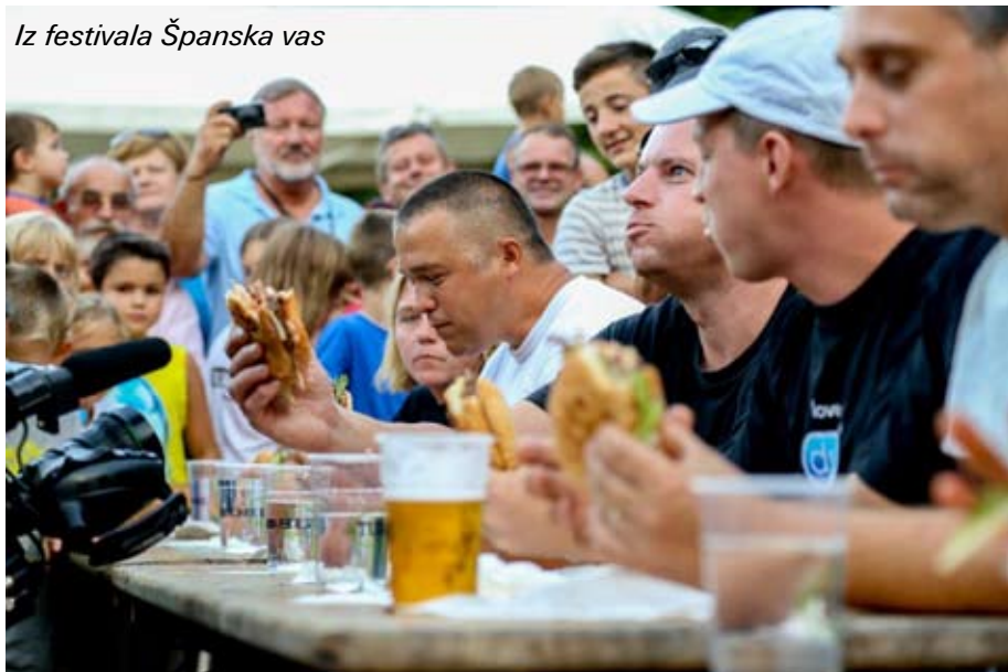
Iz festivala Španska vas

Organiziranje se nisem lotil zaradi denarja. Vedno me k novim idejam vleče adrenalin, da lahko uresničim idejo, spoznavanje novih ljudi in seveda na koncu želja po uspehu. Rad se obdam s pozitivnimi ljudmi, ki jih srečam na poteh novih idej, z ljudmi ki imajo enaka načela kot jaz, a imajo druga potrebna znanja, saj smo seveda skupaj boljši in močnejši. Vsekakor pa je najvažneje, da verjameš v idejo in vase. Tudi za trenutek ne smeš pomisliti v neuspeh. Odmisliti moraš vse negativne misli, besede in tudi negativne ljudi okoli sebe, narediti plan dela. Potem pa z vso močjo naprej.