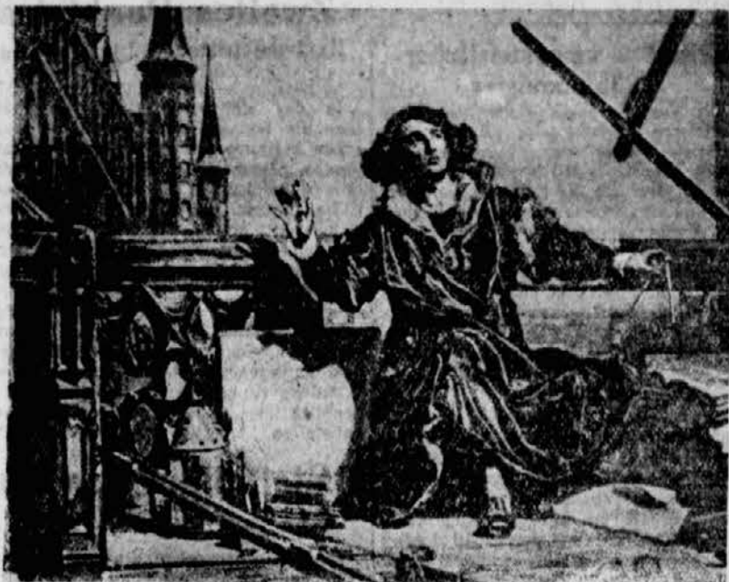
Kopernikus auf der Sternwarte in Frauenburg (Gemälde von Matejko)

schöllichen Onkels und als dessen Gehilfe bei seinen politischen und verwaltungsmäßigen Aufgaben auf Schloß Heilsberg. Danach war er ab 1511 in zahlreichen domherrlichen Ämtern tätig, u. a. insgesamt sieben Jahre als Kanzler des Kapitels in Frauenburg und vier Jahre in dem wichtigsten, einem Frauenburger Domherren zufallenden Amte, dem des