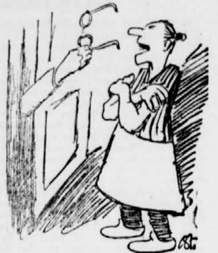
(Gest. v. Sturzkopf)

Red' nicht karferti! Nimm auch Du die Brille und suche Deine Spende zur „Spinnstoff- und Schuh-sammlung 1943“ heraus!