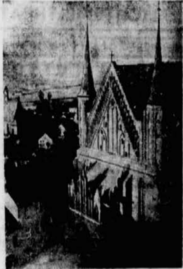
Westgebiet des Doms zu Frauenburg, wo Kopernikus sein Lebenswerk schrieb

Die Eindeutigkeit des deutschen Stammbaumes wird aber bei Kopernikus vor allem auch durch die Art seines Wesens bestätigt. Die Gründlichkeit, mit der er sein Werk schuf, die Verbundenheit genialer innerer Schau mit nüchterner kritischer Vernunft sind so durchaus deutscher Prägung, daß schon dadurch alle gegenteiligen Behauptungen lächerlich erscheinen. Zum Überfluß ist nachgewiesen, daß Kopernikus sich nicht nur nie schriftlich der polnischen Sprache bedient — alle seine Werke sind entweder deutsch oder lateinisch geschrieben — sondern daß er auch nie ein Wort polnisch gesprochen hat.