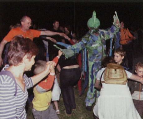
Tudi povodni mož se je pomehkužil.