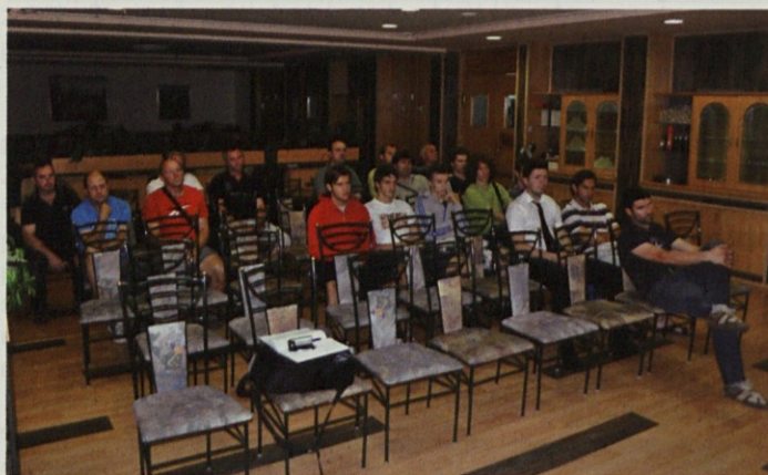
Nekateri govorijo o dveh ali celo treh taborih v šentjurskem nogometu