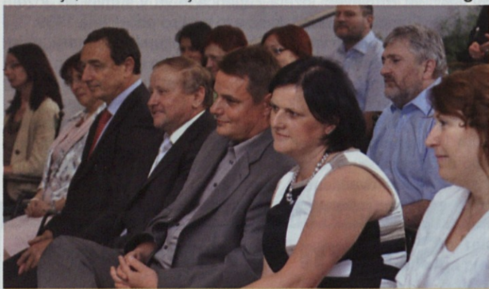
Med povabljeni je bilo nekaj uglednih gostov