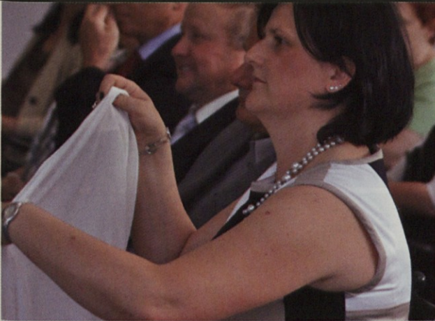
Vse dam za Ljudsko univerzo!