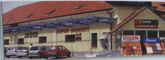
Supermarket Jager Šentjur, Cesta Leona Dobrotniška 22, 3230 Šentjur, tel.: 03/747-23-50