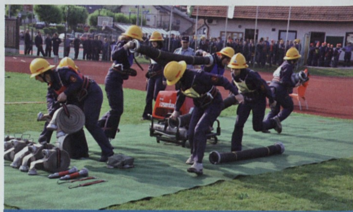
Vaja z motorno brizgalno je bila zelo realistična

V nedeljo so se med seboj pomerile še člani in članice. Borba med lokalnimi gasilskimi ekipami je bila veliko bolj resna, saj je šlo tudi za prestiž, kdo je najboljši v občini. Člani A ekip, ki jih je bilo kar 17 in v vsaki je bilo po devet tekmovalcev, so se