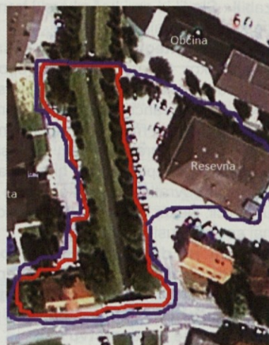
Predlog trase mestnega šprinta