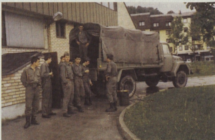
Edina fotografija predaje orožja TO

Termin za predajo orožja je bil seveda dobro izbran. 16. maja je bila v slovenski Skupščini ustoličena Peterletova Demosova vlada,