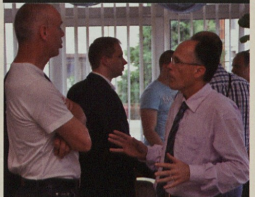
Zdene, kaj nisem rojen poslanec?