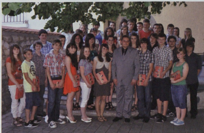
Vseh devetošolcev je bilo 170