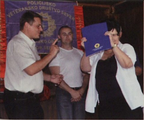
Če si res osamosvojiteljica ...