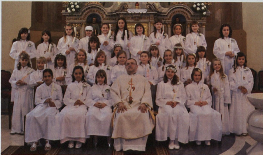
Iz zakramenta evharistije na nek način izvirajo vsi ostali zakramenti, saj je v zakramentu evharistije navzoč sam Jezus Kristus. V ostalih zakramentih pa se nas posredno dotika preko različnih stvarnih elementov (voda, olje, odveza). Zakrament evharistije ima veliko imen (Evharistija, Gospodova večerja, Lomljenje kruha, Spomin, Sveta daritev, Obhajilo, Sveta maša ...) in veliko pomenov.