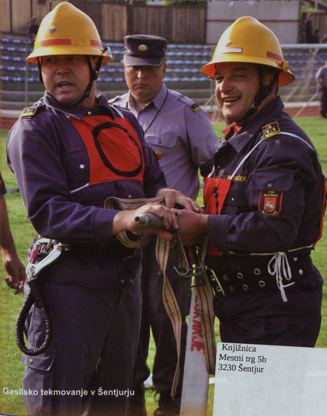
Gasilsko tekmovanje v Šentjurju