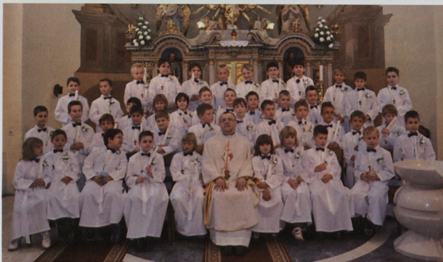
Pred prejemanjem zakramenta so se otroci soočili s prvo sveto spovedjo in tako pripravili svoja srca na prejem največjega zakramenta sv.evharistije.