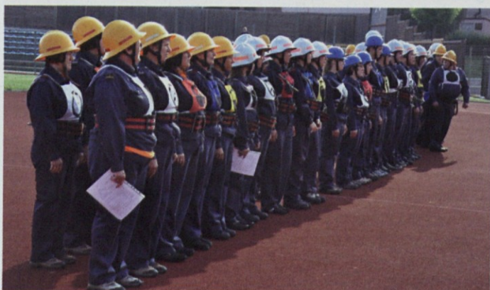
Pred tekmovanjem so se gasilci postrojili

Mladinke in mladinci so se pomerili v vaji z ovirami ter podobno kot pionirji še v štafeti in vaji razvrščanja. Konkurenca med gasilci mladinci je bila precejšnja, saj se je med seboj pomerilo kar 11 ekip. Prestižno prvo mesto so osvojili mladinci iz Dramelj z