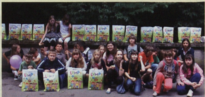
Regijski zmagovalni razred v Ljubljani na zaključni prireditvi

V Šentjurju je 24. 5. v okviru vseslovenske akcije tekmovanj za čiste zobe pod okriljem ekipe FerDenta po dveh letih ponovno potekala zaključna prireditev, 28. po vrsti. Najboljšim razredom iz šentjurske in dobjsanske občine so podelili nagrade in priznanja. V akciji so sodelovali učenci od 2. do 5. razreda iz 11 osnovnih šol. Prehodni pokal je letos osvojil 5. b razred OŠ Hruševca Šentjur in tako postal tudi regijski zmagovalni razred. Ta zmaga jim je omogočila udeležbo na zaključni prireditvi regijskih zmagovalnih razredov celotne Slovenije, ki je bila v Ljubljani.