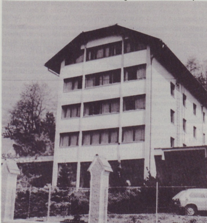
Dom učencev in del obnovljene škarpe z ograjo ob cesti Šentjur–Rogaška Slatina

Drugi, tretji in četrti fazi programa obnove naj bi sledila popravila in adaptacija obstoječih stavb, izgradnja telovadnice in po zakonu predpisanega zaklonišča. Za naslednje faze so bili izdelani glavni projekti in izdano lokacijsko dovoljenje, niso pa bila zagotovljena finančna sredstva. Sklenili so, da bo gradbeni odbor nadaljeval