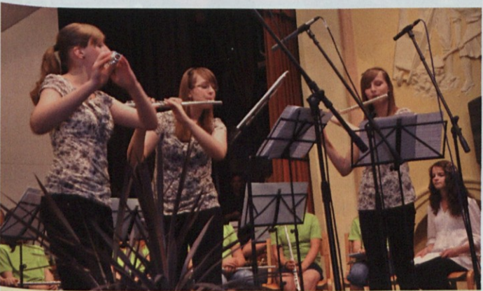
Trio flavt pobira visoka priznanja na tekmovanjih