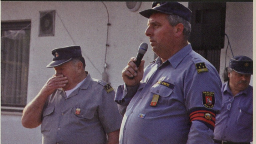
Bo menda res bolje, da bom drugič jaz govoril.