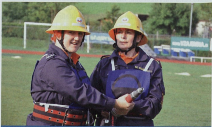
Konec vaje z motorno brizgalno

pomerili v vaji z motorno brizgalno, v štafeti na 400 metrov in vaji razvrščanja. Najuspešnejši so bili gasilci iz Loke pri Žusmu, ki so osvojili 387,37 točke, pred kolegi s Ponikve in Šentjurja 1. Prav tako so se člani pomerili še v B članski kategoriji, kjer so največ hitrosti in znanja prikazali gasilci iz Dramelj s 388,82 točke, pred Slivničani in Planinčani.