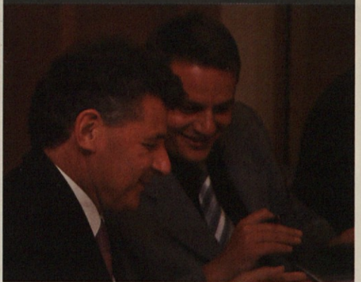
Po dveh letih je sladko kot prvič.