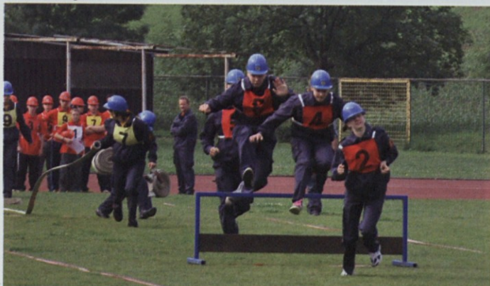
Mladi gasilci so morali pokazati tudi atletske sposobnosti

Pionirji in pionirke so se med seboj pomerili v treh disciplinah – v vaji z vedrovko, v štafeti na 400 metrov z ovirami in v vaji razvrščanja. Vsaka ekipa je štela devet tekmovalcev. Izmed osmih prijavljenih ekip pionirjev je zmagala ekipa Dolge Gore, ki je osvojila 1.024,34 točke, pred drugo ekipo s Kalobja in tretjo iz Loke pri Žusmu. V konkurenci pionirk so se najbolje odrezale mlade gasilke iz Dobja s 1.035,82 točke pred gasilkami iz Dramelj in Prevorja.