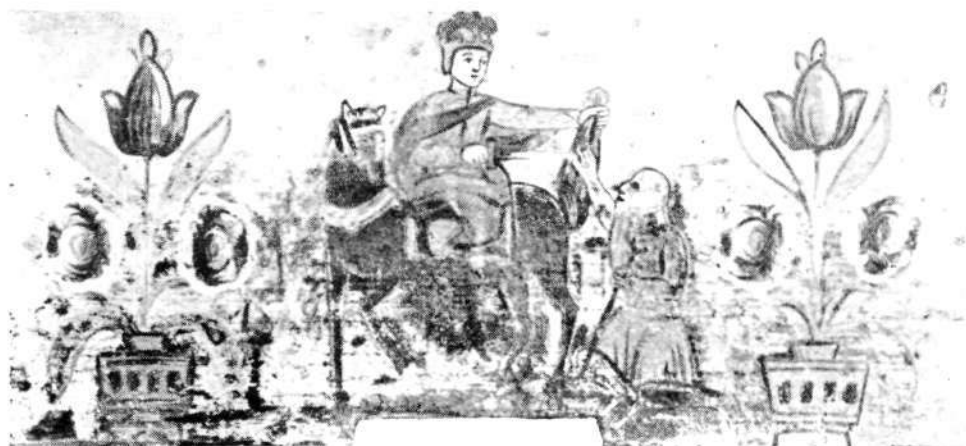
Sv. Martin. (Etnografski muzej v Ljubljani.)

Ta aspekt pa se spremeni, kadar ne opazujemo vsake končnice posebej, ampak nekoliko oddaljeno celotno pročelje čebelnjaka s poslikanimi končnicami. Takrat je namen končničarstva, ustvariti barvno sočno ploskev, ki sredi naravnega okolja učinkuje kot pisana preproga ali mozaik. Opraviti imamo torej z neko dvojno umetnostno strukturo tega slikarstva, pre-