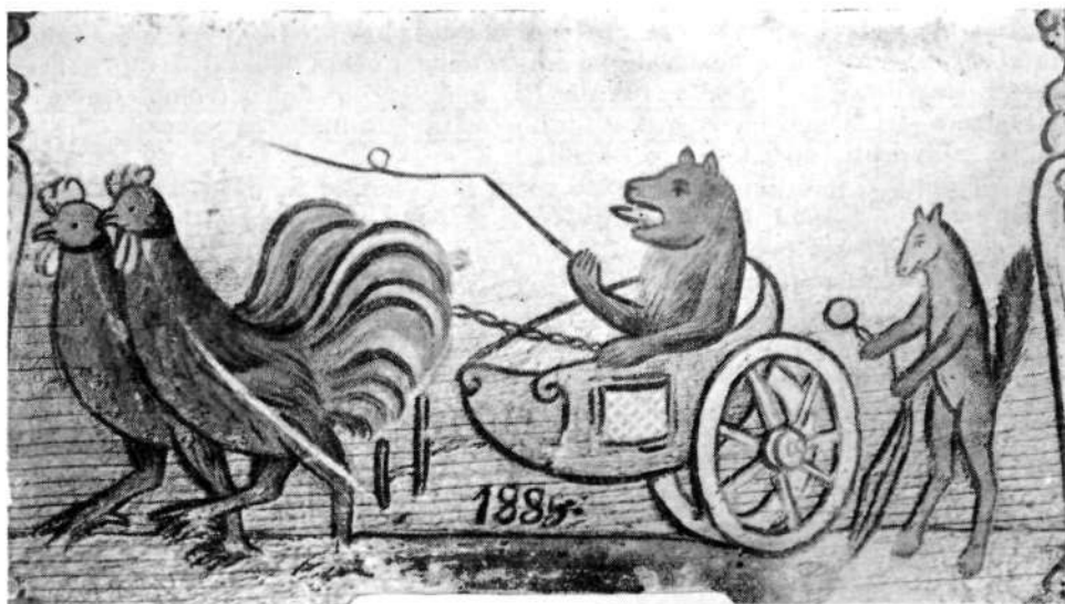
Petelina peljeta medveda. Z letnico 1889. (Etnografski muzej v Ljubljani.)

Iz javnih in nekaterih privatnih zbirk smo izbrali tista dela, ki kažejo stilno sorodnost s slikami na steklo, izdelanimi v selški slikarski delavnici. 5