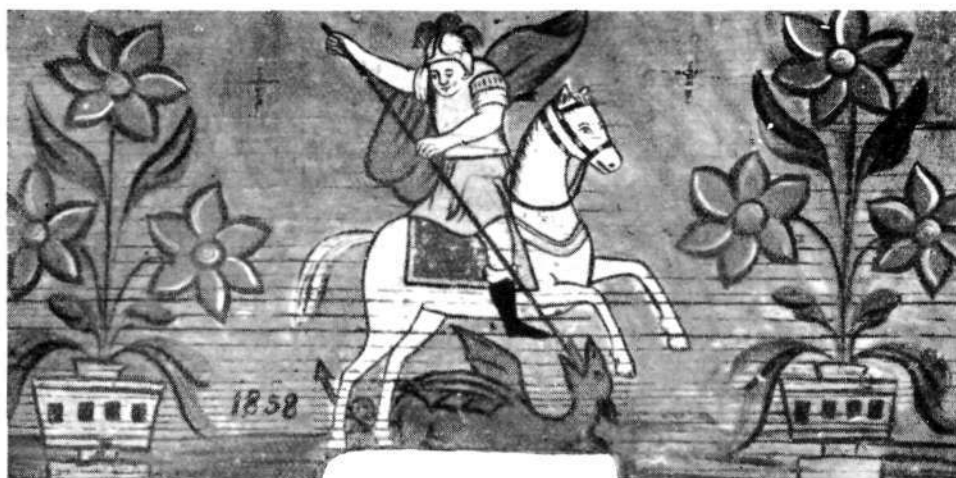
Sv. Jurij. Z letnico 1858. (Etnografski muzej v Ljubljani.)

Selška delavnica je te znane načine prevzela in nekoliko po svoje modulirala. Zato je njena zasluga bolj v množični produkciji kot v ustvarjalnosti, zlasti če pomislimo, da je v drugi polovici 19. stoletja v veliki meri obvladovala trg na Gorenjskem. 10