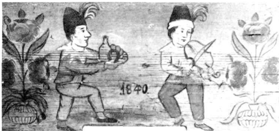
Komedijanta (?). Z letnico 1840. (Etnografski muzej v Ljubljani.)

Večino motivov je delavnica prekopirala ali prevzela s končnic drugih slikarjev. Del motivov pa je delavnica sama vnesla v slikarstvo na panjskih končnicah. Med temi so: kralj David; cirkus; godec in komedijant; iniciacija Mandana Indijancev; Indijanci ugrabijo beli dekleti; kmeta se pulita za kravo, advokat jo pa molze; s polja gredo; s košnje gredo; krojač obmetuje ženo z orodji; lov na tigra; Samson nese vrata; Ozej in betelski