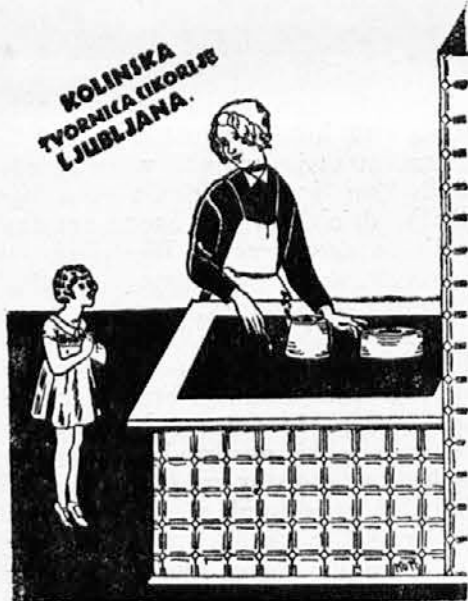
Prava KOLINSKA CIKORIJA.

Brezposelnost tudi na Japonskem. Zveza japonskih strokovnih organizacij izjavlja, da je število brezposelnih na Japonskem 400.000, kakor se uradno označuje, veliko prenikzo in da znaša faktično njih število najmanj 1.200.000. Vlada je za razna za-