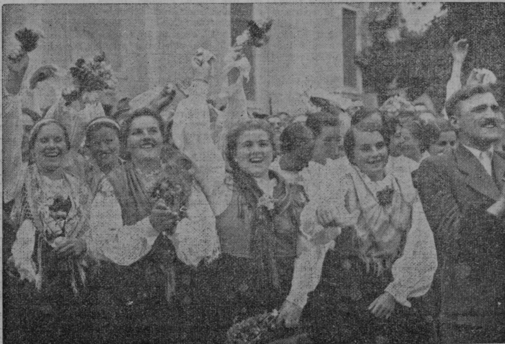
Prizor dekliske navdušenosti na velikem taboru pri Sv. Trojici v Slovenskih goricah.