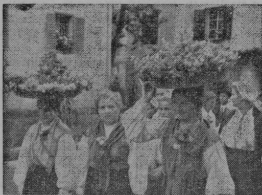
Dekleta v narodnih nošah so nosila košare cvetja na glavah v sprevodu pri Sv. Trojici v Slovenskih goricah

Odbor je dalje podaril Hughesu letalo, ki je krščeno na ime »Svetovna razstava«. Aeroplan ima najmodernejšo napravo za radio-zveze na morju ter na kopnem ter