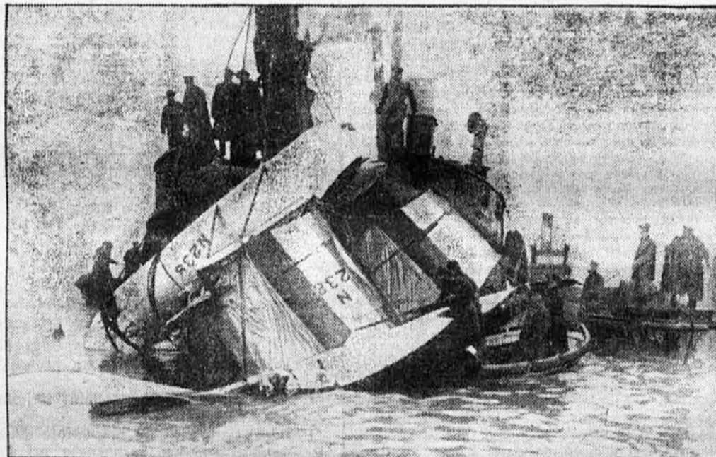
Pospravljanje ruševin razbitnega angleškega veleletala »Iris III«.