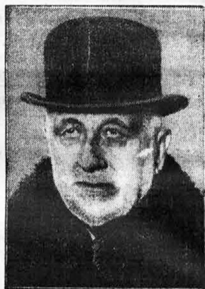
Italijanski državnik Tittoni †. Bivši dolgoletni italijanski minister zaunanje zadev Tommaso Tittoni je umrl. Zadnja leta se ni več udeleževal političnega življenja.

Mladi sportniki v kopališču Miami (na Floridi, Zedinjene države), ki goje ježo na vodi, so al pridrtili na svoje aparate mal motor, tako da ne potrebujejo več brzih motornih čolnov, kd bi jih vlekli.