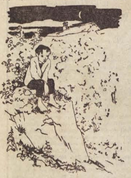
Ilustracija Nikolaja Omerze k Bevkovi knjigi »Mali upornik«

osvobodi Tomažkovo mater — pa tudi Peter Smuk prejme zasluženo kazen. Vsa zgodba se srečno konča: oče in mati in sin so v gorah in v borbi. Njihova hiša je požgana, a nekdo je na napol porušeni zid napisal z rdečo bar-