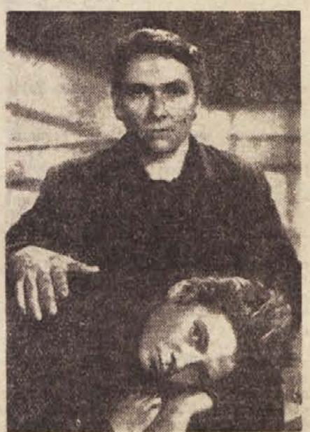
Prizor iz filma »Čistilci čevljev«

lik (ki bi bil lahko po svoje živ) z neljubko papirnato bledico... Poonostavljeni in šablonskih meč bi našli pri natančnem pregledu še več. Med slabosti romana sodijo nekateri nerodno postavljeni prizori (na pr. začetni dialog z nenadnim prihodom Francozov), neoriginalni vložki (štorija o varljivih ključarici Klotildi), prazna mesta (zadeva s čevlji — sicer simpatičnega — profesorja Koščika), pregrobo tipiziranje (tudi Koptarja je nerodno slikati le s črnimi barvami)... Tudi jezik, z ozirom na posebnosti okvira romana, bi bil lahko bogatejši, morda narečno barvan in nekoliko starinski (čemu je dolensko narečje neločno uporabljeno samo na enem mestu?)