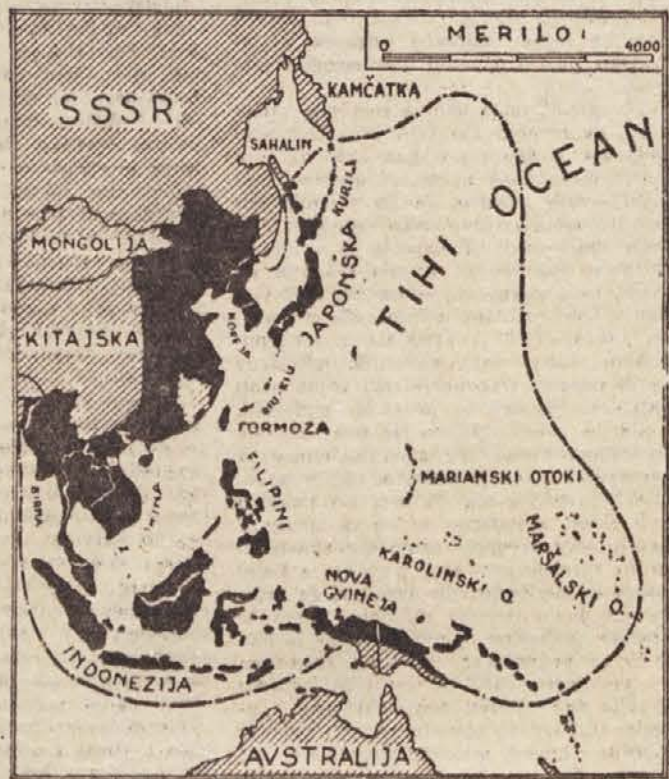
Japonska na višku svojih osvajanj

V koliko bo mirovna pogodba podpora progressu na Japonskem, v toliko bo tudi pogodba o miru z Japonsko in ne bo le začasno premirje pred novim viharjem.