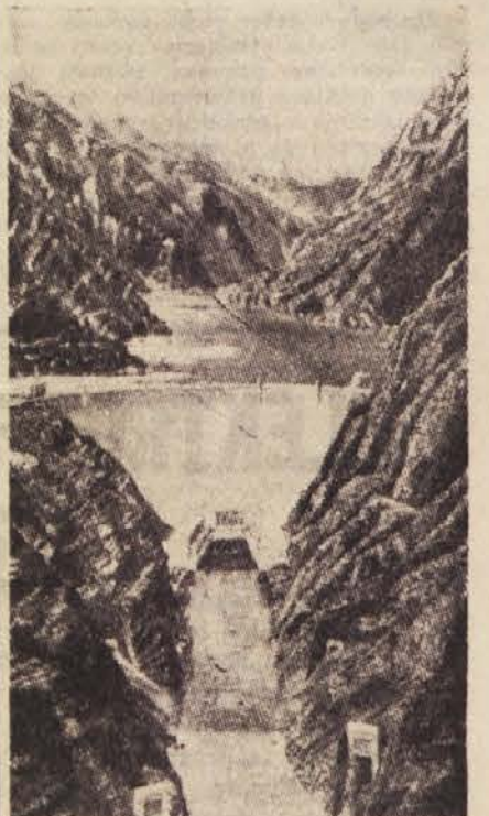
Jez bo visok kot 70-nadstropni nebotičnik, vanj bodo vgradili 12.000.000 ton betona.

Četudi je kanjon divjl, ga raziskovalci in inženirji le občudujejo, ker ima vse fizikalne lastnosti za veliko gradnjo, ki bo lahko konkurirala Hooverovemu jezju glede višine in drznosti zamislj. Betonjski jez bo visok okrog 240 m, pri dnu debel okrog 220, a na vrhu okrog 15, od obale od obale bo meril njegov vrh okrog 580 m. Z maso okrog 6 milijonov kubičnih metrov bo po velikosti tretja betonjska zgradba na svetu.