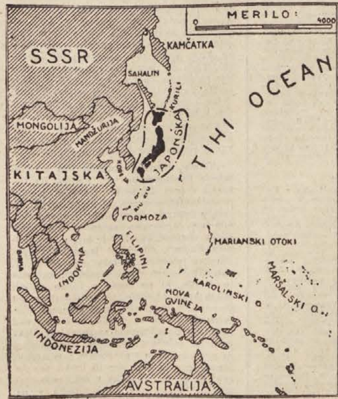
Po predvideni mirovni pogodbi bo Japonska omejena na štiri največje otoke: Hokaido, Honču, Sikoka in Kišu.

Vendar so se gospodarske razmere v zadnjem letu na Japonskem močno popravile. Temu je prispevala zlasti vojna na Koreji. Položaj Japonske kot najbližjega zaledja čet združeneja poveljstva je prinesel japonskim trdkam mnogo donosnih kupelj, predvsem v ladjedelstvu. Japonski izvoz se je hitro povečal in primanjkljaj v trgovinski bilanci se je lani zmanjšal na 105 milijonov dolarjev. Japonsko blago je začelo prodirati na svetovna tržišča; pred nedavnim se je na primer na turinskem kongresu zastopnikov tekstilne industrije pojavilo japonsko tekstilno blago zelo dobre kakovosti in po cenah, ki so bile mnogo nižje od cen prodajalcev drugih dežel. Prav (Nadaljevanje na drugi strani)