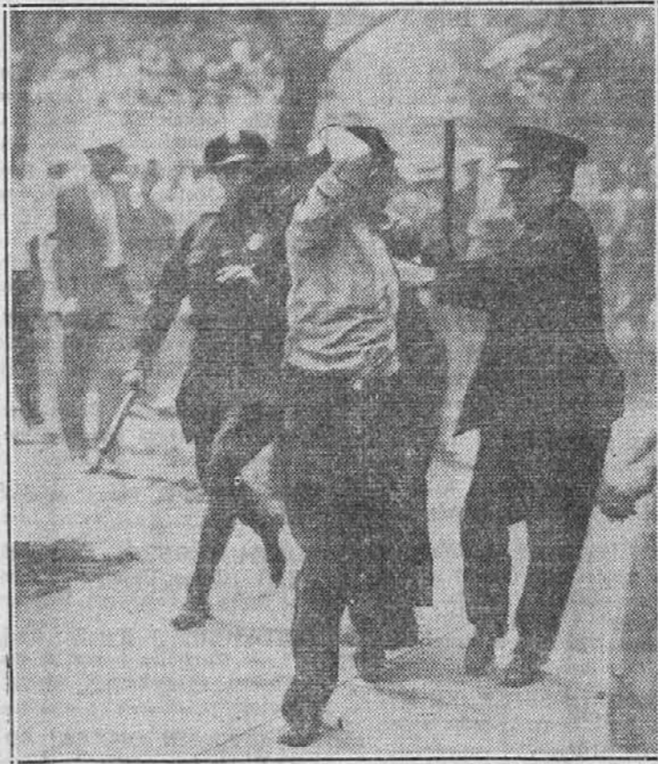
Slika kaže, kako policaji razganjajo stavarke v Camden, N. J. izprde tovarne RCA Viktor Co.