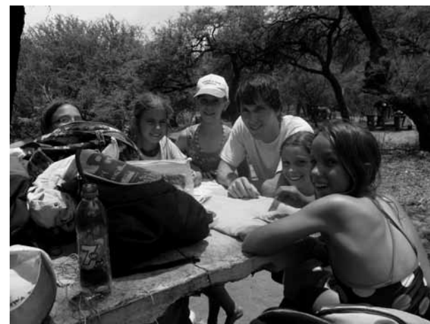
Pri malici in razgovoru