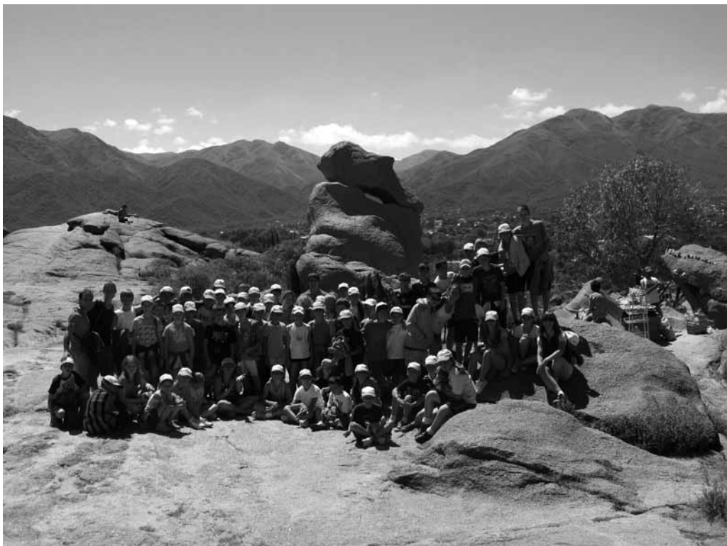
S tradicionalnim »čevljem« v ozadju

... Koliko lepega jim je moral še povedati! Vemo pa, da je za lep uspeh kolonije