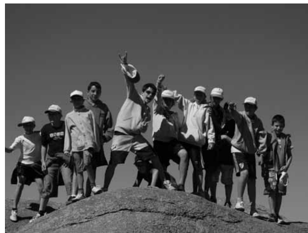
Teh se ja pa za bati

Deset dni pa kar hitro mine, če nas vsak dan čaka toliko lepih doživetij. Preživeli smo tudi čudovit, čeprav prašen, dan v reki Quilpo; klicali smo domov in nakupili spominčke v Capilla del Monte; spoznali smo posebno skalo »El Zapato« in se nekaj časa tudi spuščali po veliki drsalnici! Kako je bilo zabavno! Doživeli smo tudi hudo nevihto, zaradi katere smo nekaj trenutkov ostali brez luči!