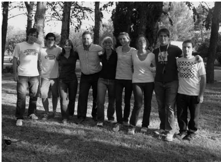
Veseli (a skrbni) voditelji