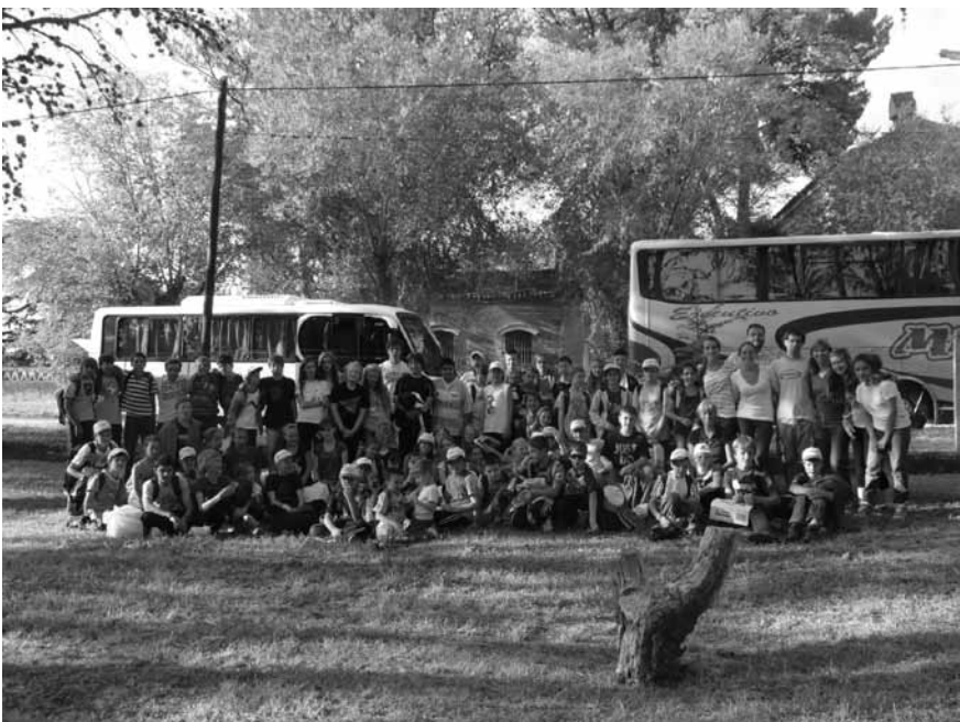
Levo: En avtobus ni bil zadosti