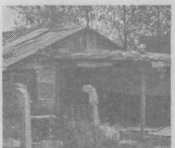
Pred nedavnim so »padle« barake ob Tovarniški ulici

V soseski MS 8-4 Zg. Kašelj pa je nastalo novo naselje z 92 stanovanjskimi enotami, v katerih je od tega trenutka našlo novi dom 77 družin. To seveda pomeni približno enako število barak manj! Občinski štab pričakuje, da bo do konca septembra v celoti odpravljeno barakarsko naselje ob Kašelskem mostu, tako da bo ostalo v občini 41 barak. Trenutno je najbolj prečeč naselje ob Žitu, kjer živi 21 družin, saj je zaradi nesnage nevarno za celotno Ljubljano. Kaj lahko namreč pride do okužbe talne vode, ki teče proti črpalnišću Hrastje; pa tudi k živilskemu kombinatu najbrž tako naselje ne sodi.