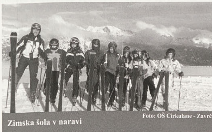
Zimska šola v naravi