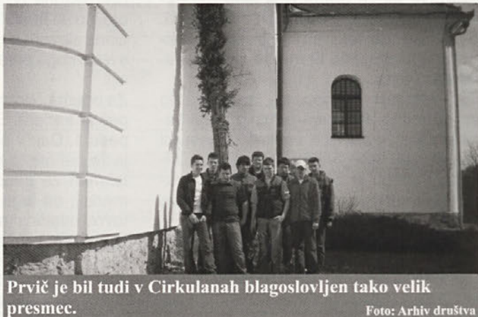
Prvič je bil tudi v Cirkulanh blagoslovljen tako velik presmec.

Sicer pa si je naše društvo zadalo cilj, da naslednje leto nadaljuje z izdelavo presmeca v vsaj podobni velikosti.