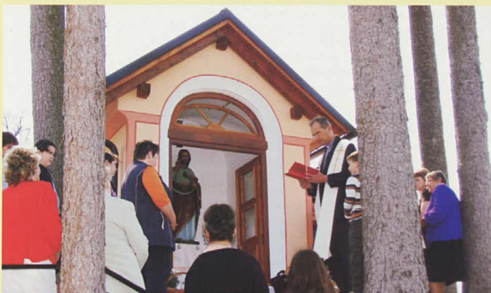
Blagoslov obnovljene kapele