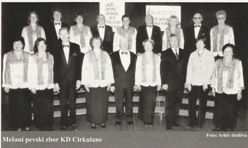
Mešani pevski zbor KD Cirkulane

Tudi Kulturno društvo Cirkulane in občina Cirkulane nas zadovoljivo podpirata v pevski dejavnosti, odlično pa je tudi sodelovanje z Osnovno šolo Cirkulane - Zavrč in drugimi društvi v naši občini. Zraven vseh naštetih ugodnih pogojev za pevsko dejavnost pa smo pevci močno zaskrbljeni za našo prihodnost zaradi slabe pevske aktivnosti mladine, ki bi se morala že iz osnovne šole vključevati v naše vrste. Nekaj pobud za vključitev nam je pred leti sicer uspelo. Ponosni smo na dejavnost in uspešnost Mladih veseljakov, vendar menim, da bi moralo tudi vse mlade pevce v Cirkulanah, kakor tudi druge mlade občane, skrbeti, kaj bo z zborovskim petjem v Cirkulanah v prihodnosti, če ne bomo odgovorno razvijali pevske dejavnosti mladostnikov. Odgovor je na dlani. Zbor bo upravičeno razpadel, kot razpadajo naše lepe haloške gorice. Tudi vinogradi se več ne dosajajo in ne vzdržujejo, ker se pač to ne izplača. Za takšno stanje so