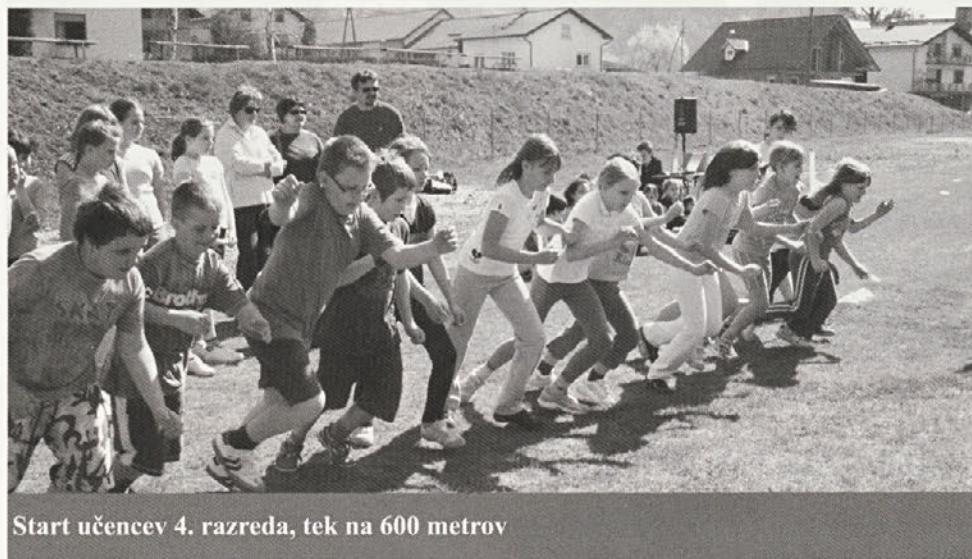
Start učencev 4. razreda, tek na 600 metrov