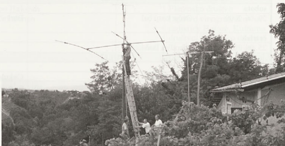
Postavitev antenskega sistema za delo na kratkem valu v letu 2008

Od 15. do 17. maja se bomo priključili akciji »EU sončni dnevi« in ponazorili na različnih lokacijah uporabo sončne energije za proizvodnjo električne energije in njeno uporabo pri delu z radioamaterskimi postajami.