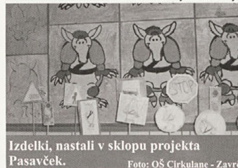
Izdelki, nastali v sklopu projekta Pasavček.