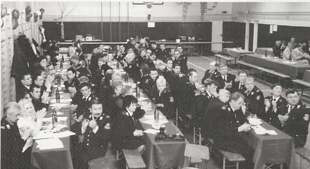
Utrinek z letošnjega občnega zbora PGD Cirkulane

Ob občinskem prazniku pa želimo vsem občankam in občanom prijetno praznovanje z gasilskim pozdravom »Na pomoč!«.