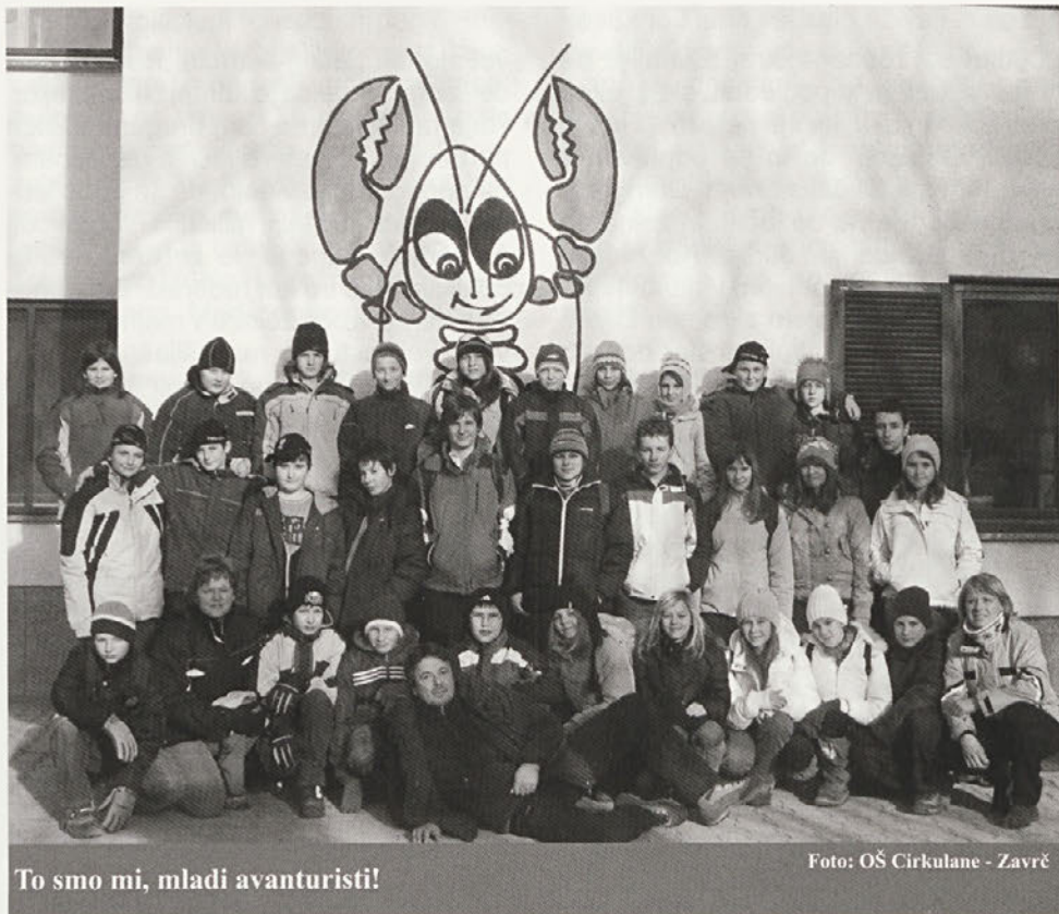
To smo mi, mladi avanturisti!