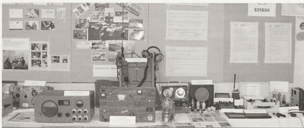
Delček razstave ob 40. obletnici delovanja radioamaterstva na območju Cirkulan