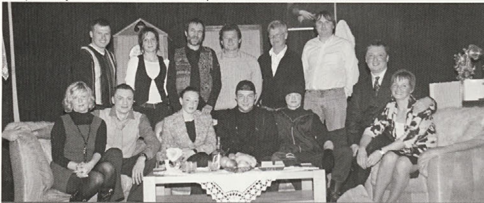
Dramska sekcija KD Cirkulane

Vsem bi se rad prisrčno zahvalil za ves trud, marljivo delo in požrtvovalnost. Vse to smo dobili poplačano z bučnim aplavzom po odigrani predstavi. In to je za nas največja nagrada.