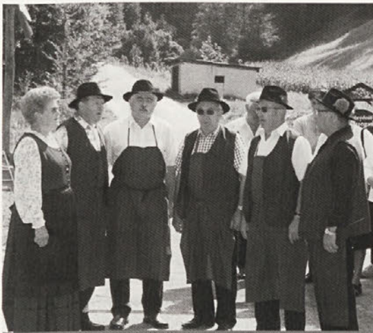
Ljudski pevci KD Cirkulane