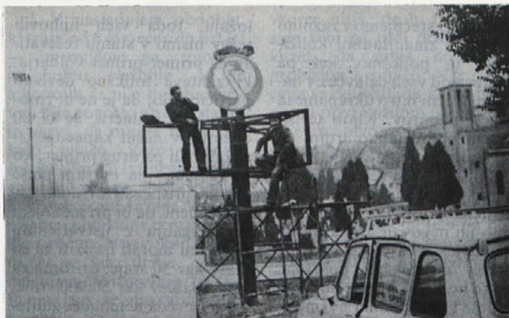
Postavljanje znaka pred Labodom, ki bo služil kot smerokaz in kot reklamni napis.

Sicer pa poglejmo, koliko nas nadure stanejo: za delovno organizacijo so za 50 odstotkov dražje od redne ure, delavec pa plača za naduro po novih prispevnih stopnjah 34,63%, za redno uro pa 29,82%. Če ostanemo pri tem, koliko stane nadura delovno organizacijo, ne smemo spregledati, da sobotno nadurno delo zahteva še prevoz na delo ter malico, ta pa sodi tudi k podaljšanem delovnem času, če je delavec na delu več kot 4 ure v podaljšanem delovnem času. To ceno nadure še poviša in zato je seveda nujno pretehtati kdaj in zakaj gre nadura ali zares ni moč (razen v proizvodnji) teh ur koristiti kasneje v istem ali v prihodnjem mesecu.