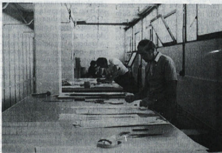
Z delom je začela tudi priprava dela za program kril, kjer je zaposlenih devet delavcev. Kljub začetnim težavam, so se uspešno vključili v pripravo kolekcije za pomlad — poletje 84, kjer so sodelovali s pripravo VO v Ljubljani.

Opisani propad je mogoče ustaviti s pravočasnim in ustreznim zdravljenjem in prevzgojo. Čimprej se začne alkoholik zdraviti, tem manjše zdravstvene posledice bodo ostale po zdravljenju.