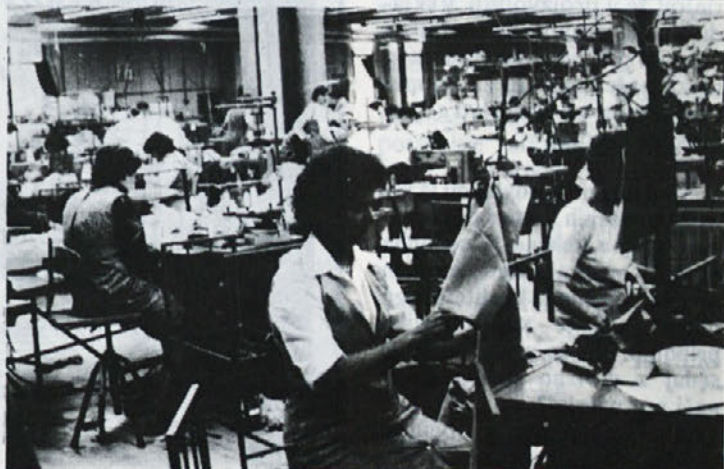
V Ptujju so usposobili posebno centralno kuhinjo za pripravo dietne hrane. Njihova stranka je tudi Delta, ki dnevno naroča kar 70 dietnih malic.

zaposlene v Tip-topu in v enoti Commerce velja fiksni delovni čas. Torej bodo z evidentiranjem prisotnosti na delu dosegli v ljubljanskem delu Laboda več reda in spoštovanja delovnega časa. Pravilnik namreč določa, da se vsak manjko obračuna v minus oziroma velja le toleranca petih minut.