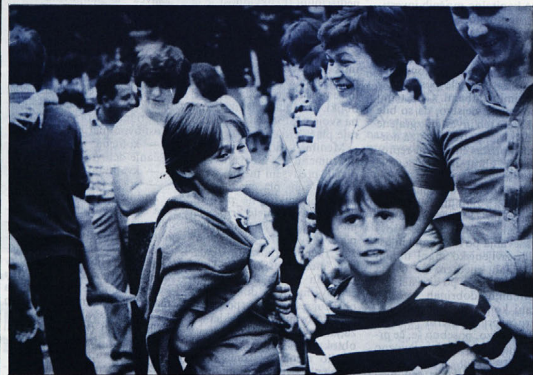
Šola se je začela, z njo pa veliko obveznosti in skrbi otrok in staršev. Spomin na brezskrbne počitnice pa bo še dolgo živ. Na posnetku: otroci naših delavk ob vrnitvi iz kolonije.

Kljub neštetim opozarjanjem, pisanju v našem glasilu, opozorilom na sestankih komisij za družbeni standard in pogovorom na zborih delavcev se napake iz leta v leto ponavljajo in celo stopnjujejo. Prav žalostne so ugotovitve, da še vedno marsikdo ne pospravi za seboj, da je zaradi malomarnosti (odprtih oken) prišlo v prikolico do poplave, da hladilnik ni delal zato, ker je prikolica visela (kaj je to povzročilo, si lahko le mislimo), da si nekateri letovalci zaradi malomarnosti niso napeljali niti elektrike v prikolico. V hišicah so puščali osebne predmete, neprimeren in često celo nehigijenski odnos pa so nekateri letovalci imeli tudi do okolice hišic, plaže itd. Poleg naštetega pa tudi letos ni