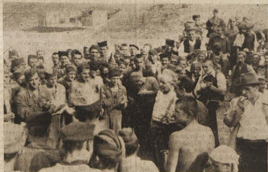
Pisatelj Martin Andersen Nexö je obiskal mladinske brigade pri gradnji proge Brčko—Banovići.

Mladinsko progoc. Bil je navdušen nad sprejemom, ki mu ga je priredila mladina in nad vsem, kar je videl na »Mladinski progic«. Iz Zagreba, kjer je prisostvoval proslavi hrvaške narodne kulture na glavnem nastopu »Seljačke sloge«, je odpotoval v Istro. V Ljubljano bo prišel predvidoma v petek.