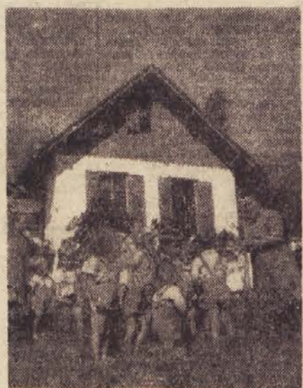
V Jeruzalemu imajo najmlajši svoj dom

malo misliti na kaj drugega kot na delo. Posebno velika dela, kot so košnja, žetev in podobno, tako zaposle kmečkega človeka, da na družino, pa tudi na otroke, kar pozabi. Pa ni prav, da je vaški drobni v tem času najbolj prepuščen sam sebi, da prebija prelepe poletne dneve brez nadzorstva bodisi zaprt po temačnih in bolj ali manj nesnažnih izbah ali pa na pekočem soncu po ozarh. Če se lotevamo v združenih umnejšega načina kmetovanja, se moramo prav v njih lotiti tudi boljše, predvsem pa bolj strokovne nege in vzgoje otrok! Lea Jakič