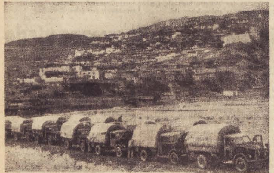
Kitajska kolona pasira Lhaso. Kitajske čete še niso prevzele oblasti v Lhasi

Buenos Aires, 6. aprila. Po podatkih, ki jih je prinisel argentinski časnik v angleškem jeziku »Rimes«, se je izvoz mesa iz Argentine zelo zmanjšal, ker je bil izvoz v Britanijo ustavljen. Tako je n. pr. v letošnjem januarju v Italijo izvozlja kromaj 19.880 ton mesa, v primeru z 89.553 tonami v januarju 1950. Vel. Britanija, ki mora meso uvažati, pa uvažuje zdaj meso iz držav Britanske skupnosti, ker se z Argentino ni mogla sporazumeti za ceno.