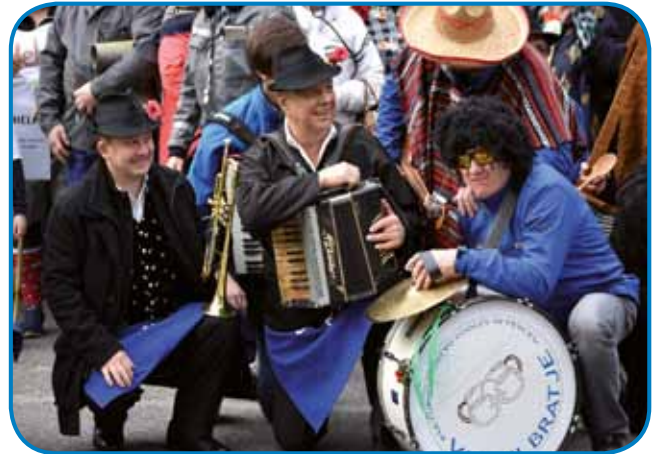
Zdrüženi veseli goslarge s Petrauvec pa Gederovec so cejlo paut volau redili