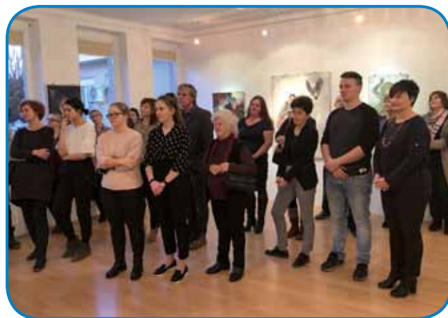
Del občinstva, ki so ga sestavljale vse generacije