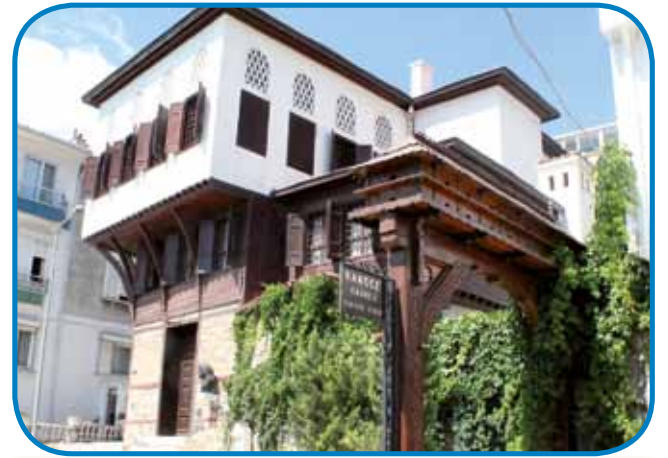
Spominska iža Rákóczina v törskom varaši Rodostó (Tekirdag)

Zmejs, ka se je knez tak po Evropi anglo, je v sodačiji Kruco več samo 10-12 ge-