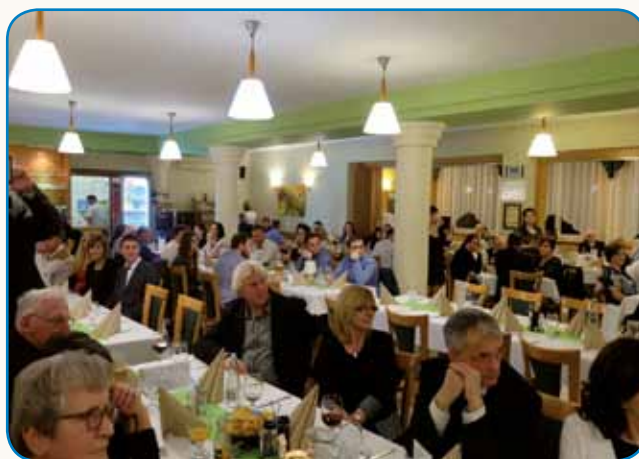
V MONOŠTRU SPET SLOVENSKI PLES stran 6