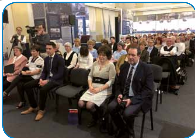
Več kot sto udeležencev slavnosti - v prvi vrsti ožja družina jubilancke

lepših pa na prijateljsko sodelovanje z »jugoslovanskim« mladinskim pevskim zborom njene sestrične. »Preko lepe pesmi lahko spoznamo le-