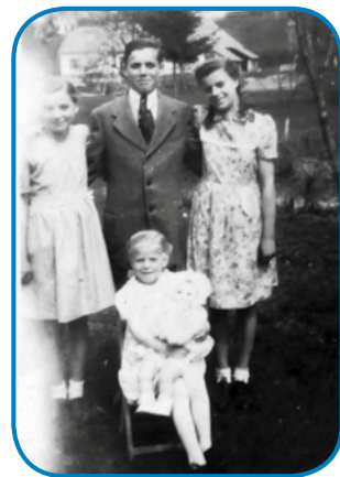
Mala Iluš z babov v rokej;