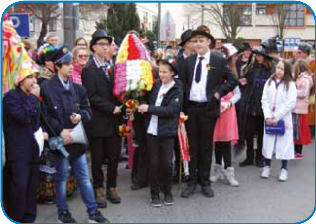
Šaularge s Kuzme so nutpokazali svojo fašensko šego, v šteroj se pojep s »korinöv oženi