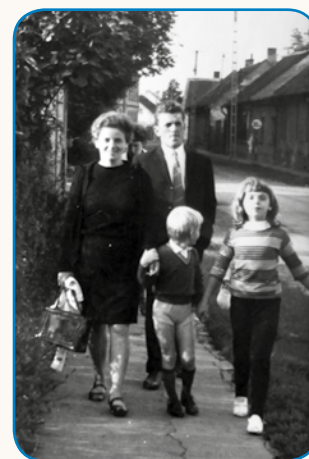
Z AUBOV NA GLAVEJ MISLIMO... stran 8