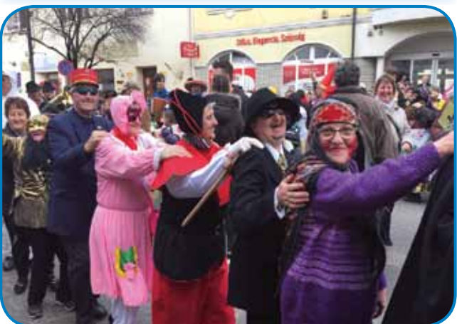
»Naš gözöš že tapatalejska« - največ fašenköv je bilau z Društva porabski slovenski penzionistov