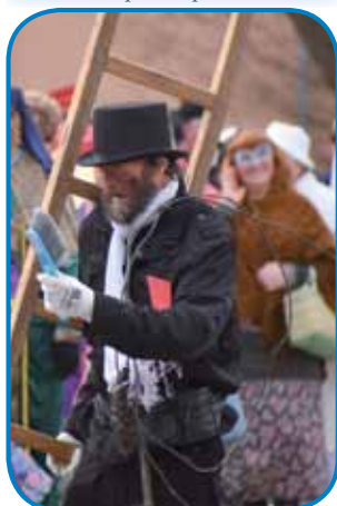
Raufenkera je v Varaši nej mogo na streje plejzditi