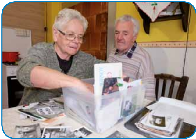
Tetica Iluš z možaum med prebiranjom kejpov

krat, gda si tak gunčimo, ka ednoga tü boli, drugoga tam boli, edni tau pravijo, ka gda so naše materé telko stare bile kak zdaj mi, one so vacalejk