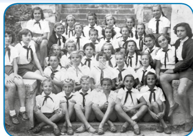
Bila je pionirka tö; kejp je bijo napravleni v Mikosszéplaki

- Tetica Iluš, sto so na taum malom, najstarejšom kejpji dolapostlikani, gde štirje stojijo?