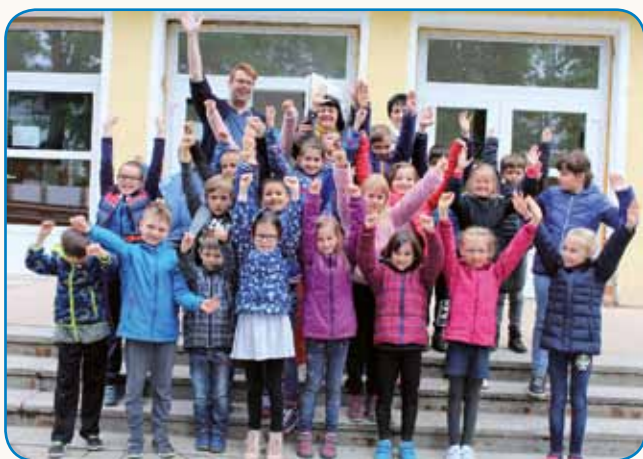
SLOVENŠČINA MU JE PRIRASLA K SRCU stran 4

«Vino pijte, nej vodau, repo gejte, nej mesau ...»