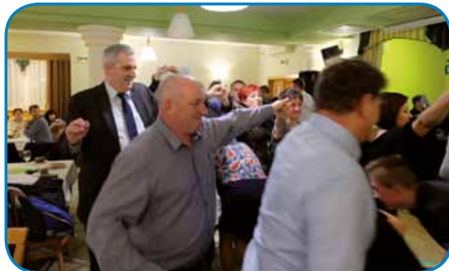
Plesišče je bilo zmeraj polno