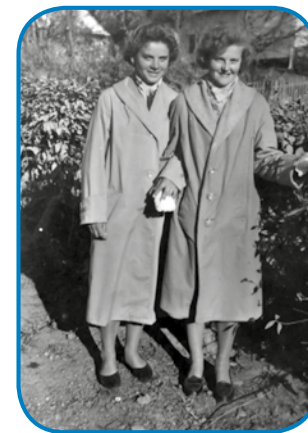
s padaškinjov sta meli gnake kabate

na tjeppi, te gda so zabadali, je lüstvo že gornaravnjano bilau.«