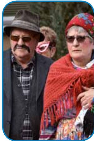
»Té z badjüsi mi je 12 mlajšov vküpnakaröpö!«