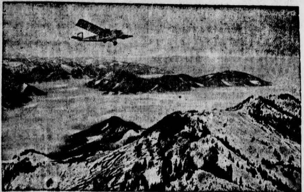
Ein dreimotoriges Rohrbauch-Flugzeug der Deutschen Luft-Gesellschaft überquerte die gesamte Alpenkette bei einem Fluge von München nach Mailand.

co. B e r l i n, 22. April. In politischen Kreisen wird auf die Verschärfung des jugoslawisch-italienischen Konfliktes hingewiesen, wobei die Möglichkeit des Zusammentritts des Völkerbundes im Juli betont wird. Man erklärt an kompetenter Stelle, das bekannte Communiqué Mussolinis habe die Gegensätze fast unüberbrückbar gemacht. Wie aus London berichtet wird, soll in englischen Regierungskreisen die Haltung Mussolinis sehr verstimmt haben. Die englische Auffassung ist in einem scharfen Artikel der „Times“ wiedergegeben, die der römischen Regierung Mäßigkeit rät und den Widerruf jener Stelle des Communiqués fordert, in dem Mussolini jede Revision des Tirana-Vertrages grundsätzlich ablehnt.