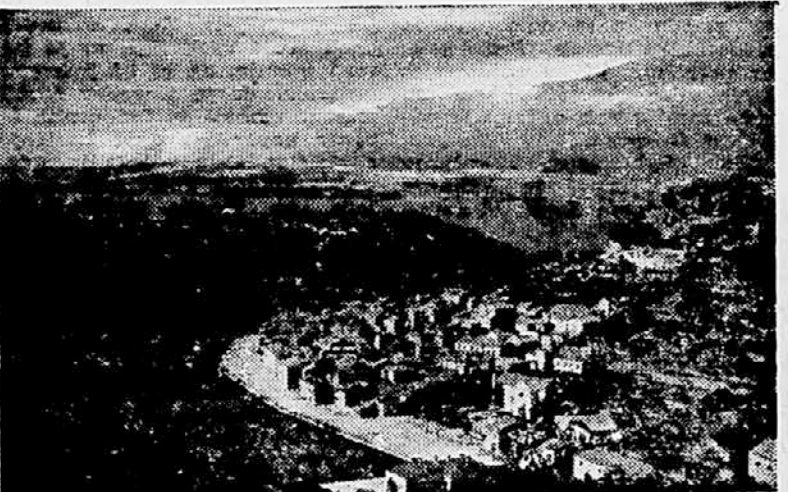
Novi grad je staro mesto ob ulici reke Zrmanje, kjer tudi lahko preživimo udoben dopust po zmernih cenah. Dnevni pension v restavraciji »PARK« dobimo že od 450 din naprej.

Tudi na OTOKU BRACU je več krajev, kjer lahko za zmerne cene preživimo letošnji dopust. Tu vam priporočamo POSTRO, kopalski podjetje »SUNICA«, Postira, otok Brač.