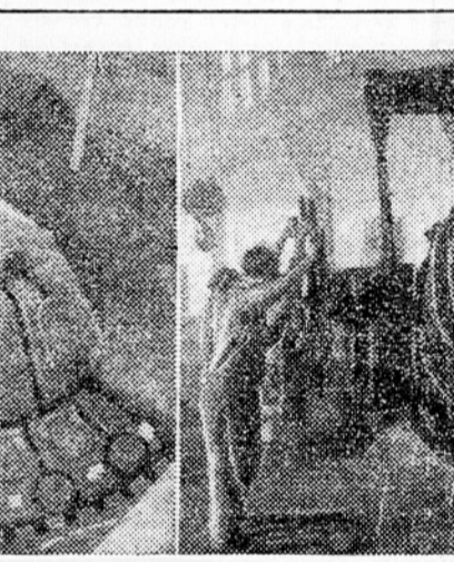
V Litostroju so včeraj vtili polovico velikega pokrova turbine za hidrocentralo Medvode. Slika na levi strani nam kaže spodnji del kalupa v livni jami, slika na desni pa vlivljanje tekočega železa v kalup iz velike ponve z vsebino 14 ton.