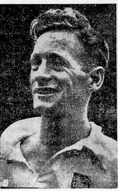
Tom Finney, član angleške reprezentance