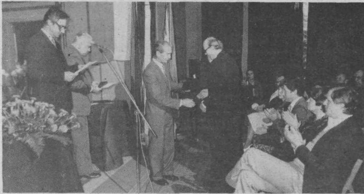
Ob krajevnem prazniku KS Poljane so najzaslužnejšim posameznikom in organizacijam podelili visoka državna odlikovanja, plakete KS Poljane ter bronaste znake OF.