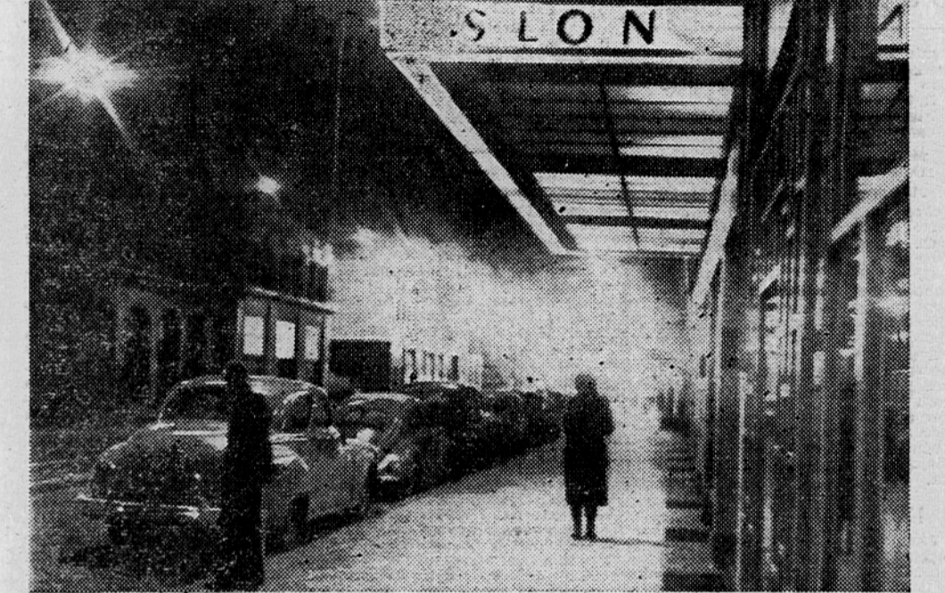
Zunanji izgled Ljubljane se je v zadnjem času temeljito spremenil, kar nam kaže tale slika Ljubljane ponoči