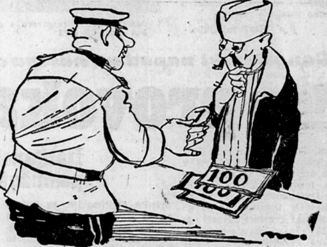
Kaj se pa čudiš: nič ti vendar nič ne koristita, 1 ti pa pošteno vračamo...

V Bolgariji so zamenjali 100 starih levov za 1 novega