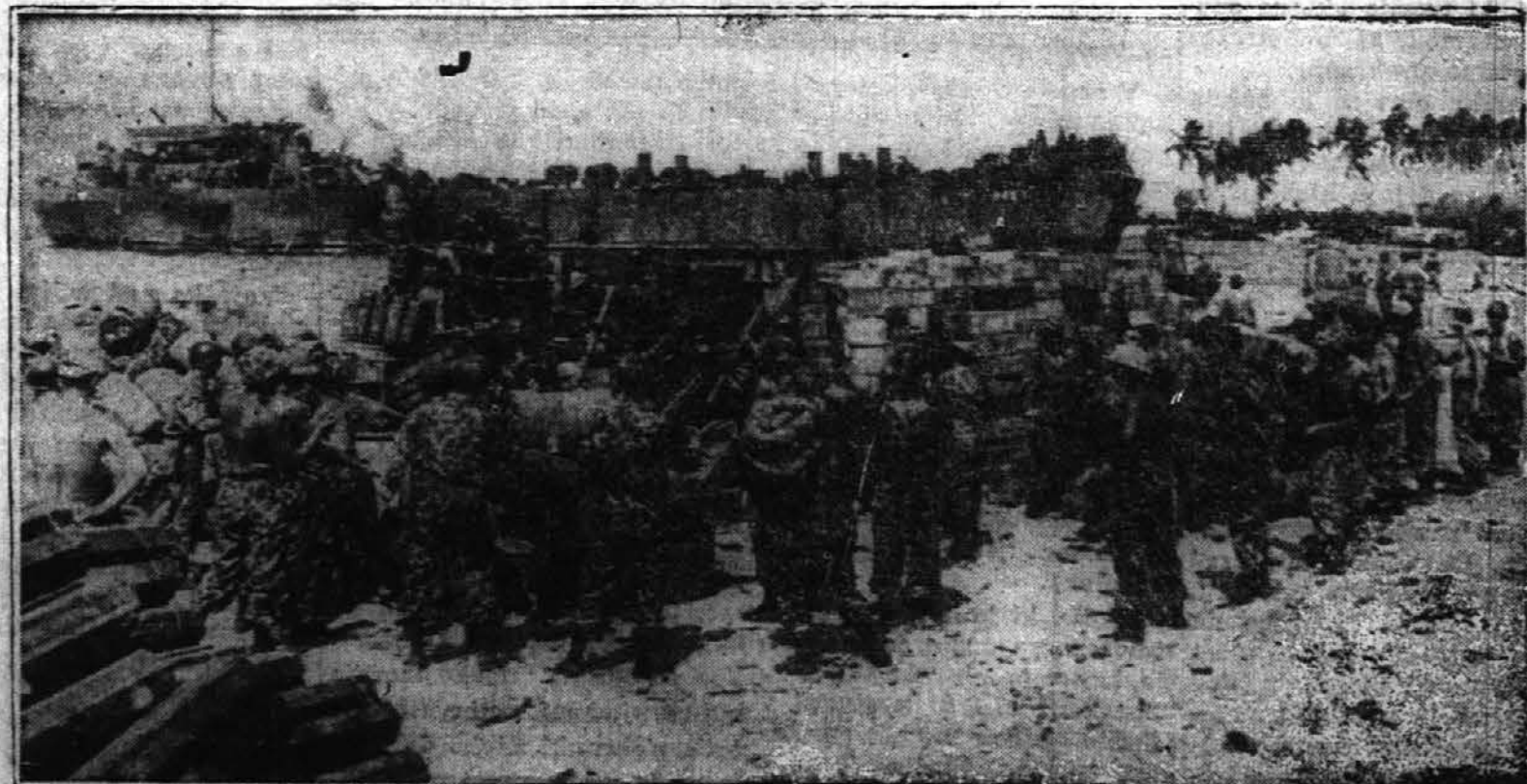
Kadar pride čas za to, ameriški mornarji lahko spremenijo svoje lise, toda prav sedaj jih njihove džungelske uniforme delajo komaj vidne na obrežju na Guadalcanalu. Iz ladij, ki so tam pristale, zbirajo opremo, potem pa bodo šli naprej do postojank. Kjer bodo morali napadati. Mornarji spadajo k parašutnemu polku, ki je ravnokar pristal na obrežju.