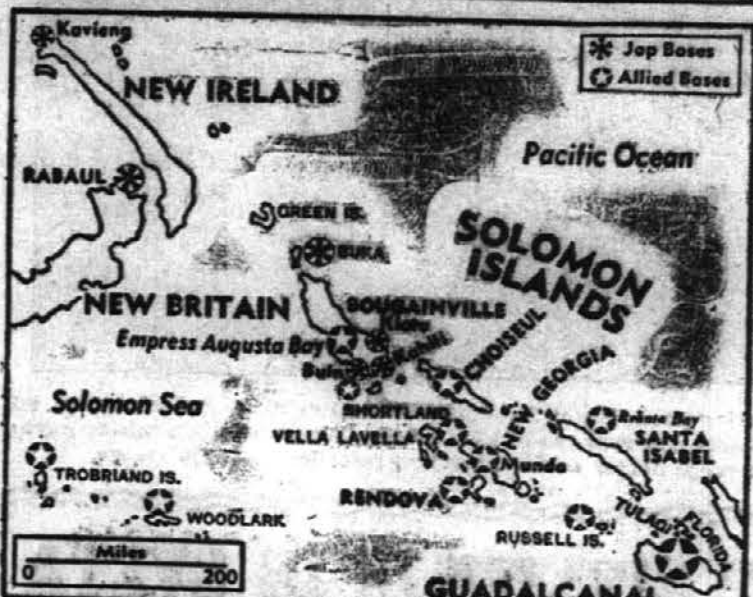
Zavezniki so začeli s ofenzivo na Solomonskih otokih avgusta 1942. Najprej so napadli Guadalcanal. Od tedaj so Zavezniki zavzeli Russell otok in otok Rendova, New Georgia, Vella Lavella, Santa Isabel, ter pristali na Treasury otokih, Choiseul in Bougainville ter Gilbertskih otokih.

razlagajo, zakaj se morajo vsi držati odrejenih cen pri nakupu.