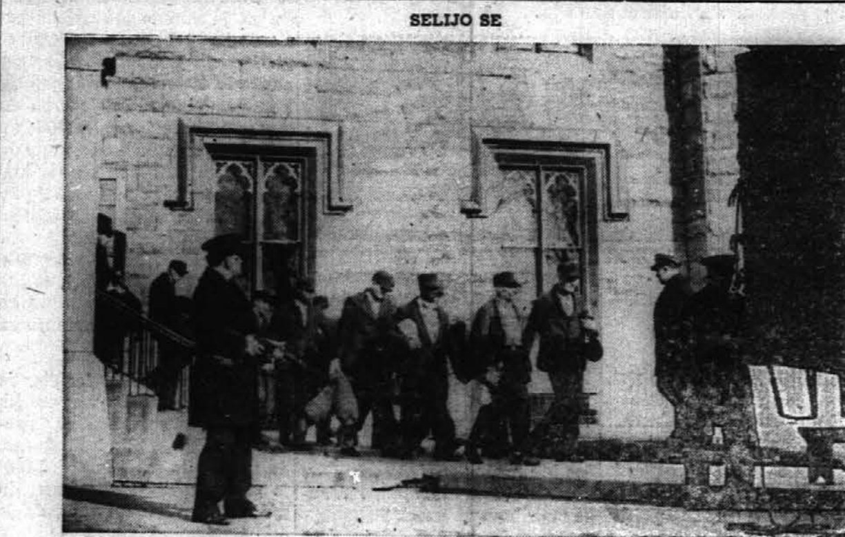
Kaznjenci, nekateri izmed njih dosmrtni, gledajo zunanji svet, ki ga že leta niso videli, ko zapuščajo svoje celice v kaznilnici v Jolietu, Ill. Le malo prilike imajo ozreti se na okrog, preden jih bodo spravili na truke, ki jih bodo odpeljali v modernizirane prostore 12 milj proč. v Stateville. Stari dom je poostanek iz dni Civilne vojne; novi dom pa ima prostora za 4.500 kaznjencev.