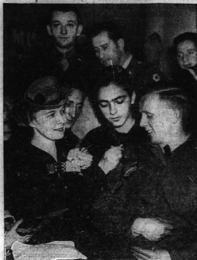
V Music Box kantini, v New Yorku, so letos zgodaj obhajali božično veselico, ker je mogoče, da bo za božič več teh fantov za prek morja. Mrs. Wendell Wilkie deli fantom blazinice, narejene v obliki konjske podkve; pravijo jim "foxhole pillows". Te blazinice so kaj pripravne za spanje na vlačku, na ladji, ali pa na bojnem polju.

members. Motion pictures will also be shown. A splendid time is assured for everyone present.