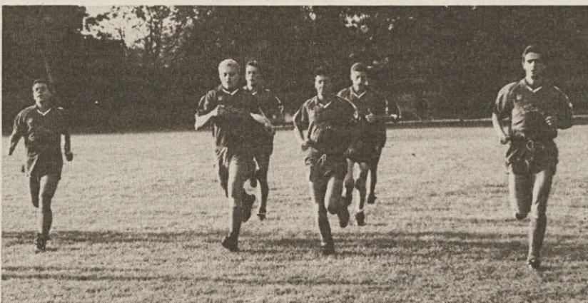
Večina naših nogometašev je že začela z delom za novo sezono. Na sliki igralci bazoviške zarje si nabirajo kondicijo za 1. AL.