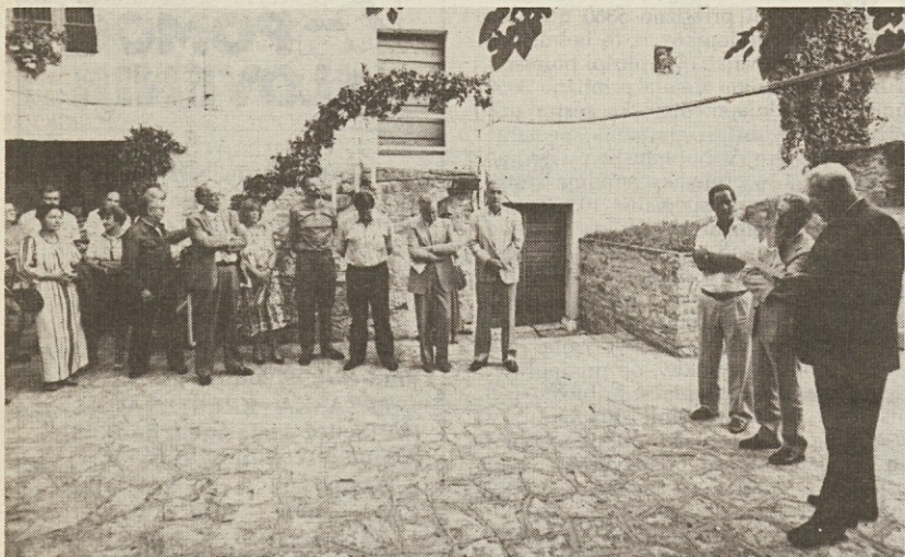
Posnetek s sinočnjega odprtja Kraške ohceti