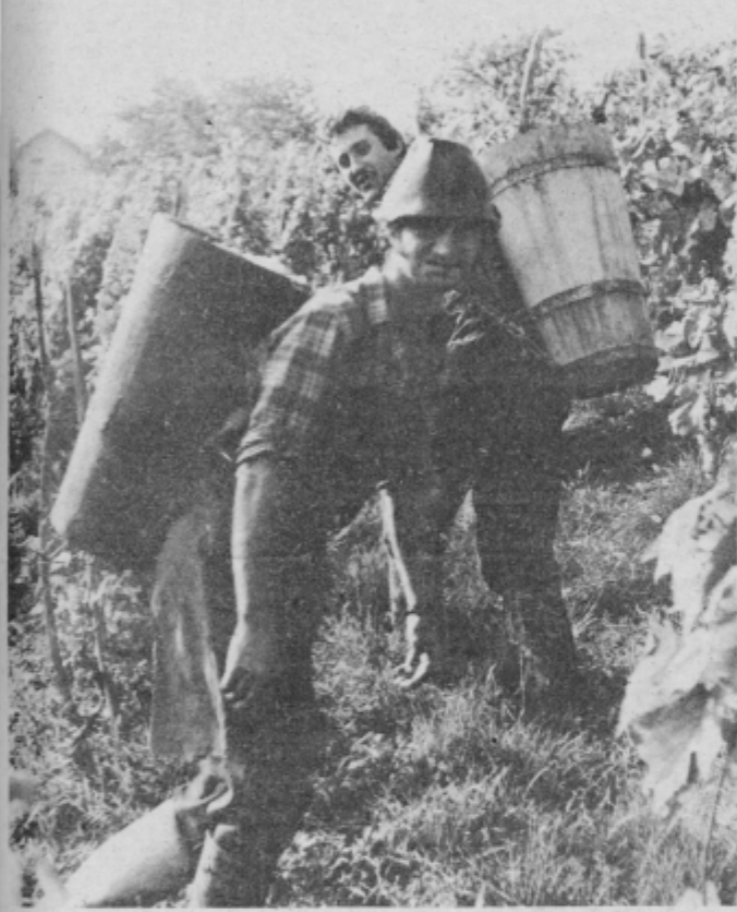
Nosači se potijo pod težo sladkega grozdja