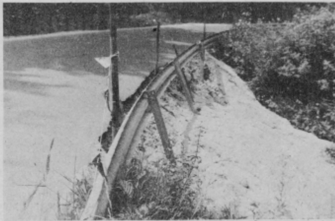
Zemeljski plaz na ne tako dolgo asfaltirani cesti pri Oplotnici.

Ni potrebno posebej iskati pot na bistriško Pohorje, naj bo to prek Tinja, Oplotnice ali Šmartna, povsod boste našli na cestne plazove, ki so danes vsaj delno zavarovani in označeni, zato pa nič manj nevarni. Odlaganje njihove sanacije pa samo povečuje stroške