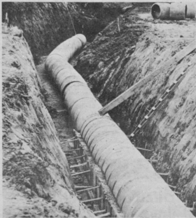
Z začetka del v Rabeljčji vasi