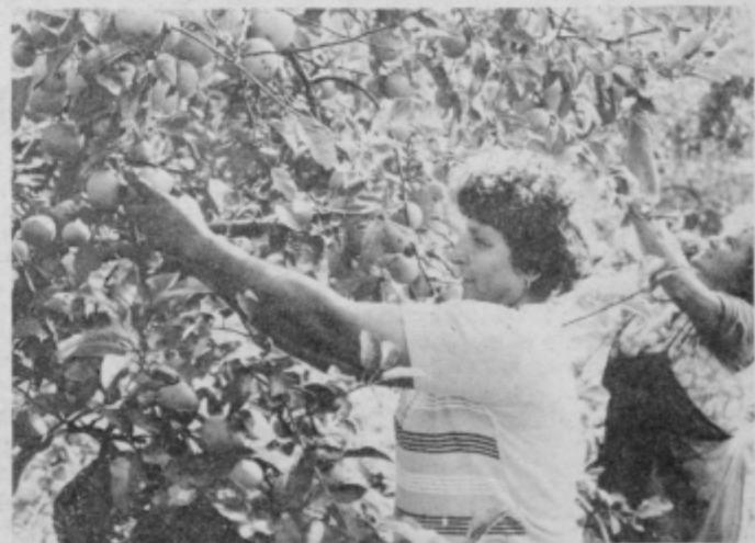
Obiranci so imeli te dni veliko dela