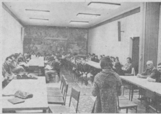
Udeleženci letošnje občinske pionirske konference v Ptuj.

Po uradnem delu srečanja so jih gostitelji odpeljali še na razstavo v prostore ptujske enote kreditne banke in na ogled dela v skladišču MIP-a, kjer so jih tudi pogostili. mš