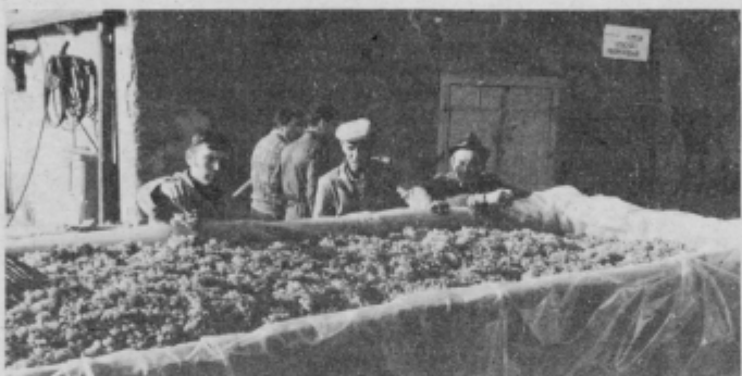
Strokovnjaki ocenjujejo kvaliteto grozdja