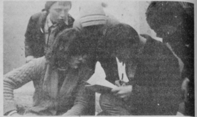
Izmeriti je potrebno azimut, ga zarisati na karti in cilj bo veliko bližje. Tako nalogo so pred nedavnim dobili učenci osnovne šole v Smartnem na Pohorju.