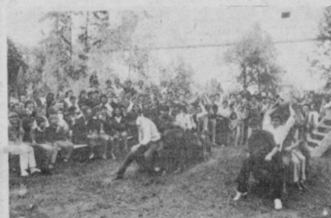
Tekmovanje s prenašanjem buč je izvabilo veliko smeha gledalcev