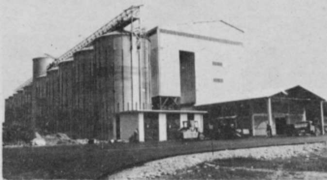
Nova mešalnica krmil čaka le še na uvoženo opremo.

V kmetijskem kombinatu se zelo prizadevajo povečati izvoz. Že od lanskega leta je v veljavi interna izvozna stimulacija, isto velja tudi na nivoju sestavljene organizacije združenega dela Emona. Pravkar so v teku razprave o povečanju izvozne stimulacije na nivoju SOZD. V ta namen bi v posebni sklad združili 2 promili celotnega prihodka vsake temeljne organizacije, vsak posamezni uvoz se podraži še za 10 odstotkov — za korišćene devize mora koristnik plačati še 10 odstotkov v posebni sklad, vsa ta sredstva pa se namenijo za stimuliranje izvoza. Poleg veljavne izvozne stimulacije bi tako izvozniki prejeli še 20 odstotkov vrednosti izvoza, tako bi lažje nastopali na tujem trgu, saj so izvozne cene precej nižje od tistih na domačem trgu. Povečane so tudi izvozne vzpodbude, ki jih daje narodna banka, vse to pa bo gotovo vplivalo na to, da bo lažje doseči letošnje izvozne načrte in da bo tudi izvoz v prihodnjem letu uspešnejši. JB