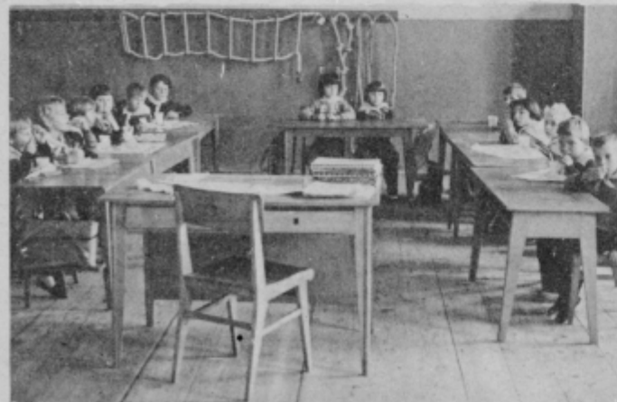
Veselo razpoloženi malčki v telovadnici v času malice

Pred tedni sem obiskal predšolske otroke v osnovni šoli Lovrenc na Dravskem polju, ki imajo svoj prostor kar v telovadnici šole, ker pač drugega prostora nimajo. Čeprav jim je gradnja nove šole že dolgoletna želja in si zanj krepko prizadevajo, vendar ni realnih izgledov, če jo bodo zgradili pred letom 1985 in še to je odvisno od tega, če bo