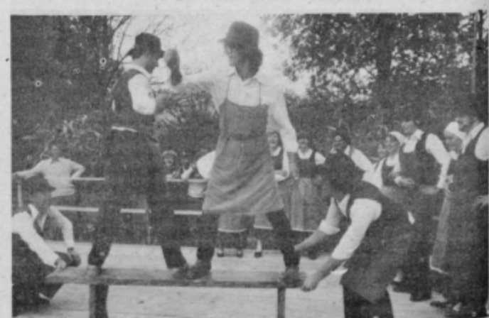
Nastop folklorne skupine Janko Živko iz Poljčan je navdušil s svojo izvornostjo plesov in iger