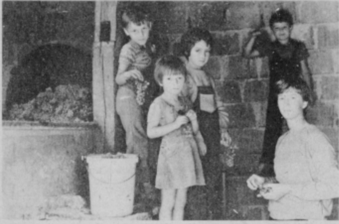
Za otroke je posebno veselje v preši, kjer je sladko grozdje in teče most

Lepo sončno vreme je letošnji jesen pritegnilo v vinograde že 20. septembra v trgatve vse tiste, ki imajo bolj rane sorte, po drugem oktobru pa trgajo že vsi od kraja, saj je prav zadnji teden vreme precej ponagajalo in nekatere sorte grozdja močno gnijejo. Sicer pa je letos