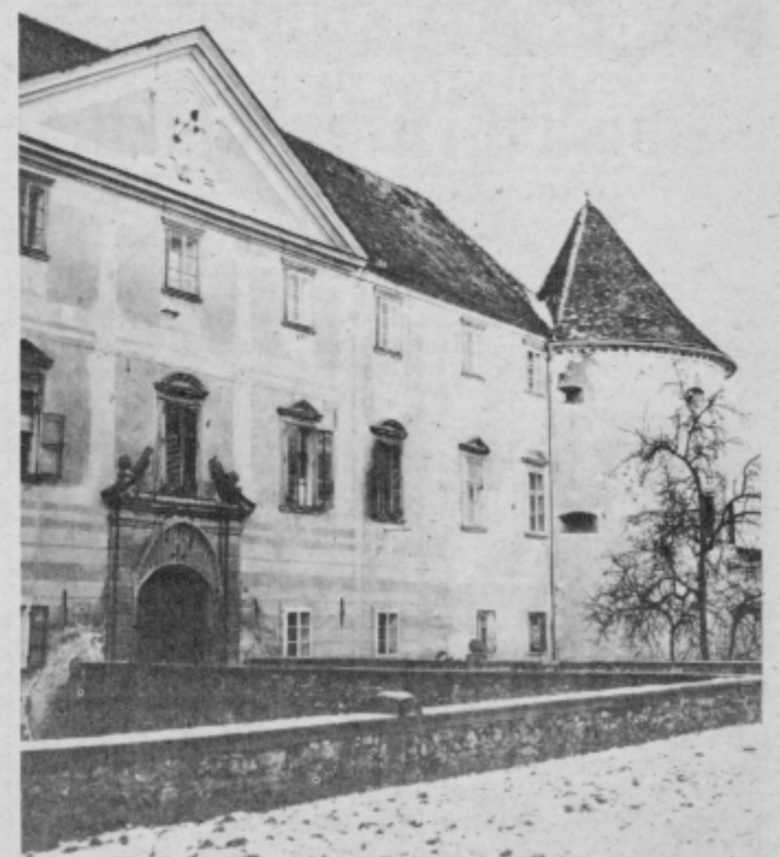
Slovenska Bistrica — vhodna fasada dvorca z baročnim portalom in sklopom iz 16. stolejja

predelave v renesančni dobi. Zidava je neurejena, s komaj nakazano željo po plastenju, kar stavlja nastanek utrdbe v čas gotike. Grad je bil od pobočja v ozadju ločen z globokim, delno še h ohranjenim jarkom.