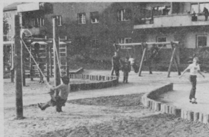
Lepo urejeno igrišče — želja vseh otrok