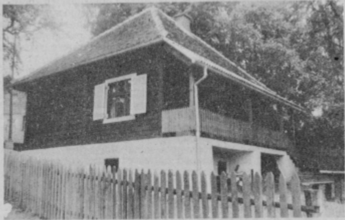
Ena od obnovljenih hiš, ki ohranja domačnost in se vključuje v okolje.

Nova asfaltna cesta, ki povezuje ta kraj in širše pohorsko zaledje z občinskim središčem Slovenska Bistrica, trgovina, gasilski dom, zdrav-