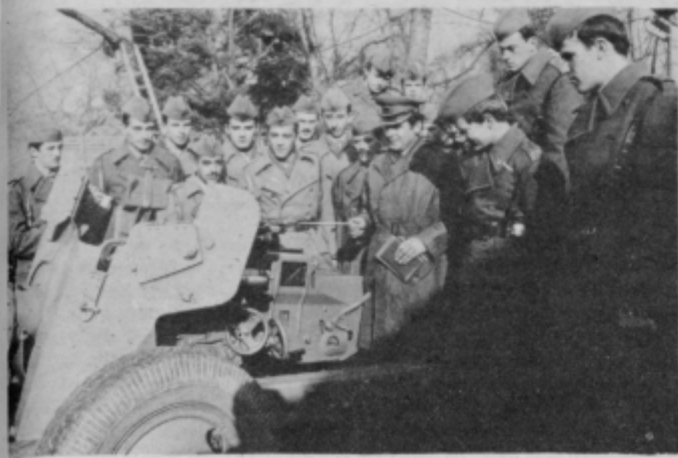
Solanje bodočih topničarjev