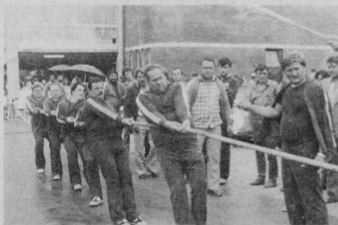
Vlečenje vrvi — Ptujčani so omagali v finalu

Obrtni sejem v Celju ni namenjen samo poslovnemu življenju,