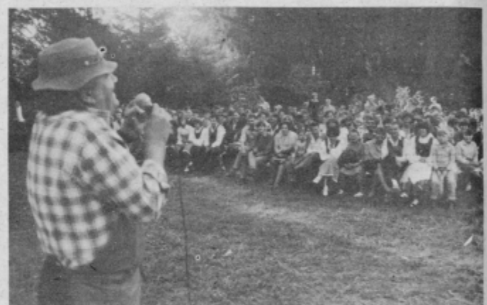
Humorist Celjski Poldek ni skoparil z bodicami iz sedanosti