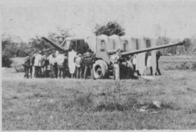
Sodelovanje z rezervnim kadrom je izredno dobro