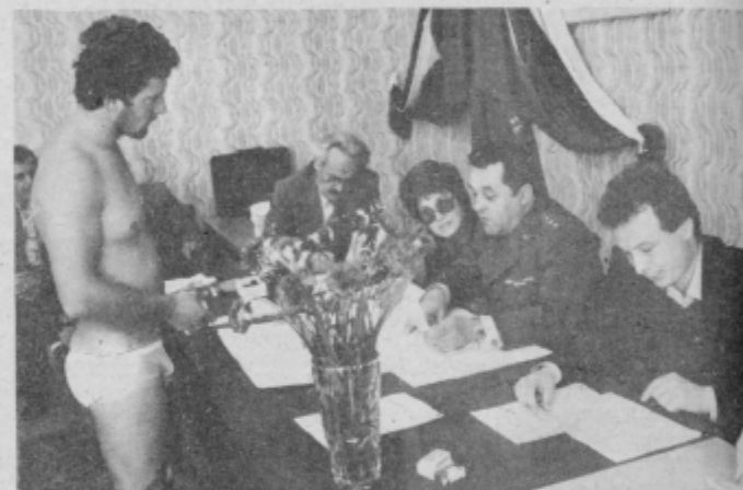
Pred naborno komisijo so se vrstili mladi obvezniki, bodoči branilci naše samoupravne socialistične domovine.