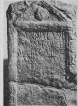
Nagrobnik legionarja iz Celja

Nagrobni so kamniti spomeniki z napisi in z raznovrstnimi plastičnimi upodobitvami. Navadno so izdelani iz peščenca ali iz grobo in finoizrnatega marmorja. Ti so poleg rimskih novcev prvi pisemski dokumenti z našega območja. Razvozlavanje napisov na teh nagrobnikih je hkrati tudi „neposredni stik“ s pokojniki, ki so nekoč tukaj živeli, delovali ali opravljali razne funkcije. Od njih izvemo, kdo je bil pokojnik, od kod je bil doma, kje je služboval, je bil Rimljan ali ne itd. Tako vedno znova pridobivamo podatke, ki potrjujejo ali celo odvržejo razne domneve in pisane zgodovinske viře.