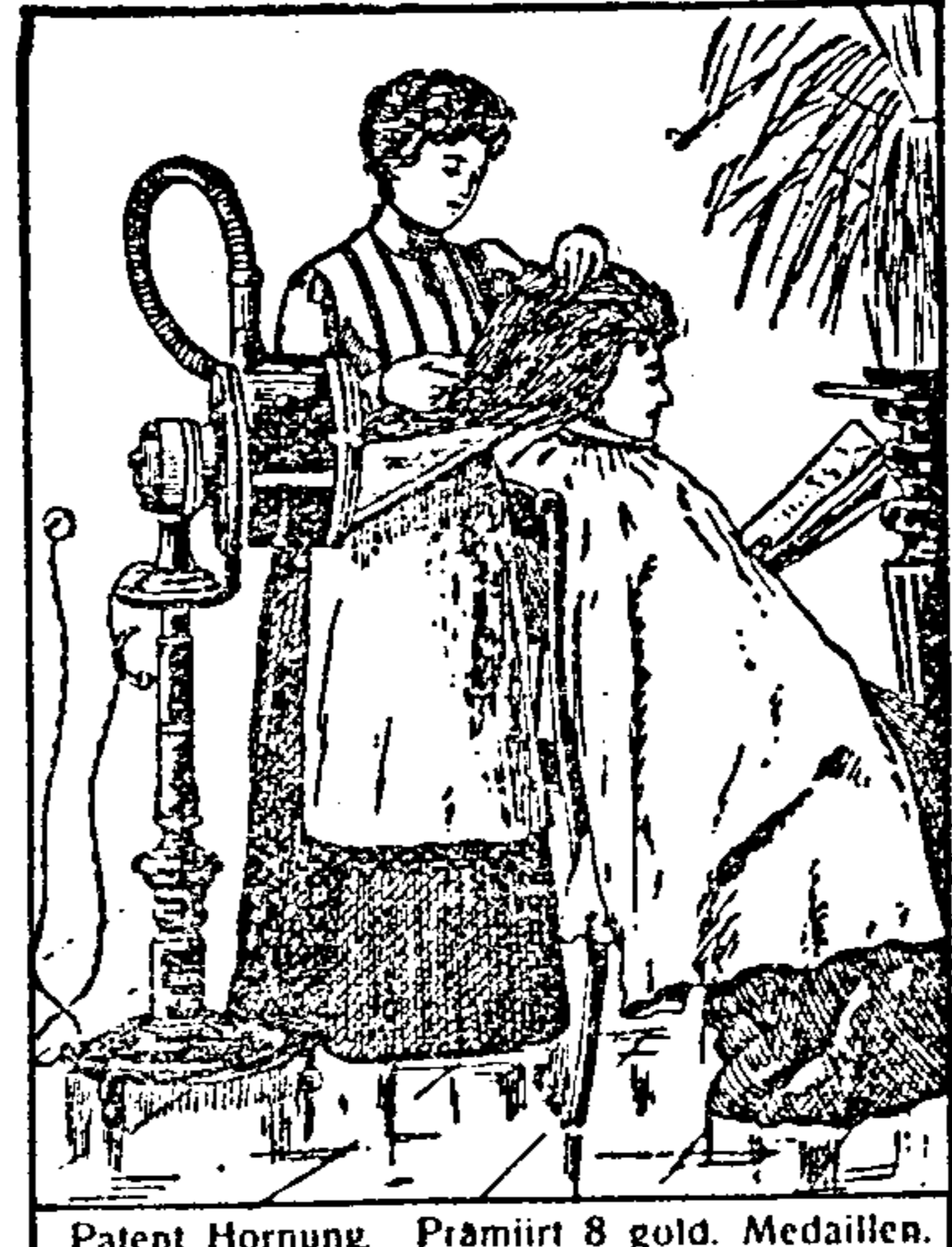
Patent Hornung. Prämiiert 8 gold. Medaillen.

Lohner oder Verwalter für Weingartrealität in d. Nähe der Stadt Marburg wird gesucht. Adressen erbeten unt. „Lohner“ an die Verw. d. Bl. 2197