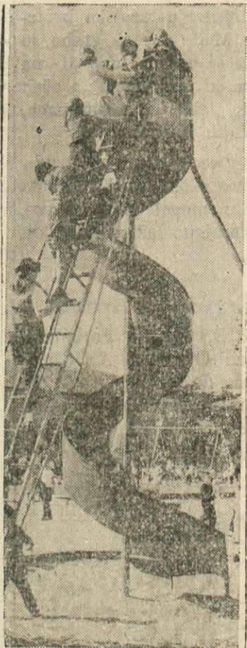
ZA ZABAVO — Na mestnem igrišču v San Franciscu so postavili spiralno drčo v veliko zabavo otrok.

Prišli so strokovnjaki, ki so ugotovili, da gre za 700 let staro hišo, ki je dolga stoletja lezla v zemljo, tako da je zdaj njeno pritličje v višini kletnih prostorov. Hišo so začeli previdno izkopavati.