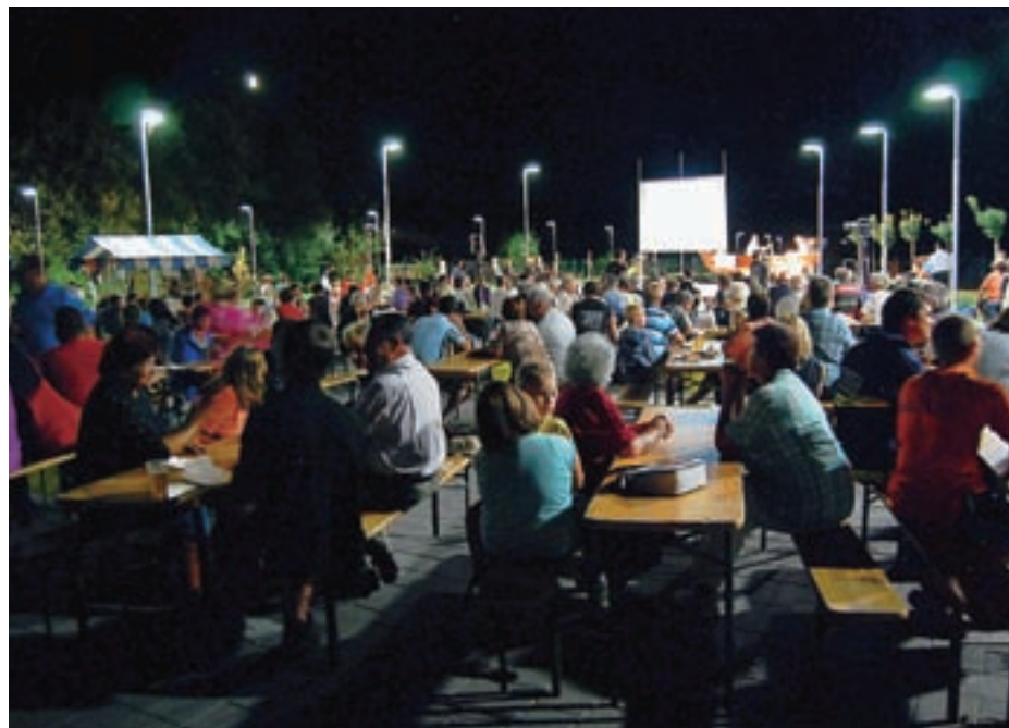
Na novem Vaškem trgu so se zbrali številni krajanjani.

Prireditve ob praznovanju sedemstoletnice prve omembe Zbilj so se začele 2. septembra, zaključujejo pa se 9. septembra. Poleg osrednje prireditve so pripravili še uzvočevanje, slikanje v naravi, tržnico domačih in umetniških izdelkov, plein air slikanje, žegnanjsko sv. mašo, blagoslov vaškega trga, otroško predstavo Medvedek Pu, ogledali ste si lahko filme pod zvezdami s predvajanjem arhivskih filmskih zapisov povezanih z Zbiljami, v tem tednu pa prisluhnili Jesenskim serenadam.