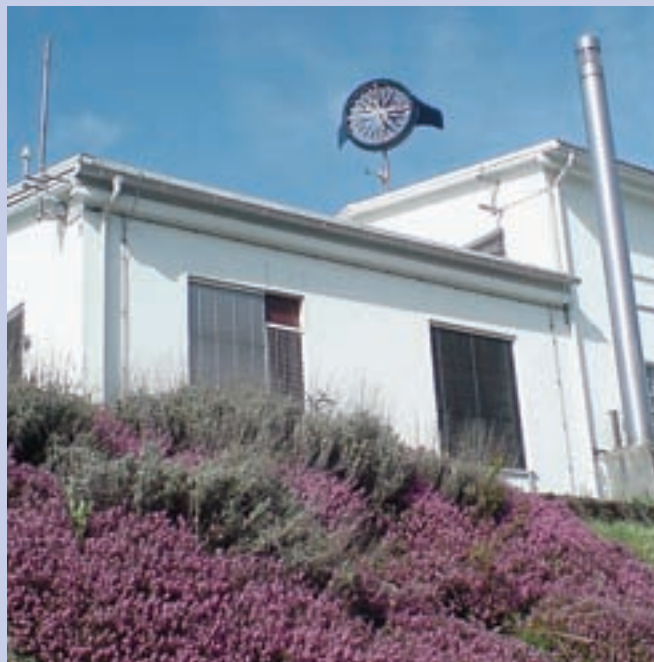
Malo vetrno elektrarno so v Savskih elektrarnah postavili letos maja.