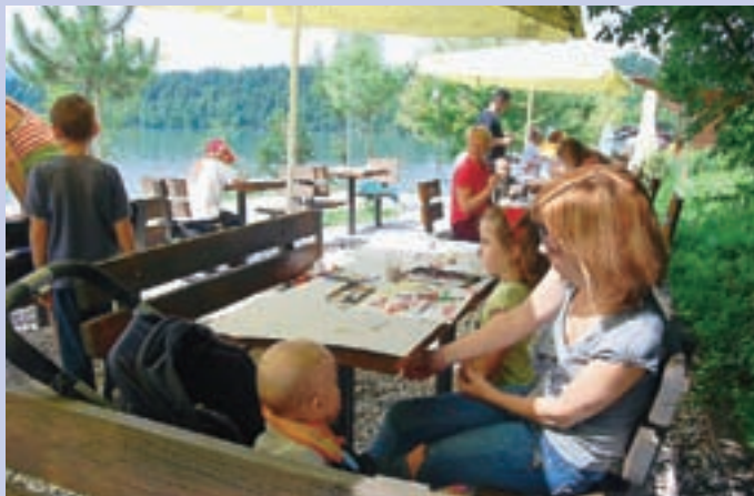
Delavnice so dobro obiskane.