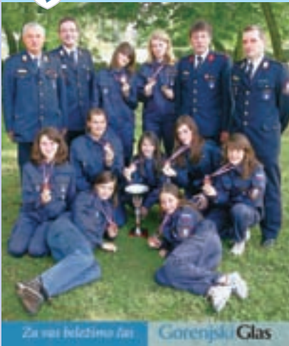
Za vas beležimo žari Gorenjski Glas

Na naslovnici: Srebrne mladinke PGD Zbilje z mentorji in predsednikom društva