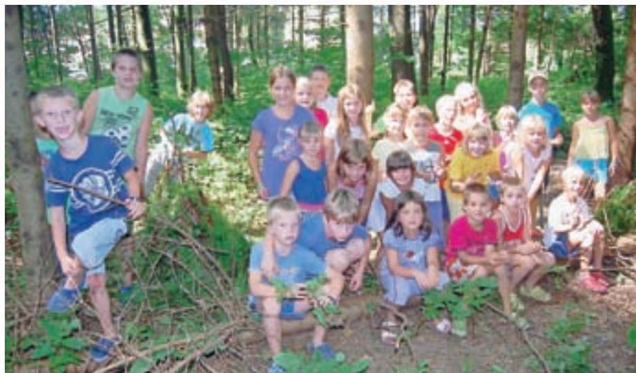
Skupinska fotografija, ki je nastala ob našem obisku, ko so bili otroci v naravi.