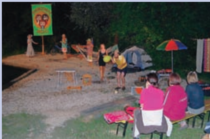
Trije robinzoni in dve ženski v komediji v naravi ob toplem vrelcu Straža