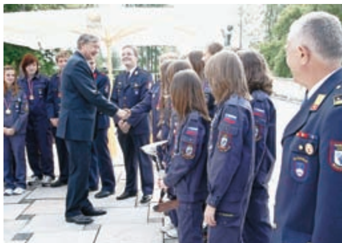
V sredo, 7. septembra, jih je na Brdu pri Kranju sprejel predsednik države dr. Danilo Türk.