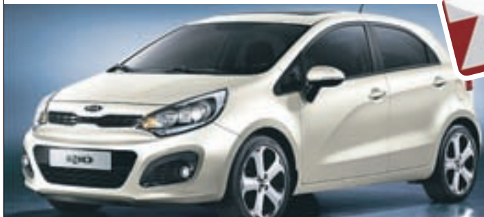
Čisto novi KIA Rio

PRODAJA VOZIL: 051 612 888 TRGOVINA: 01/ 361 22 55 SERVIS: 01/ 361 75 20