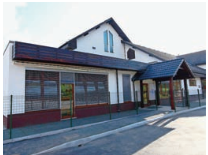
Precej bolj gladko pa je šlo pri vrtcu v Sori, dislociranem oddelku enote Ostržek.