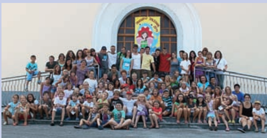
Skupinska fotografija udeležencev oratorija v Smledniku

Oratorij so imeli tudi v Sori, kjer se ga je v tednu od 16. do 21. avgusta udeležilo kakih