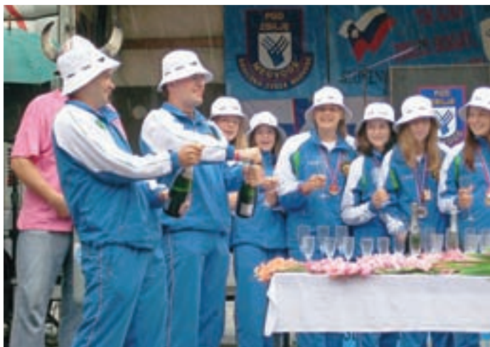
Ob vrnitvi v Zbilje so mlade gasilke sprejeli številni navijači. Sledilo je tudi odpiranje šampanjca. Za dekleta je bila seveda pripravljena brezalkoholna penina.