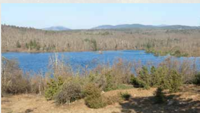
Veliko Drskovško jezero (ob izjemno veliki ojezeritvi marca 2014)