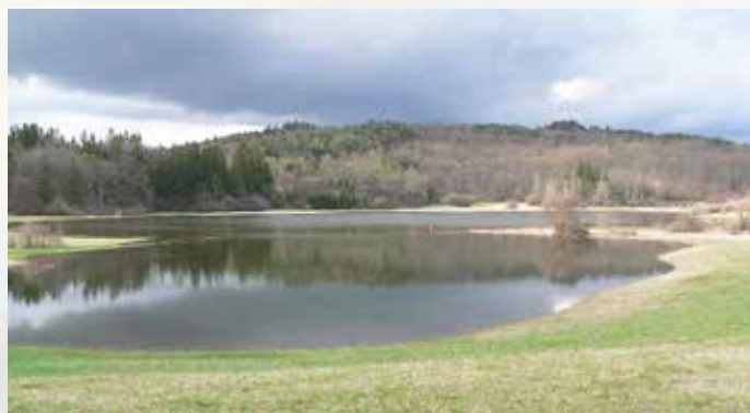
Jezerce v kotanji pod izviri (v ozadju) in že spojeni jezerca v kotanji z grezi in osrednji kotanji.