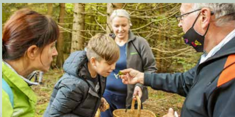
Krajinski park pivška presihajoča jezera