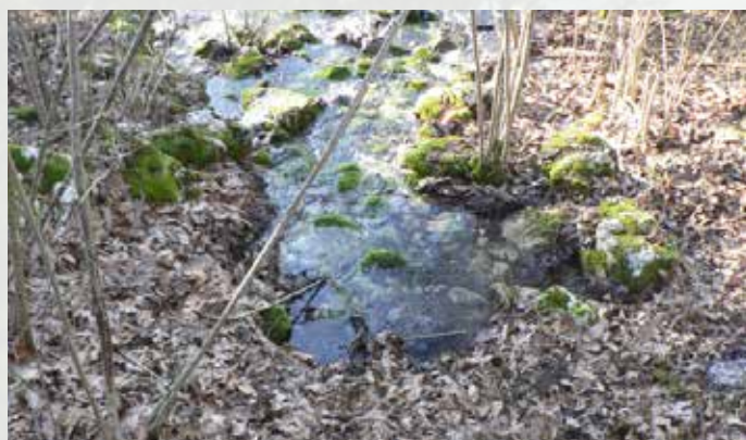
Potok iz višjega izvira

Ob polnjenju Velikega Drskovškega jezera se najprej pojavijo luže v kotanji z grezi (imenovani Jernejeva mlačca). Nato se pojavijo vsa tri jezerca v plitvih kotanjah, ki se postopno spojijo (najprej jezerca v kotanji z grezi in osrednji kotanji). Ob veliki ojezeritvi jezero dobi manjši zaliv v stranski kotanji na severnem obrobju in narašča po potokih iz obeh izvirov, dokler ju ne zalije ob zelo veliki