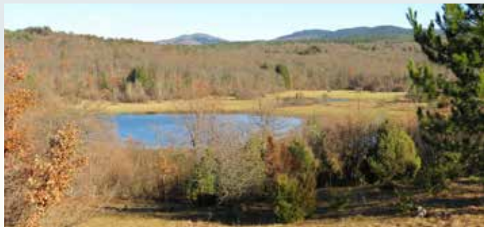
Jezerca v kotanji Velikega Drskovškega jezera, slikano v smeri izvirov.

ojezeritvi. Ob izjemno veliki ojezeritvi pa jezero sega v spodnji del pobočij jezerske kotanje s stransko kotanjo.