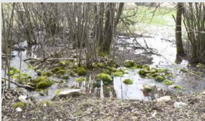
Nižji izvir z izvirnima krakoma

Na vzhodnem obrobju dna kotanje Velikega Drskovškega jezera leži nižji izvir v kamenju, poraslem z mahom, v obliki polkroga. Izvir ima dva izvorna kraka, ki obdajata grmovje na meji s travnikom. Kraka se združita v potok v plitvi travnati strugi z dvema vijugama. V bližini tega izvira leži višji izvir v poraščenem pobočju, kjer voda prihaja na površje v kamenju, poraslem z mahom. Nato potok doseže plitvo travnato strugo in se izliva v potok, ki priteče iz nižjega izvira. Struga tega potoka se zaključi na obrobju kotanje pod izviri. Potok se zopet pojavi na drugi strani te kotanje, kjer ga napaja samo jezerce, ki se pojavi v njej. Ta potok pa teče v neizraziti strugi, ki se zaključi na obrobju osrednje kotanje.