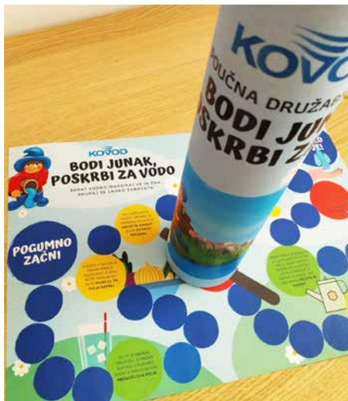
Kovod Postojna, d.o.o.

učnih uric. Nabor prijetnih in poučnih gradiv različnih težavnosti, vsebinsko vezanih na dejstva, pomen in informacije o vodi ter varovanju okolja nasploh, bo namenjen vrtcem in šolam, v smislu dodatnih gradiv, premostitvenih dejavnosti ali kot popestritev.