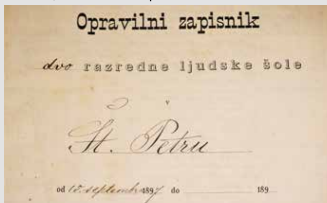
Prva stran Opravilnega zapisnika