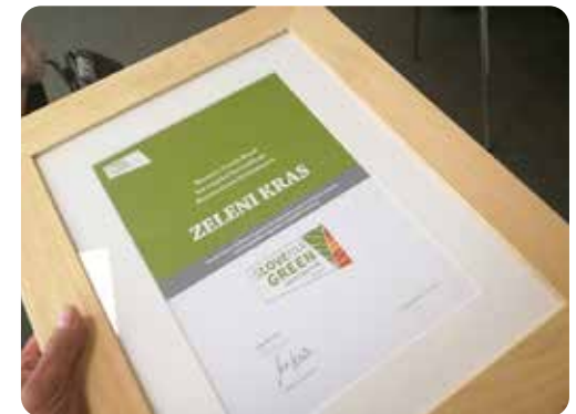
Prejem znaka Slovenia Green bronze

Med drugim pa smo kot destinacija Zeleni kras, ki pokriva Primorsko-notranjsko regijo, prejeli znak Slovenia Green bronze in se tako zavezali k sledenju in spodbujanju dobrih trajnostnih praks na področju gospodarske, okoljske in družbene odgovornosti ter neposredno sodelovati z dobavitelji, strankami in skupnostjo, da storijo enako.