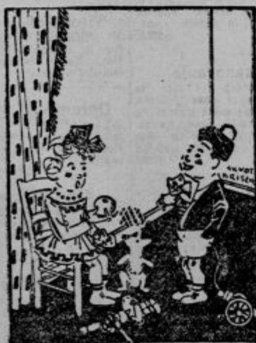
— Anica, ali si za to, da se igrava Adama in Evo? — Kako misliš? — Ponudila bi mi jabolko, da me preskusiš, ali bi ga pojedel! (Malina)

Podkoren spi, široko razleknjen po položnem klancu in se greje v dobrovoljnem jesenskem solncu. Nageljni venč ob deviških lincih, rožmarin se razspilje, samo dekliski obrzi še cvetijo in oči se smejejo izza gostih obrvi živo in toplo, ker še niso bile videlo jeseni nikjer. Skozi dolnico vodi široka, zapuščena cesta in se ustavi v Borovški vesi. Kraj ceste pokopališče.