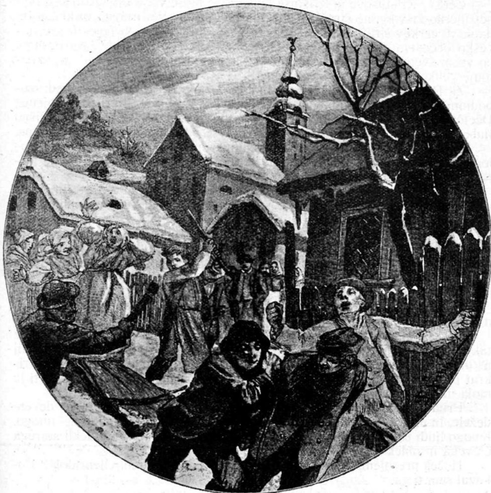
„ Ploh “ vlačijo.

V puščavo, v samoto se moraš od časa do časa umakniti tudi ti, dragi prijatelj, če hočeš vedno hoditi po pravih stezah, zlasti pa še, če hočeš biti drugim vodnik k resnici. Tihe ure, ure samotnih razgovorov resnicoljubne duše z Bogom, so nujno potrebne zlasti vsem vam mladeničem na deželi,