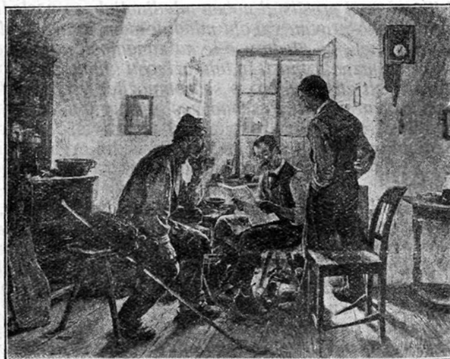
Časopis je prišel.

Stopimo k sosedovim, boste videli, kako zanimivi in poučni bodo ti naši obiski! Ni ga odraslega človeka v soseski, o katerem ne bi mogel napisati celega življenjskega romana in vsi ti romani bi bili tako zelo različni med seboj, kot so različni obrazi sosedov, ki jih dobro poznamo. Marsikateri roman bi opisoval boje in zmage, padce in vstajenja ljudi, ki se nam na prvi