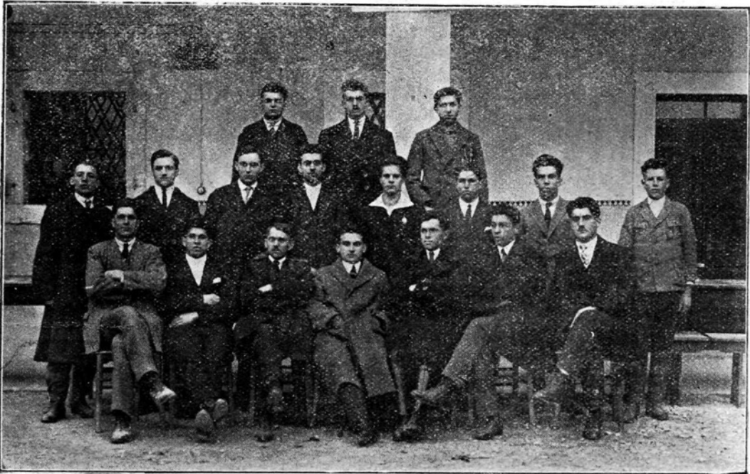
Vaditeljski zbor Prosvetne zveze.

narednik — felđwebel — kočijaž. Res, da so z menoj bolj obzirno ravnali, ker so vedeli, da ob letu postanem poročnik, torej višji od njih, in se lahko maščujem za sedaj storjene mi krivice, a drugi tovariši so pa le trpeli. Niso bili vajeni one točnosti, kakor se je tu zahtevala. Doma je lahko ugovarjal, ali še povprašal, kako in zakaj naj se to dela. Obotavljal se je in nič kaj požuril izvršiti, kar je oče ukazal ali mati velela. Tu pa je treba takoj, brez ugovora ali odlašanja brzo storiti, kar se je ukazalo. Prehod iz domače hiše v vojašnico je bil prehud, oni, ki je telovadil kaj doma, je ta prehod nekako premostil in mu je lažje šlo, med tem ko je netelovadec na tihem klel, češ, kaj se vsaja in sitnari ta pokveka — šarž — pred našo vrsto.