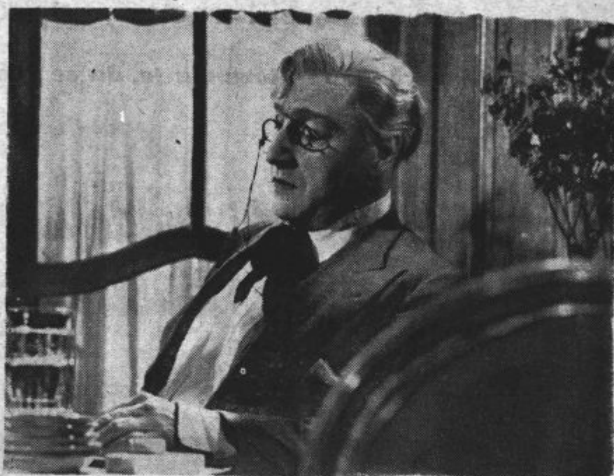
Sacha Guitry v filmu „Sleparjev roman“