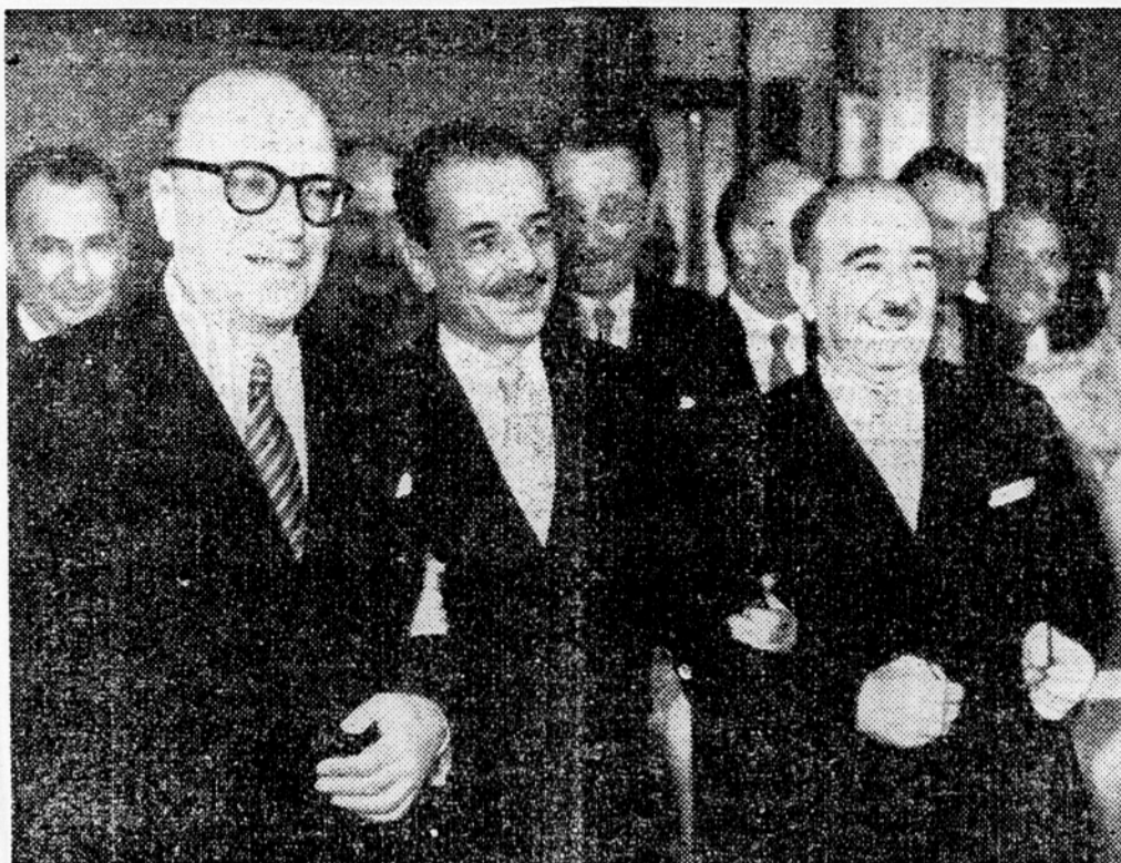
Zadovoljstvo in veselje treh zunanjih ministrov balkanskih držav po podpisu sporazuma o Balkanski zvezi

Omenili bi še to, da je pri določilu, da bodo ratifikacijske listine deponirane v grškem zunanjem ministrstvu, obveljalo načelo rotacije, to se pravi, da je bil ankarški sporazum deponiran v Beogradu, sporazum o Balkanski zvezi bo deponiran v Atenah itd. Skozi vse besedilo sporazuma o Balkanski zvezi se vije kot nepretrgana nit, spoštovanje, ki ga čutijo tri balkanske države do Organizacije Združenih narodov, ravno tako pa se čuti želja vseh treh držav po miru in vsestranskem razvoju. To je videti tudi po sporočilu o balkanski posvetovalni skupščini, ki bo poleg sporazuma o Balkanski zvezi, pomenila velik korak naprej v konsolidaciji miru in zagotovila hitrejši napredek na vseh področjih v jugovzhodni Evropi. A. F.