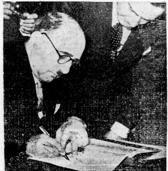
Turški zunanji minister prof. Fuad Köprülü podpisuje sporazum

Vremenska napoved za torek: Precejšnja, menjajoča oblačnost, vmes nekaj padavin, predvsem krajevne značaja. Temperatura ponoči med 12 in 16, čez dan do 28 stopinj Celzija.