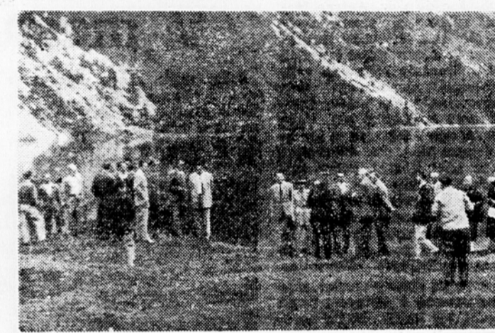
V nedeljo so bile delegacije treh balkanskih držav na izletu pri Bohinjskem jezeru

Minister za zunanje zadeve Turčije prof. Köprülü je izrekel med kosilom naslednjo zdravico: »Občutim se zelo srečnega in privilegirana zaradi dejstva, da je to kosilo prvo, ki nas združuje po podpisu naše pogodbe o zvezi, političnem sodelovanju in vzajemni pomoči. Občutke, ki so me obdajali med tako veličastno svečanostjo podpisovanja v lepi vili »Bled«, so bili občutki zadovoljstva, utehe in ponosa.