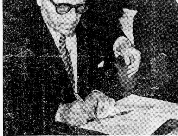
Grški zunanji minister Stefanos Stefanopoulos pri podpisu pogodbe o Balkanski zvezi

Odločili so tudi, da se bo osnoval znanstveni balkanski inštitut za proučevanje vprašanj, ki so skupna na področ-