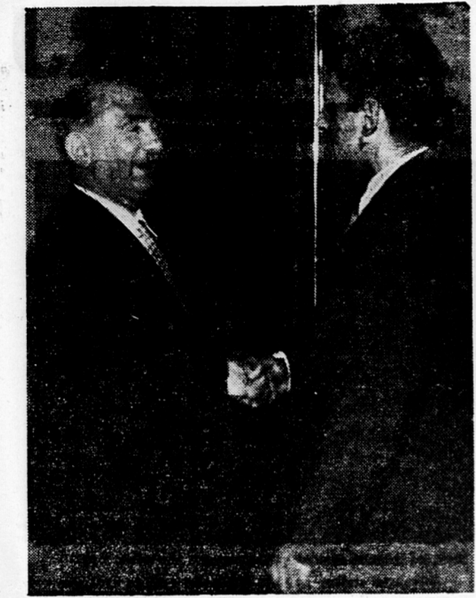
Turški zunanji minister g. Fuad Köprülü se pozdravlja s Kočo Popovičem