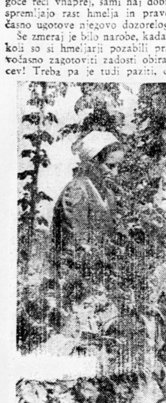
V Savinjski dolini dozoreva hmelj

V Savinjski dolini se hmeljarji že pripravljajo, da pospravijo letošnji pridelek hmelja. Morda se bo zaradi letošnjega vremena, ki je nekoliko zavrla rast, zakašnilo tudi obiranje, toda kot kaže ne več, ko za nekaj dni. Kdaj bodo hmeljarji začeli obirati, ni mogoče reči vnaprej, sami naj dobro spremljajo rast hmelja in pravočasno ugotovijo njegovo dozorelost. Še zmeraj je bilo narobe, kadar koli so si hmeljarji pozabili pravočasno zagotoviti zadosti obiralcev! Treba pa je tudi paziti, da