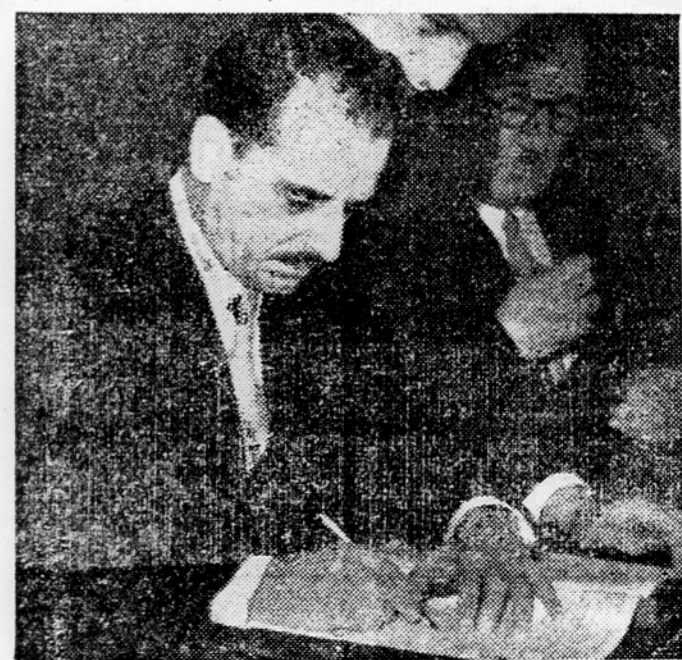
Državni sekretar za zunanje zadeve Koča Popović podpisuje zgodovinski dokument

S čl. 7. se članice Balkanske zveze obvezujejo, da bodo spoštovale določila Združenih narodov za primere napadalnosti, v kolikor bodo učinkovito izvedeni, poleg tega pa je za vse tri balkanske države z današnjim dnem postala pravna obveznost resolucija generalne skupščine OZN, ki jo je 17. novembra 1950 predlagal Edvard Kardelj. Po tej resoluciji mora napadena država takoj objaviti, da je pripravljena prenehati s sovražnostmi in umakniti čete, ki so morala že na sovražnem ozemlju, na svoje meje. Namen tega določila je, odstraniti v primeru oboroženega spopada vsakršne dvome glede tega, kdo je žrtev napadalnosti in kdo je napadalec.