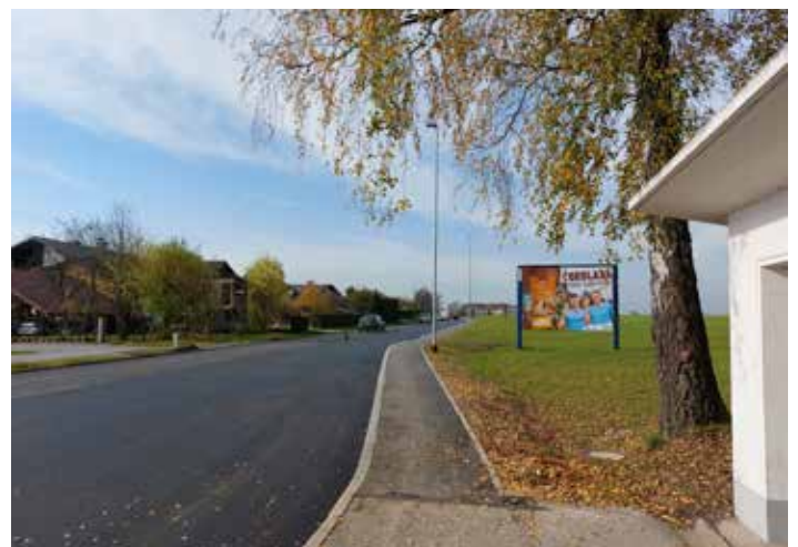
Preplastitev odseka 292 regionalne ceste R2-447 (Trojane–Želodnik).