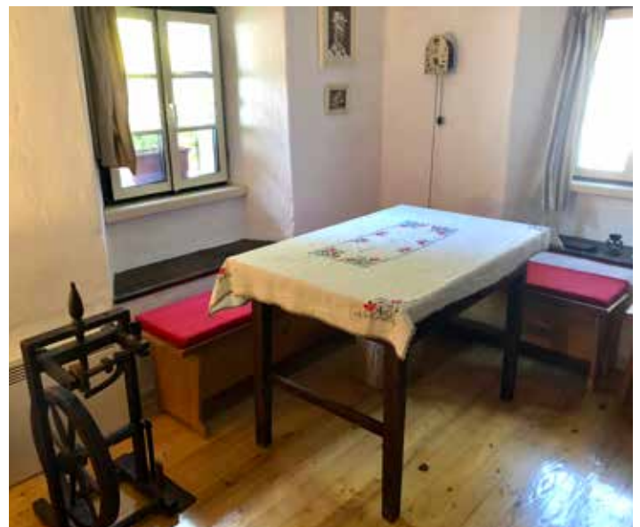
Prostori in hiši ohranjajo pridih preteklosti.