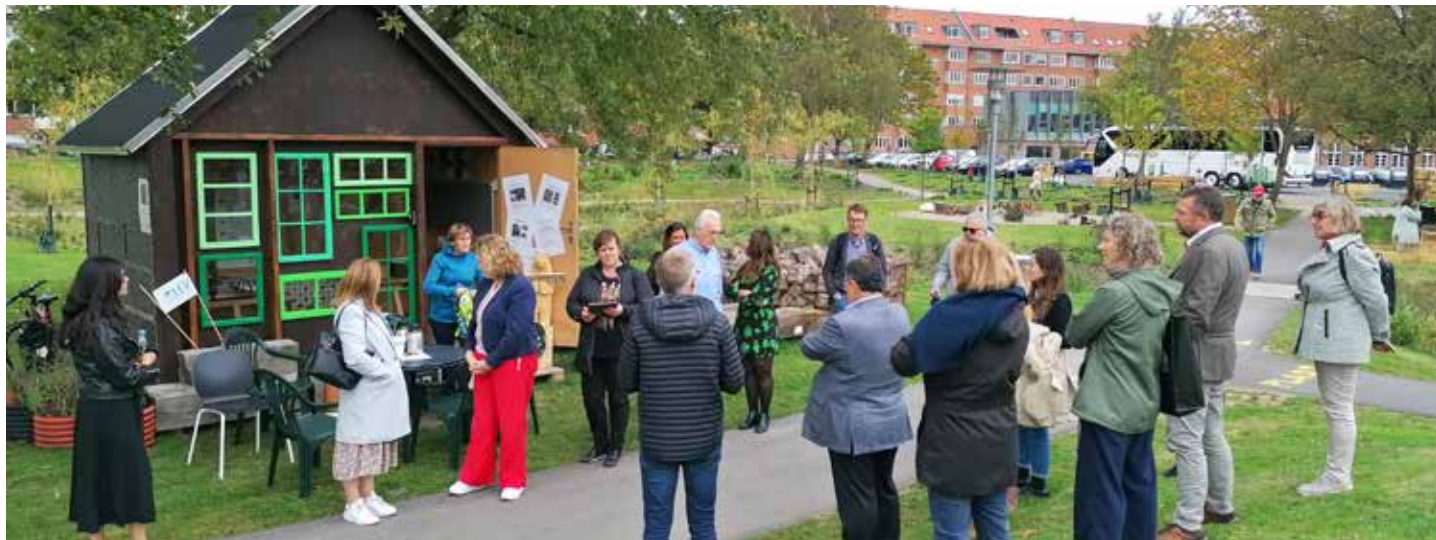
Ogled SPARK-a, novega urbanega prostora za rehabilitacijo in socialno vključevanje.