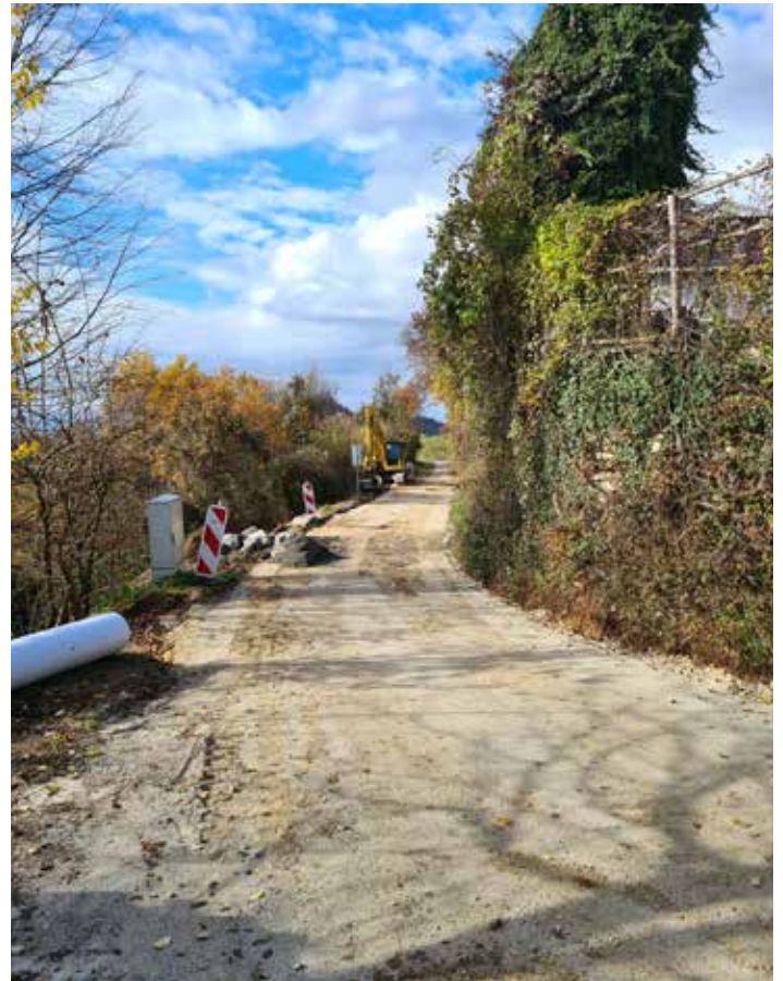
Rekonstrukcija lokalne ceste skozi naselje Koreno.