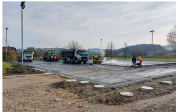
Športni park v Šentvidu pri Lukovici pred zaključkom prve faze.