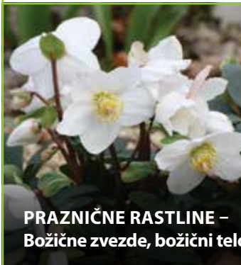
PRAZNIČNE RASTLINE – Božične zvezde, božični telohi, okrasne smrekce, ...