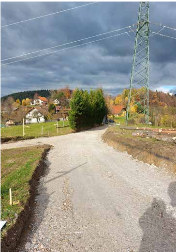
Asfaltiranje cestnega odseka Čeplje–Znojilo.