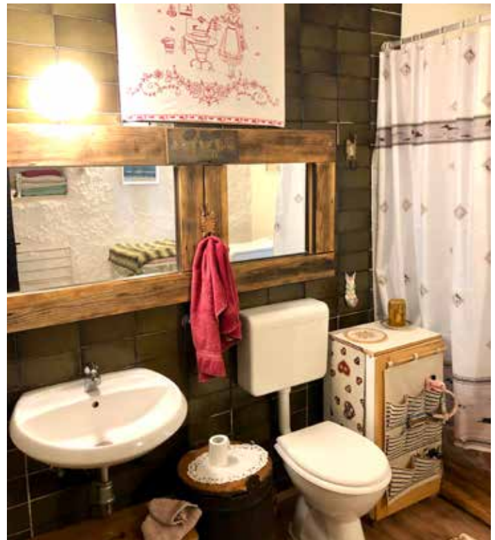
Del preurejene kopalnice.