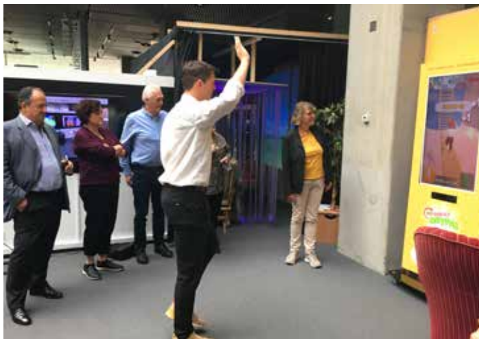
Ogled demonstracijskega prostora DokkX za preizkus različnih tehnologij in orodij za samostojno in aktivno življenje starejših.

»Možnost ogleda praks drugih držav in izmenjava izkušenj je vedno dobrodošla. Ne le zaradi iskanja možnosti razvoja in prenosa praks, ki se v drugih državah izkažejo kot uspešne, ampak tudi zato, ker se tako mnogokrat potrdi, da imamo v Sloveniji veliko dobrih rešitev, ki naslavlajo potrebe državljanov. Ključno sporočilo ogleda dobrih praks na Danskem se mi zdi v zavedanju države, da so človeški viri omejeni in da je potrebno poiskati možne rešitve racionalizacije potrebe po kadrih, pri čemer