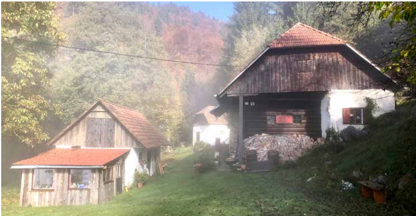
Jasnarjeva domačija: desno hiša, levo nekdanji svinjak in nova delavnica, v ozadju mlin.