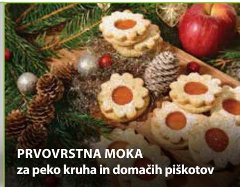
PRVOVRSTNA MOKA za peko kruha in domačih piškotov