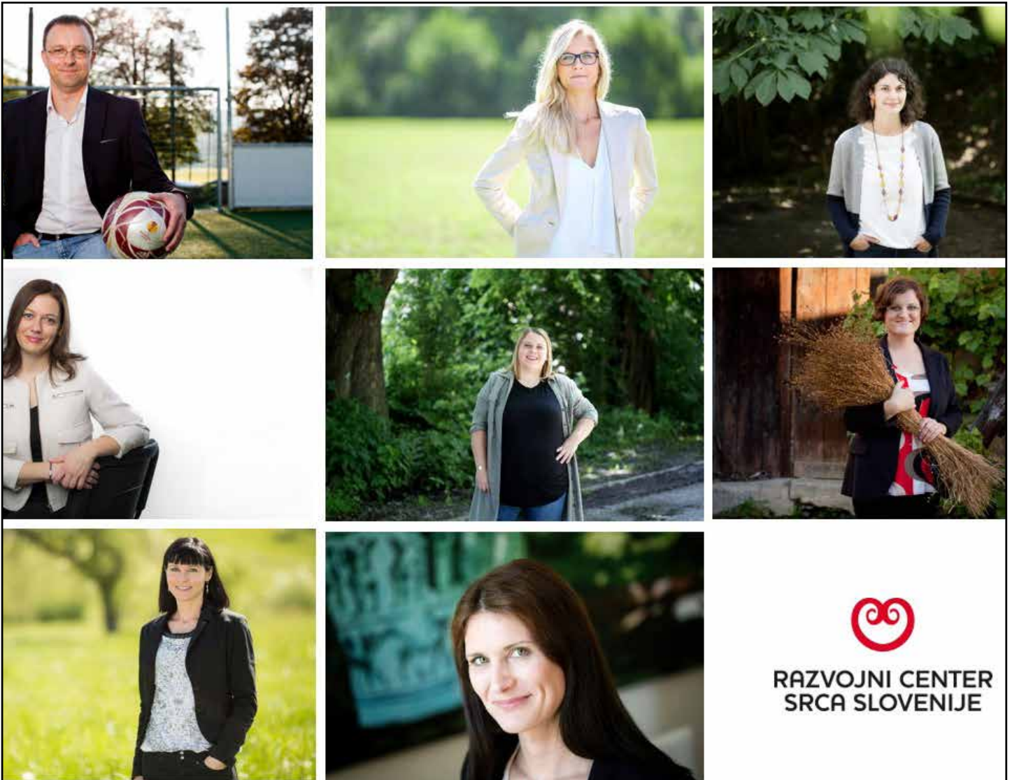
Ekipa Razvojnega centra Srca Slovenije.

Na Razvojnem centru Srca Slovenije smo bili uspešni pri prijavi kar petih mednarodnih projektov na dveh programih, Erasmus+ in Interreg Europe. Kot izkušen in zanesljiv partner tako nadaljujemo svoje delo v smeri razvoja podjetništva, turizma in izboljšanja pogojev za življenje starejših v lokalnem okolju šestih partnerskih občin ter širše na nacionalni ravni.