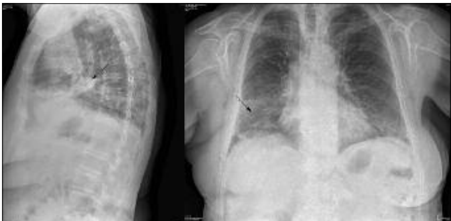
Slika 2. Tri mesece in pol po začetku zdravljenja je opazen ostanek infiltrata v srednjem pljučnem režnju.

Bolnico smo pričeli zdraviti s protituberkuloznimi zdravili po običajni shemi. Glede na telesno težo je v začetnem dvomesečnem intenzivnem obdobju zdravljenja prejela štiri zdravila: rifampicin 720 mg, izoniazid 300 mg, pirazinamid 1800 mg in etambutol 1600 mg dnevno. Zdravljenje je dobro prenašala, pomembnih sprememb v laboratorijskih izvidih nismo opazili. Po treh tednih zdravljenja v dveh zaporednih izmečkih ni bilo več bacilov tuberkuloze. Po enem mesecu bolni-