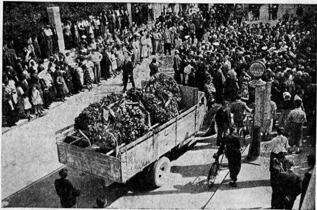
V Ljubljani pred Akademskim domom: Tovorni avto, poln vencev, ki so jih poklonili na krsto štajerski Slovenci

Zgodovina gradu je res nudila ljudski domišljiji obilo snovi za vse mogoče bajke o strahovih, vendar pa so se gotovo že v starih časih našli predrzni in zakrknjeni zločinci, ki se posmehujejo vsem »strahovom«, izrabljajo