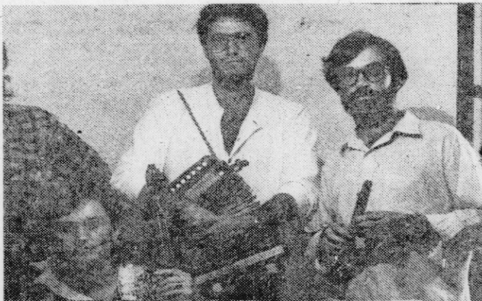
Del ansambla Istranova, ki nastopa v galeriji Equrna in v Ribnici