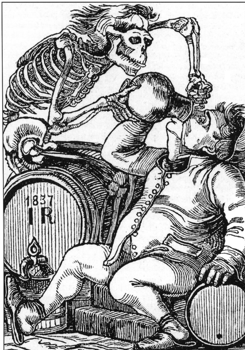
Smrtonosen pohod žganjarske kuge je zajel naše kraje že v predmarčni dobi.