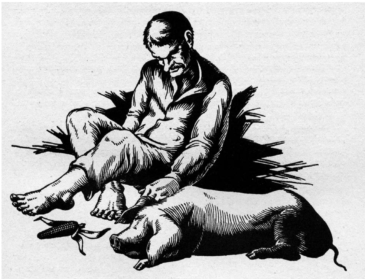
Pijance so pogosto enačili z živalmi. (Andrija Štampar, Narodna čitanka o alkoholu, Zagreb 1931.)

porodnicami ter pravi: »Razlagamo si to s tem, da so njihovi starši pogosto psihično manj vredni, oni sami često spočeti v alkoholnem stanju, njihova vzgoja pomanjkljiva, njihove življenjske razmere neugodnejše.« 68