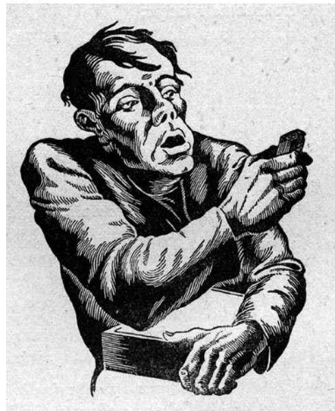
Alkoholizem povzroča degeneracijo posameznika, naroda in rase. (Andrija Štampar, Narodna čitanka o alkoholu, Zagreb 1931.)

naj bi bilo vsekakor vzrok za blaznost, zlasti naj bi povzročilo posebno blaznost, t. i. »alcoholismus chronicus«, katerega glavni znak naj bi bil duševni propad. 49